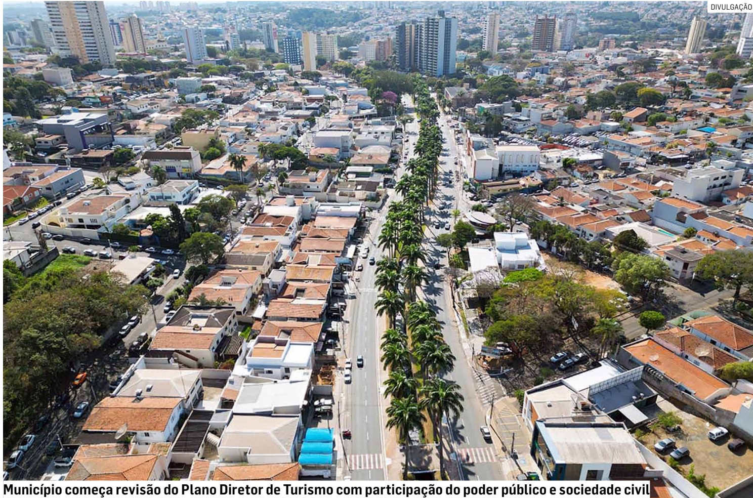
Município começa revisão do Plano Diretor de Turismo com participação do poder público e sociedade civil

O Plano Diretor de Turismo reúne informações sobre infraestrutura urbana, acessos, aspectos culturais, patrimônio histórico, dados geográficos e potencial econômico do município ligado ao setor turístico. A proposta também busca consolidar a participação de Americana no desenvolvimento regional.