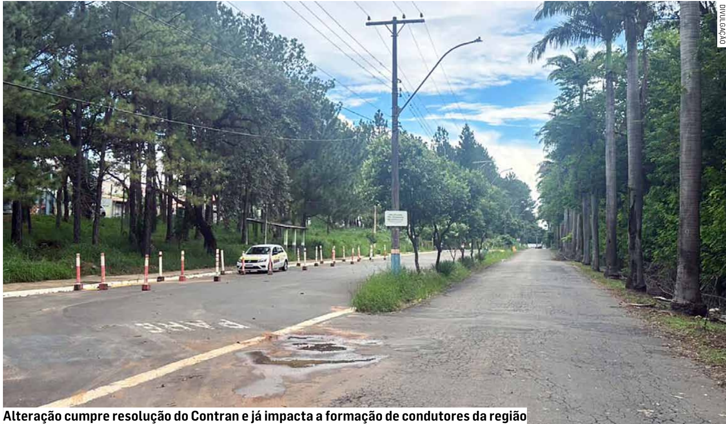
Alteração cumpre resolução do Contran e já impacta a formação de condutores da região

A alteração entrou em vigor em janeiro do ano passado após publicação da Resolução nº 1.020/2025 do Conselho Nacional de Trânsito (Contran), que retirou oficialmente a obrigatoriedade da baliza como etapa eliminatória no exame prático para obtenção da CNH.