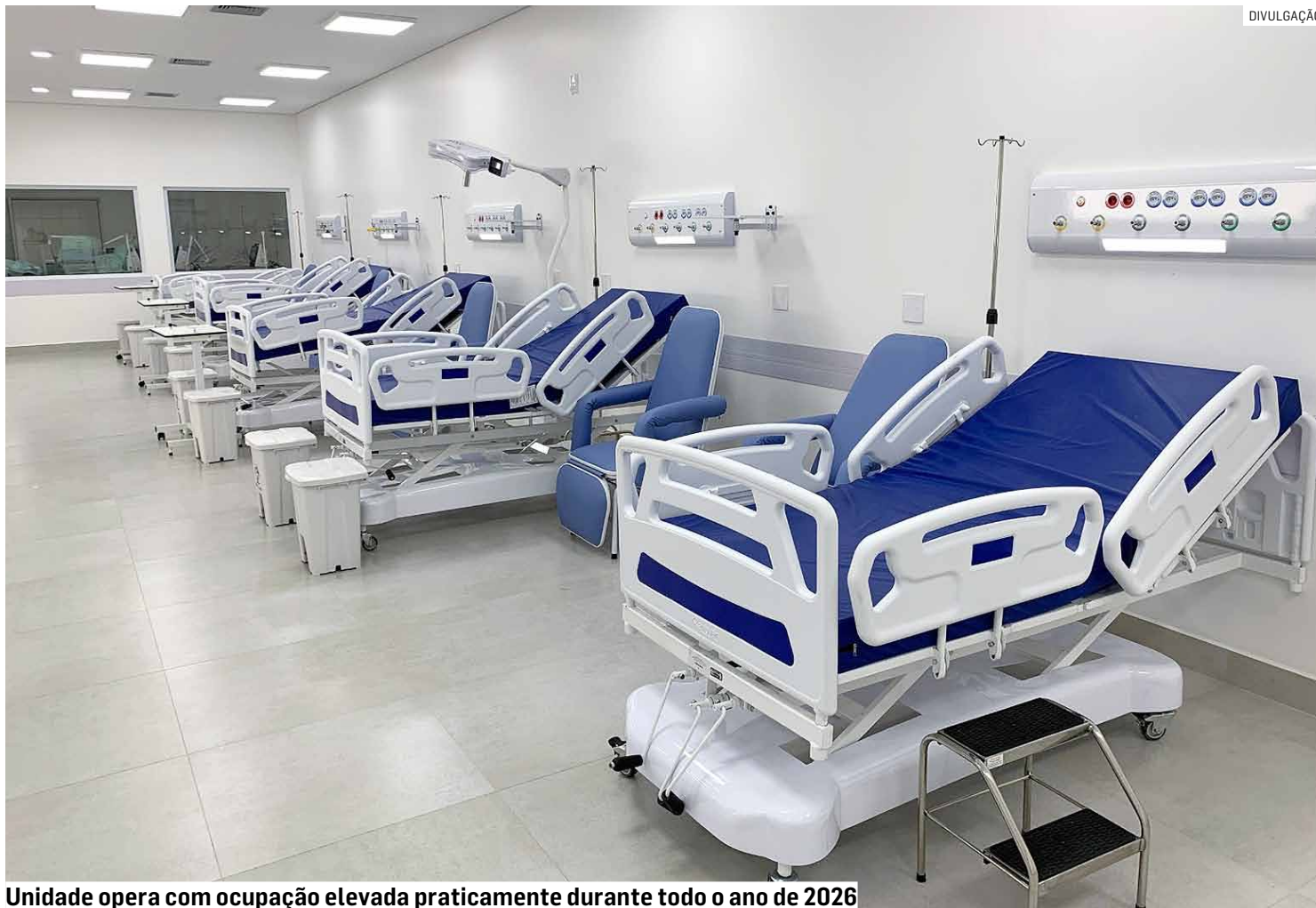
Unidade opera com ocupação elevada praticamente durante todo o ano de 2026

Em 2025, a ocupação média anual saltou para