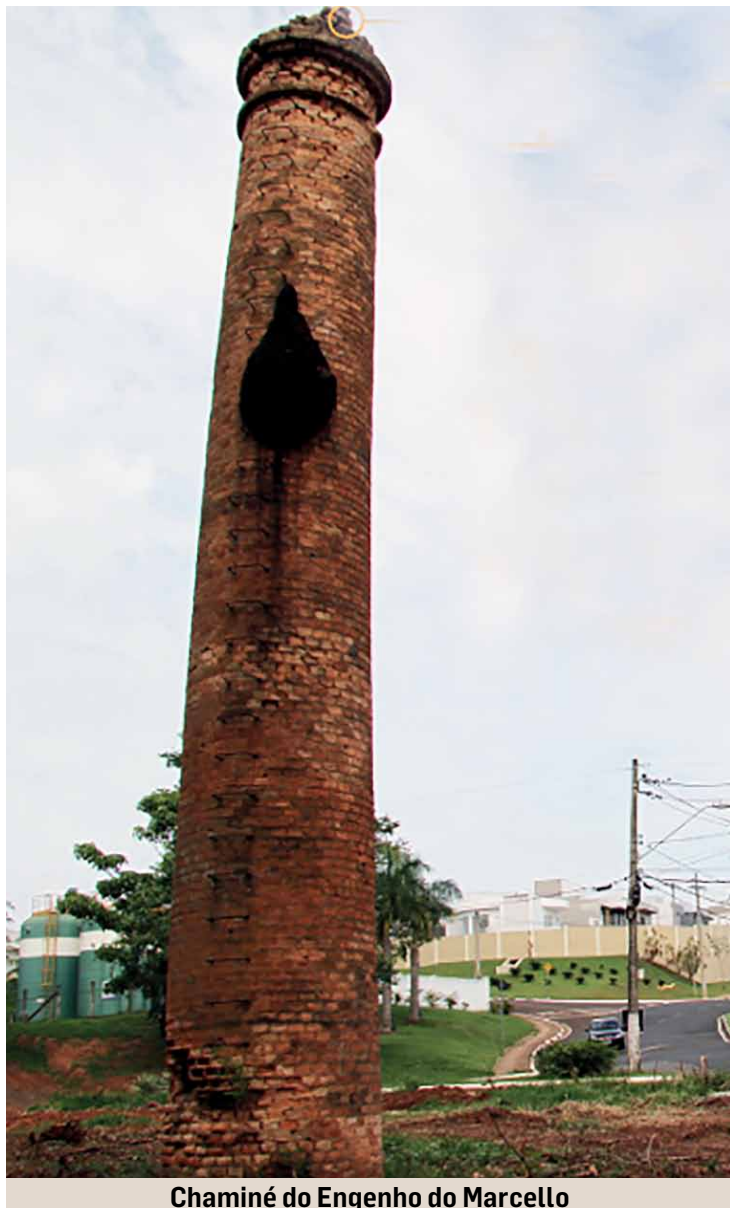
Chaminé do Engenho do Marcello