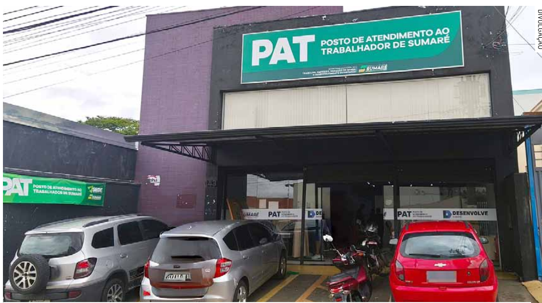
Levantamento aponta fortalecimento de políticas de emprego e apoio a empreendedores

Entre janeiro e abril deste ano, o Sebrae Sumaré