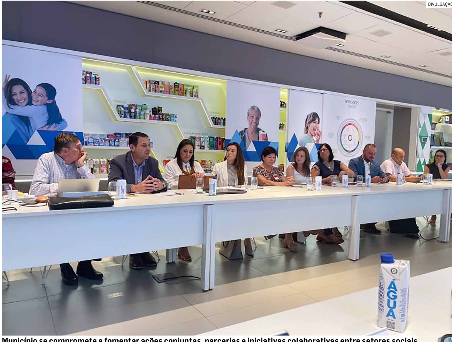
Município se compromete a fomentar ações conjuntas, parcerias e iniciativas colaborativas entre setores sociais

O Executivo ainda definiu uma série de diretrizes para implementação do