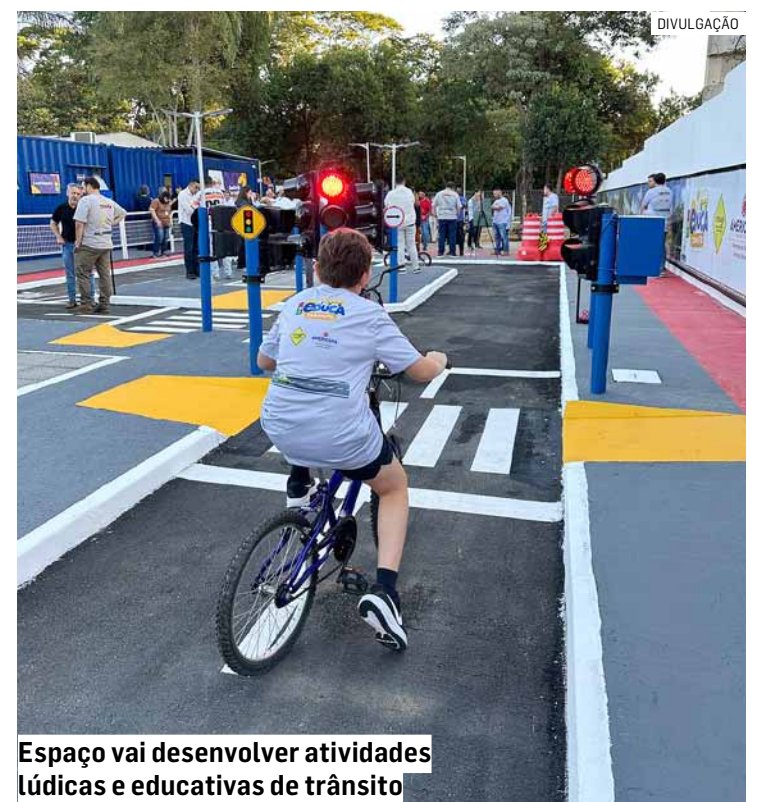
Espaço vai desenvolver atividades lúdicas e educativas de trânsito