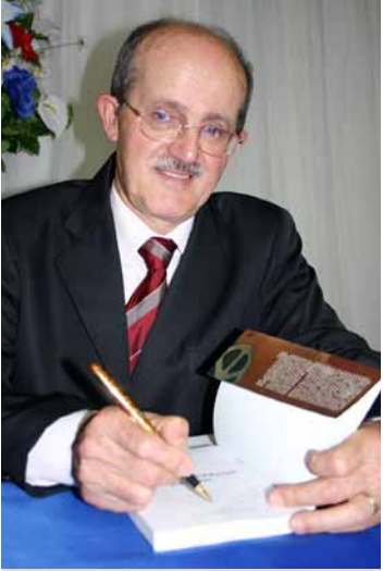
Francisco Antônio de Toledo