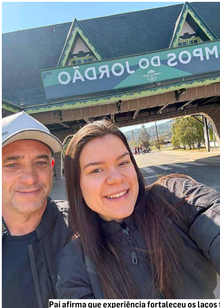
Pai afirma que experiência fortaleceu os laços familiares e criou memórias marcantes na estrada