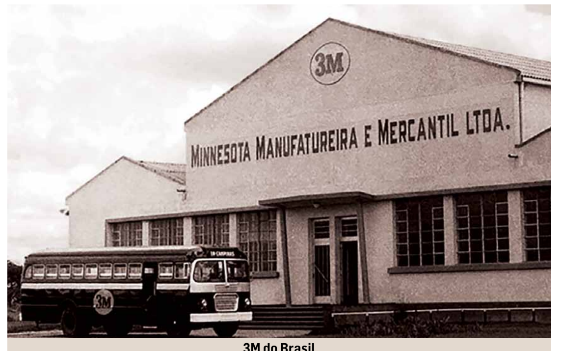
3M do Brasil

Não se pode escrever a História de Sumaré sem falar de sua ferrovia.