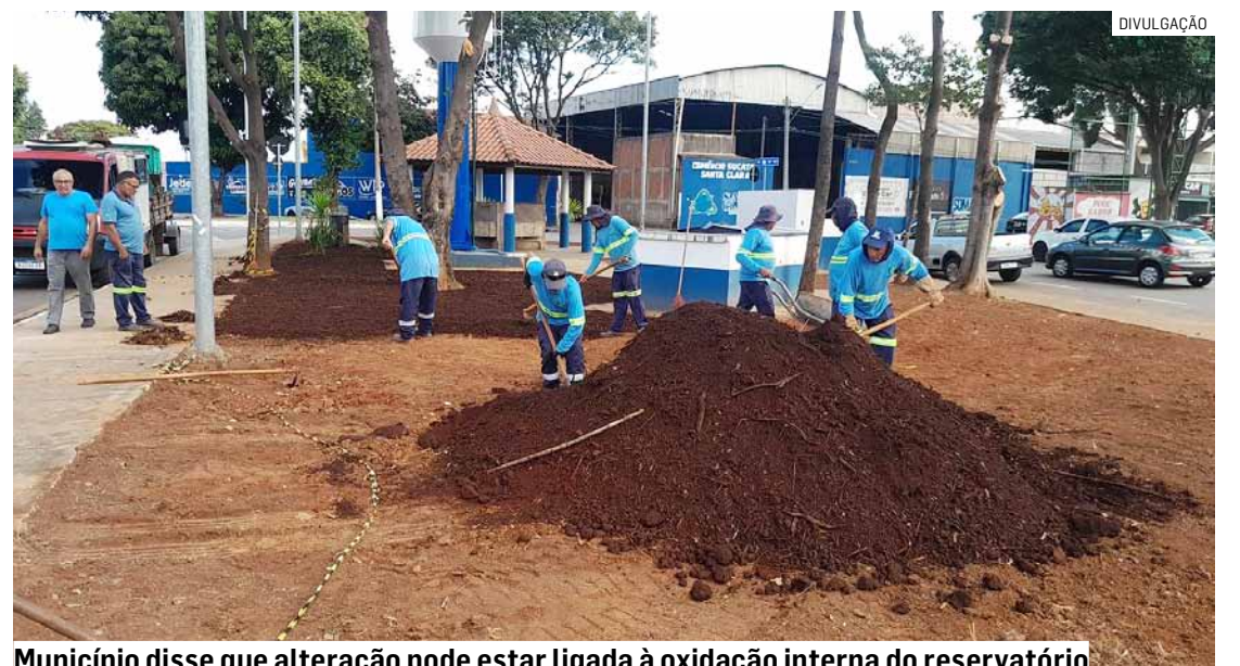
Município disse que alteração pode estar ligada à oxidação interna do reservatório

A prefeitura reforçou o diálogo e a prestação de contas junto à população a respeito da interdição do poço em uma reunião no Paço Municipal com representantes das secretarias de Serviços Urbanos e Meio Ambiente e Desenvolvimento Sustentável com a associação dos moradores e comerciantes do entorno do poço. Na ocasião, foram apresentados os laudos técnicos obtidos após a última análise da água do poço e garantido que o trabalho de recuperação seria iniciado para a resolução do problema e a reabertura do espaço.