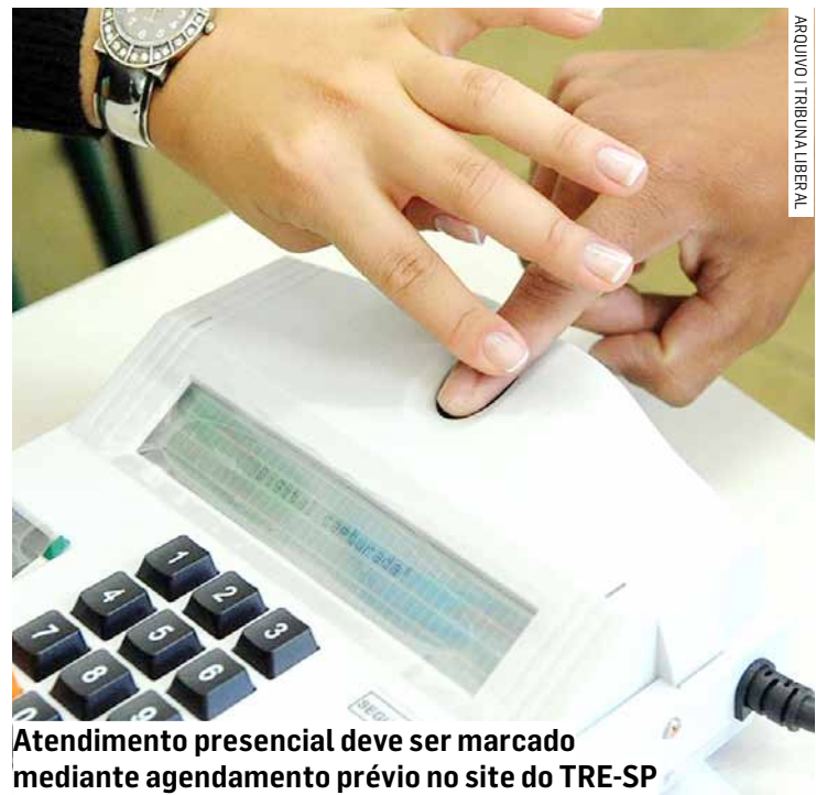
Atendimento presencial deve ser marcado mediante agendamento prévio no site do TRE-SP

Da Redação • REGIÃO tribunaliberal@tribunaliberal.com.br