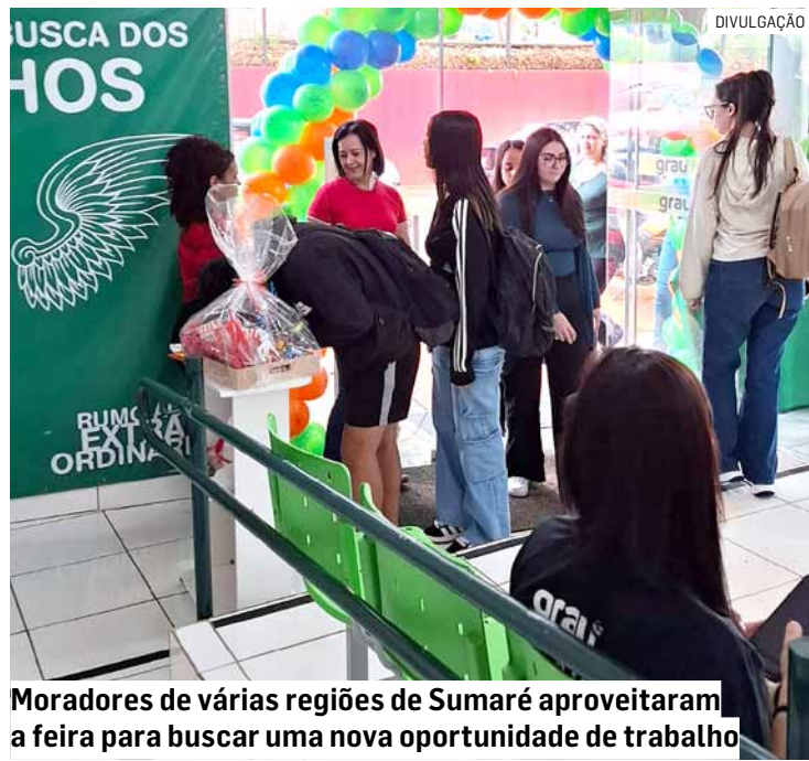
Moradores de várias regiões de Sumaré aproveitaram a feira para buscar uma nova oportunidade de trabalho

Da Redação • SUMARÉ tribunaliberal@tribunaliberal.com.br