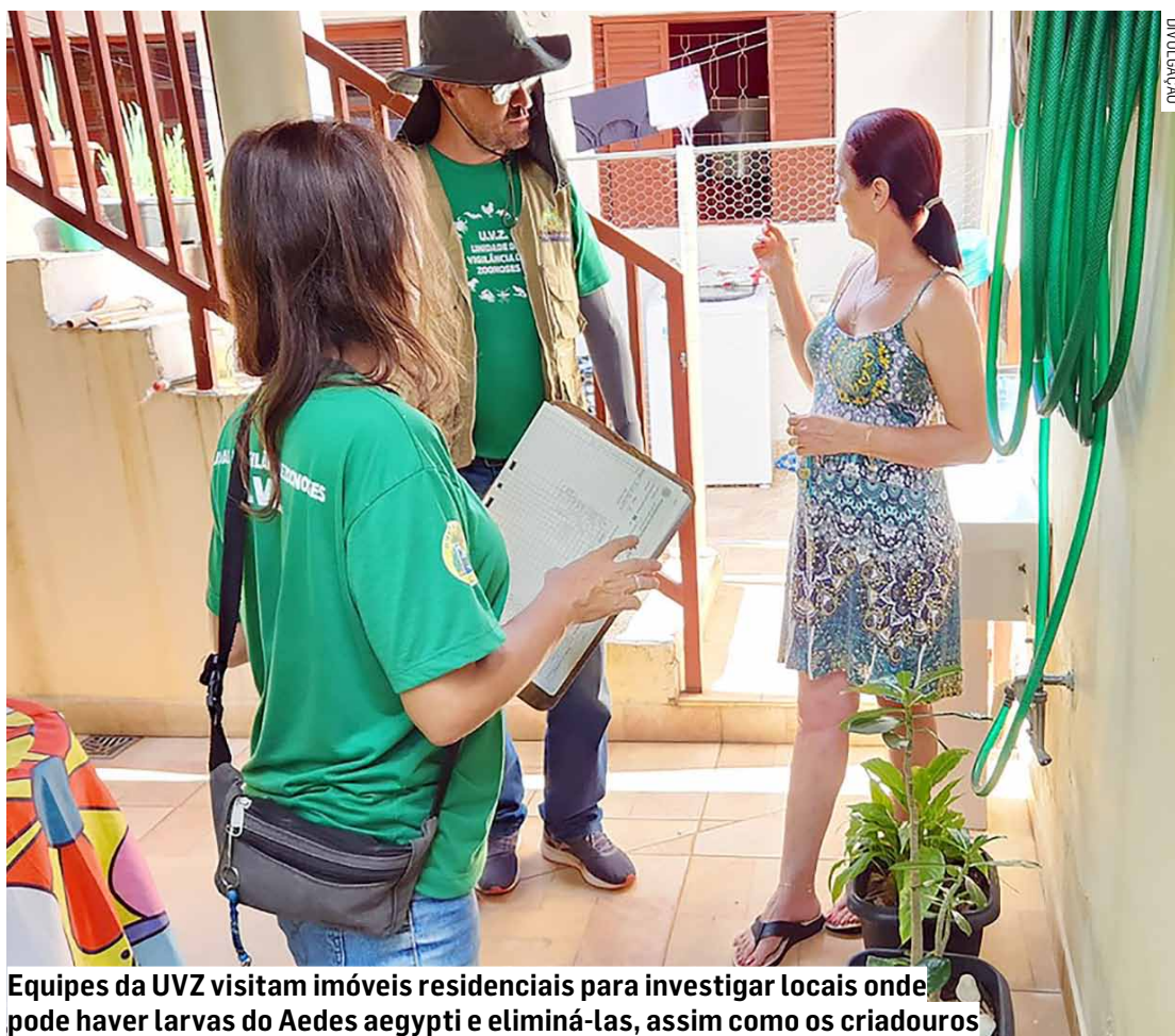
Equipes da UVZ visitam imóveis residenciais para investigar locais onde pode haver larvas do Aedes aegypti e eliminá-las, assim como os criadouros

A ADL é realizada três vezes ao ano: janeiro, julho e outubro. De acordo com a UVZ, a ADL de outubro do ano passado foi 5,3. A análise registrada em janeiro deste ano foi 7,2. Já o índice registrado em julho