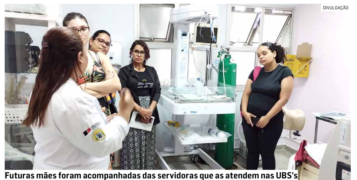
Futuras mães foram acompanhadas das servidoras que as atendem nas UBS's