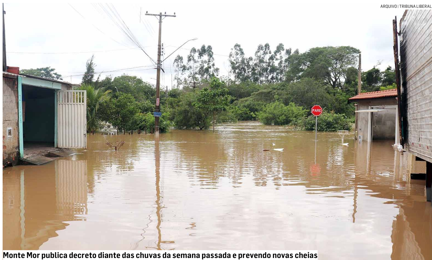
Monte Mor publica decreto diante das chuvas da semana passada e prevendo novas cheias