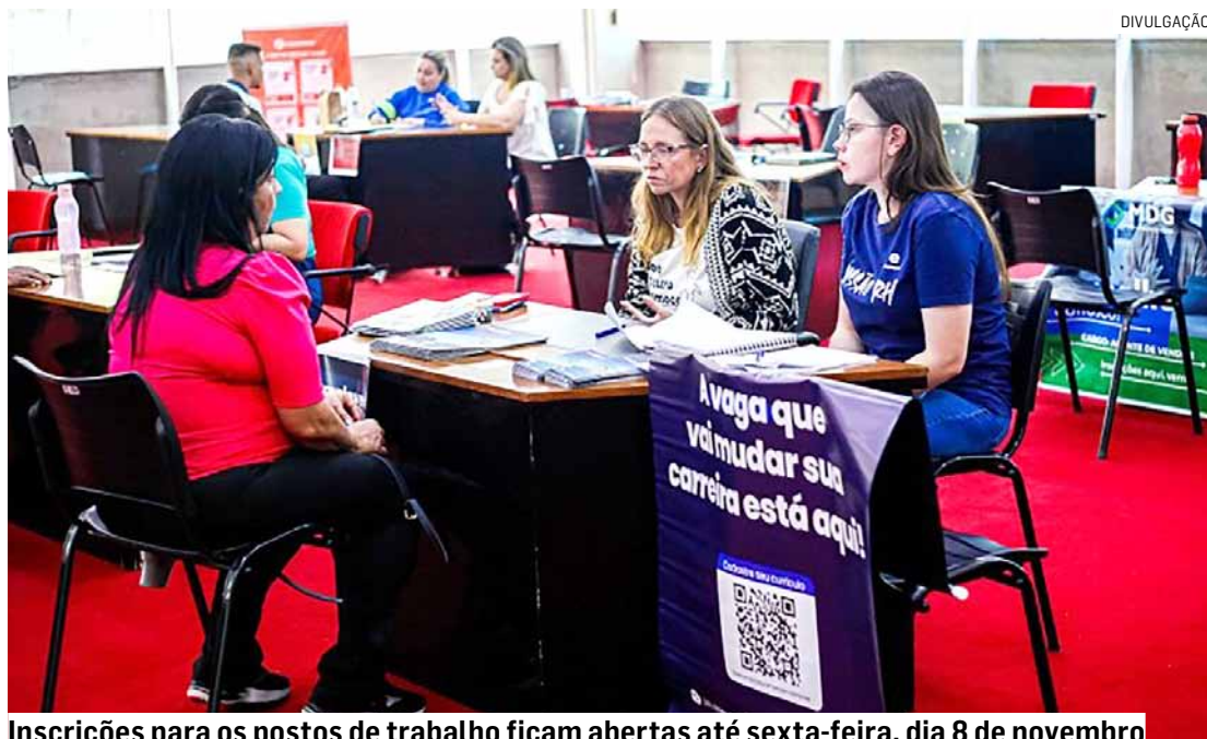
Inscrições para os postos de trabalho ficam abertas até sexta-feira, dia 8 de novembro

O programa facilita a intermediação entre empresas, indústrias, comércios