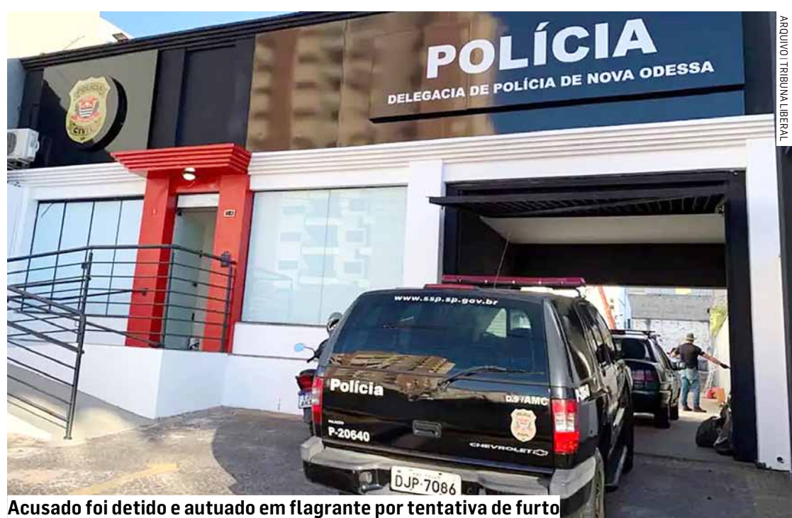
Acusado foi detido e autuado em flagrante por tentativa de furto

O homem foi conduzido ao Plantão Policial e o delegado determinou o registro do boletim de ocorrência de tentativa de furto. O acusado ficou preso.