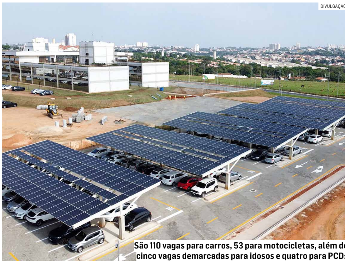
São 110 vagas para carros, 53 para motocicletas, além de cinco vagas demarcadas para idosos e quatro para PCDs

que, porventura, precisar vir até à sede da Prefeitura, e pelos servidores municipais que trabalham no Paço. O espaço recebeu si-