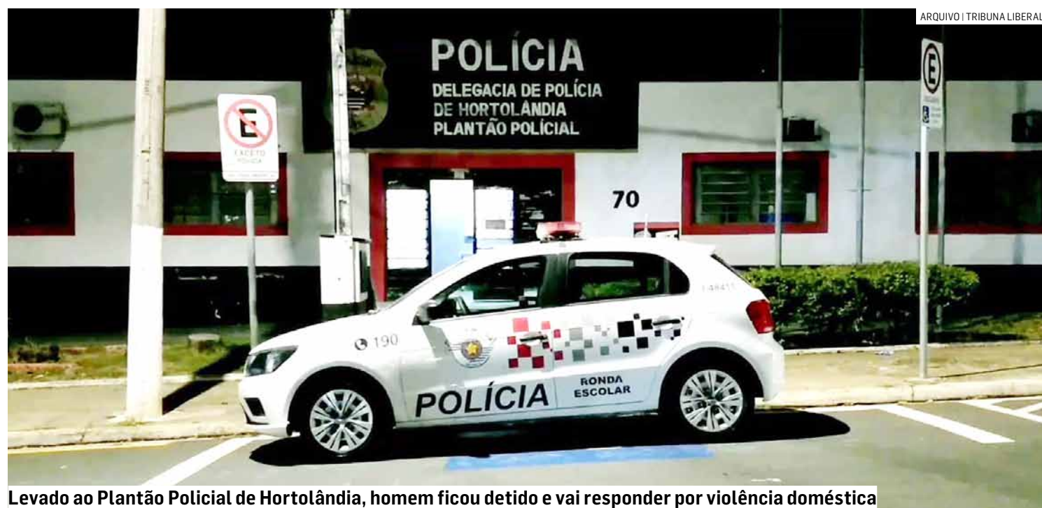
Levado ao Plantão Policial de Hortolândia, homem ficou detido e vai responder por violência doméstica

Cézar Oliveira • HORTOLÂNDIA tribunaliberal@tribunaliberal.com.br