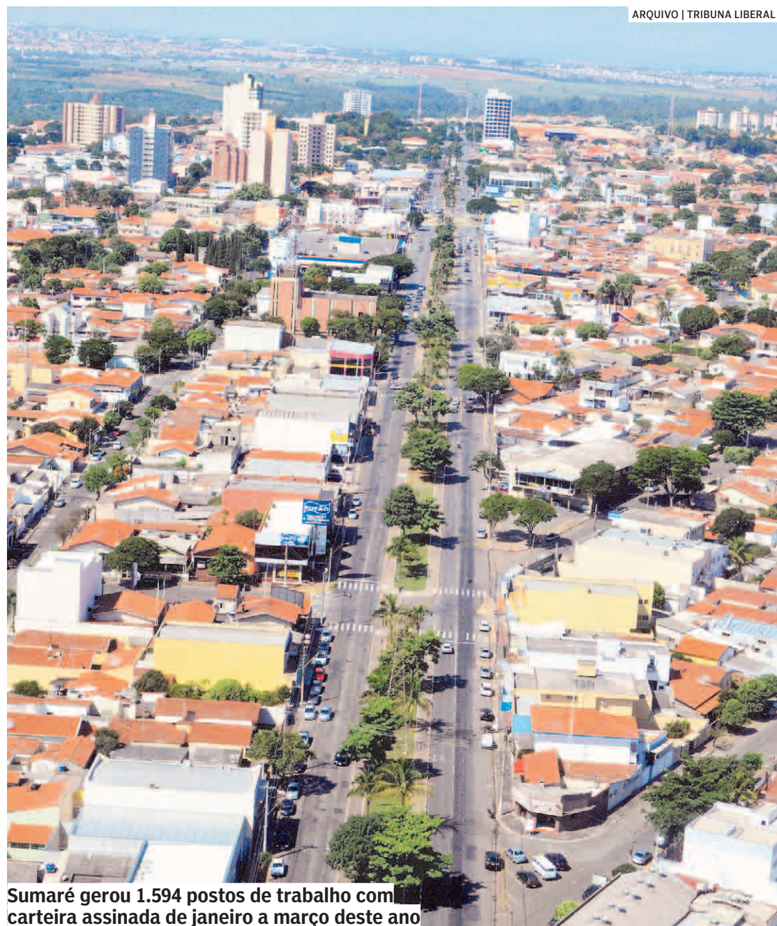
Sumaré gerou 1.594 postos de trabalho com carteira assinada de janeiro a março deste ano

Saldo das cinco cidades da área de cobertura do Tribuna Liberal ficou em 515 vagas, em razão de Paulínia ter registrado saldo negativo de 493 oportunidades no mês passado