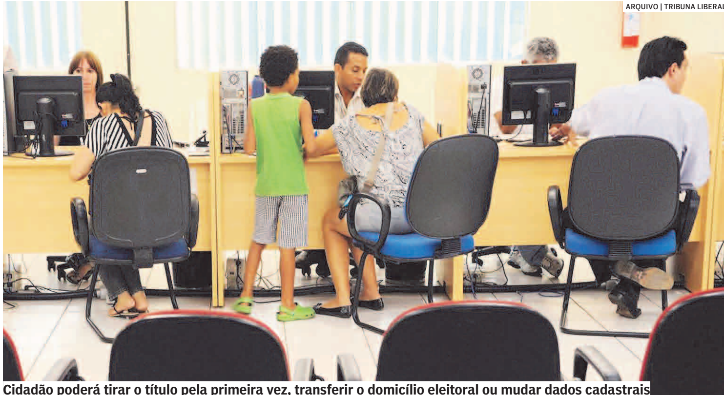
Cidadão poderá tirar o título pela primeira vez, transferir o domicílio eleitoral ou mudar dados cadastrais

colégio eleitoral da região, com 194.301 eleitores, seguido de Hortolândia, com 130.830; Paulínia, com 69.366; Monte Mor, com 40.140; e Nova Odessa, com 38.457. Mas esses números devem sofrer alterações com as inclusões no sistema dos cadastrados em abril e maio.