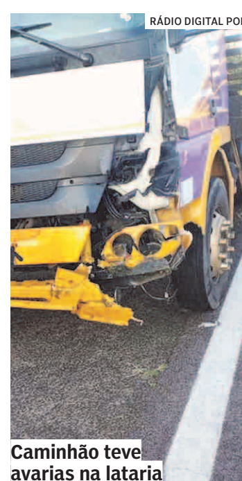
Caminhão teve avarias na lataria