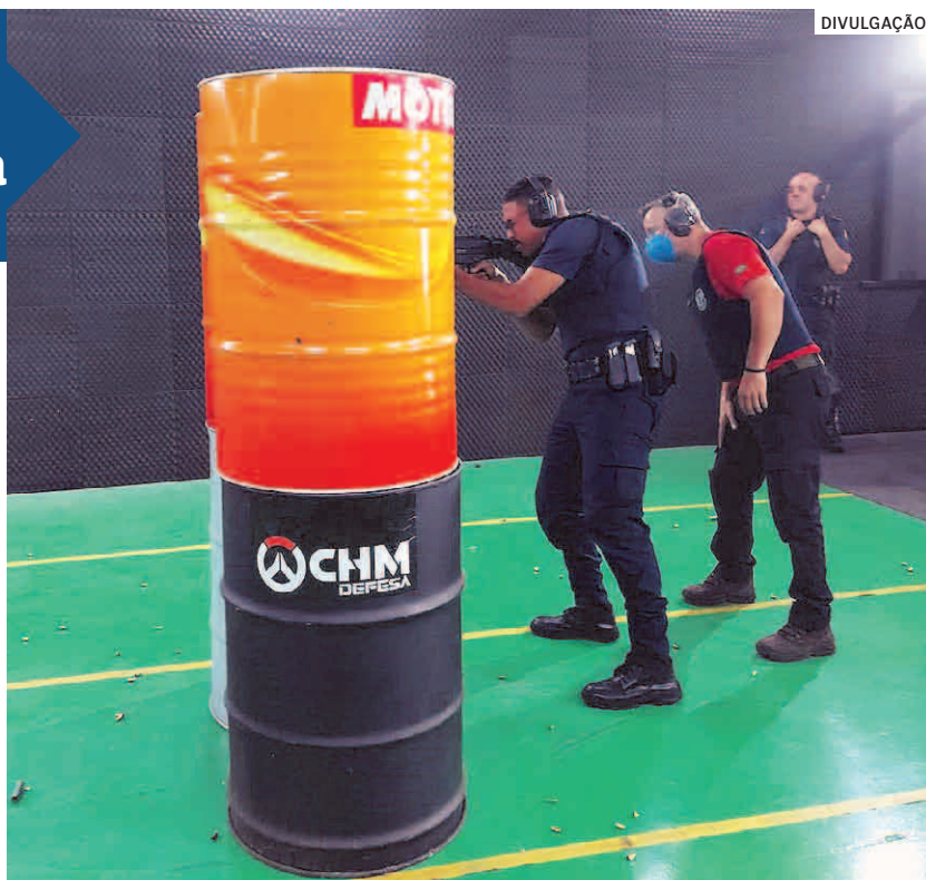
Parte dos 45 integrantes da GCM (Guarda Civil Municipal) de Nova Odessa participaram nesta semana, durante três dias (de 25 a 27/04), do treinamento especial para habilitação na utilização dos novos fuzis carabina CTT .40 adquiridos recentemente pela gestão municipal.

Parte dos 45 integrantes da GCM (Guarda Civil Municipal) de Nova Odessa participaram nesta semana, durante três dias (de 25 a 27/04), do treinamento especial para habilitação na utilização dos novos fuzis carabina CTT .40 adquiridos recentemente pela gestão municipal.