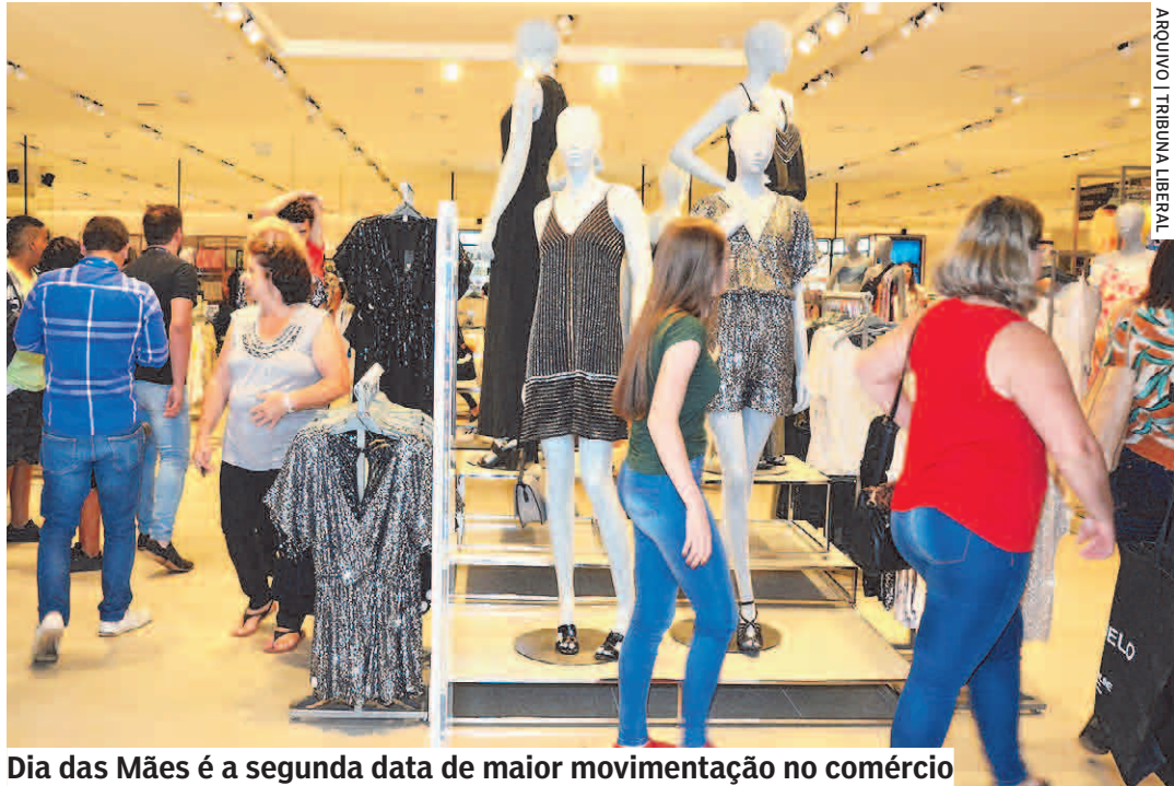
Arquivo | TRIBUNA LIBERAL. Dia das Mães é a segunda data de maior movimentação no comércio

A ACIC (Associação Comercial de Campinas) estima que o comércio da RMC (Região Metropolitana de Campinas) tenha um aumento de 11,5% no faturamento verificado em 2021 (R$ 190 milhões) durante o Dia das Mães, que será comemorado no próximo domingo (8).