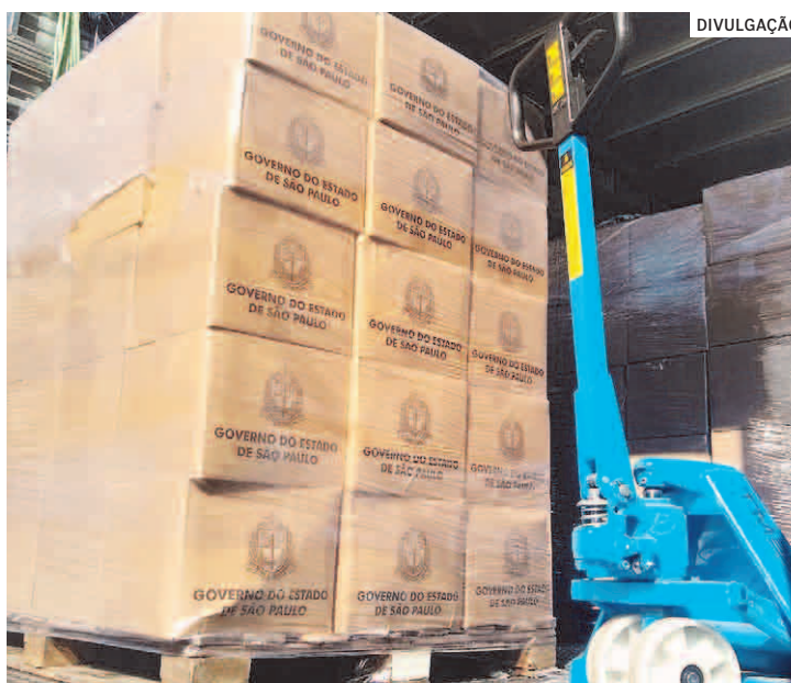
Fundo Social de Solidariedade do município recebeu em 2021 um total de 3,2 mil cestas pelo programa estadual

De acordo com a presidente do Fundo Social hortolandense, Ma-