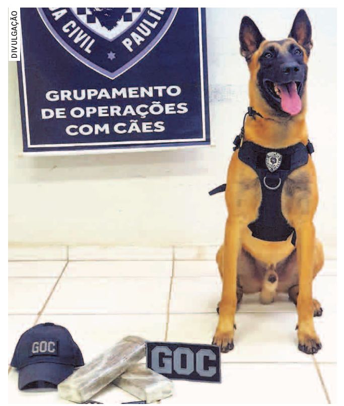
STALLONE LOCALIZA DROGAS - O GOC (Grupamento de Operações com Cães) da Guarda Civil Municipal de Paulínia aprendeu drogas na tarde desta quinta-feira (28), no bairro Jardim Flamboyant, o Nosso Teto. Os patrulheiros fizeram procedimentos de faro com o cão policial Stallone em área de preservação ambiental, quando o animal encontrou dois tijolos de maconha com peso total de um quilo. As substâncias foram apreendidas e apresentadas na Delegacia de Polícia Civil.

A secretaria informou que, em 2021, a unidade recebeu mais de R$ 331 mil de repasse do PDDE Paulista para manutenção. Os valores podem ser verificados em https://pdde.educacao.sp.gov.br/transparencia/ .