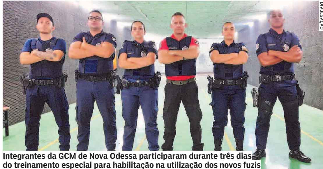
Integrantes da GCM de Nova Odessa participaram durante três dias do treinamento especial para habilitação na utilização dos novos fuzis

“Após cumprida a carga horária de instrução teórica em sala de aula, os guardas municipais ti-