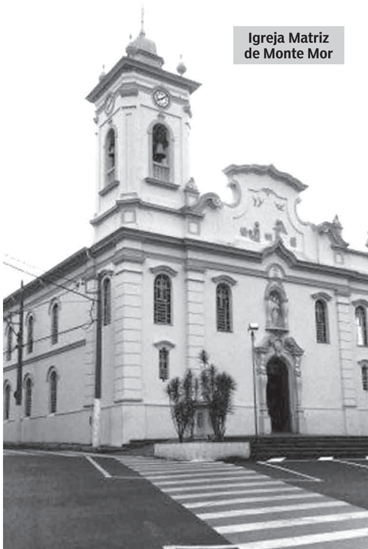
Igreja Matriz de Monte Mor