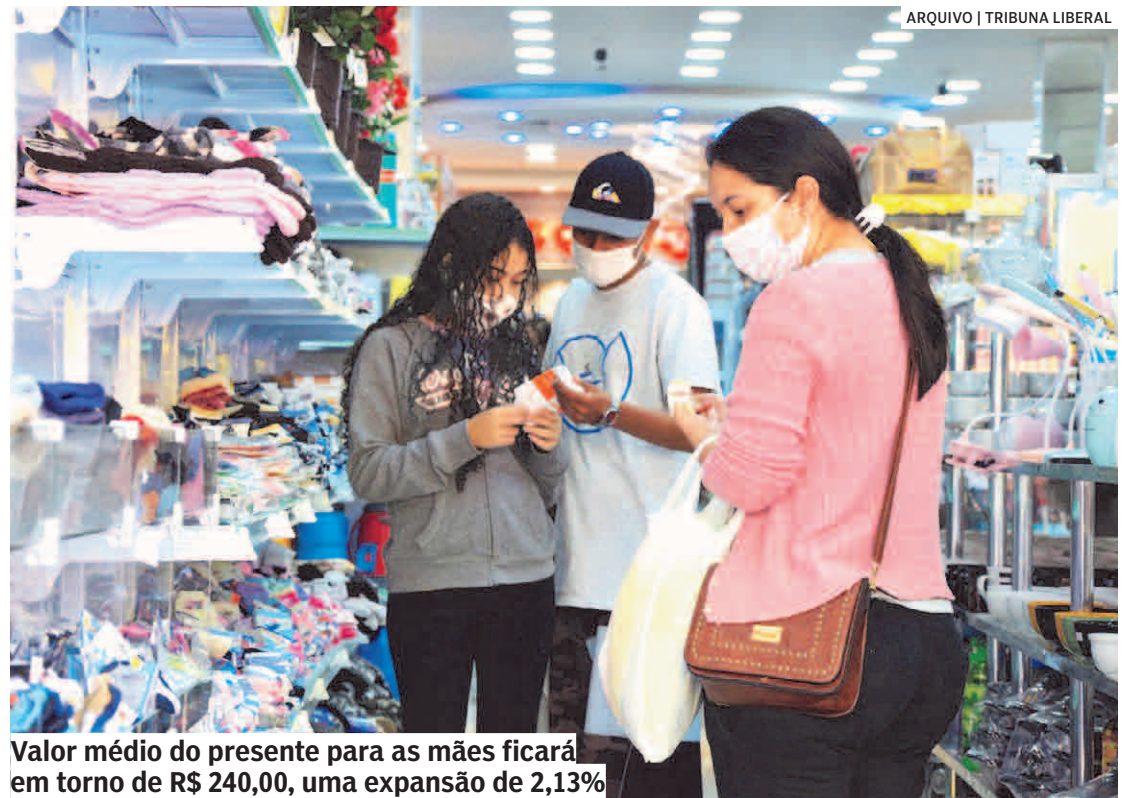
Valor médio do presente para as mães ficará em torno de R$ 240,00, uma expansão de 2,13%

“Estamos na esperança de que a vacinação seja mantida e também que a belicosidade entre a Rússia e a Ucrânia seja contornada. Assim, mais uma vez, o Dia das Mães deverá ser bem prestigiado. Os segmentos mais procurados, no caso das vendas físicas, devem ser perfumarias, vestuários, calçados e flores, e nas vendas on-line, eletroeletrônicos, celulares e notebooks, principalmente”, explica Martins.