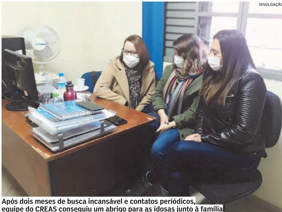
Após dois meses de busca incansável e contatos periódicos, equipe do CREAS conseguiu um abrigo para as idosas junto à família

te dois meses de busca ativa e contatos periódicos com familiares, veio a boa notícia: na última segunda-feira (25/04), as idosas deixaram a ILPI para viver em outra cidade, junto a irmãs.