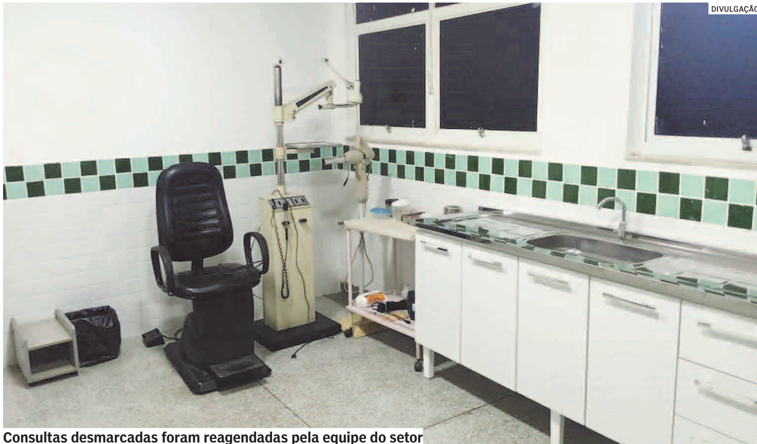
Consultas desmarcadas foram reagendadas pela equipe do setor