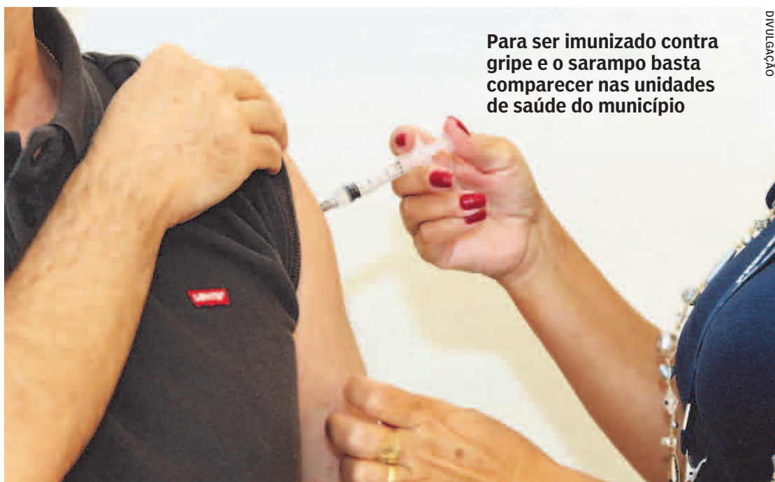
Para ser imunizado contra gripe e o sarampo basta comparecer nas unidades de saúde do município

GRIPE No caso da vacinação contra a influenza, os