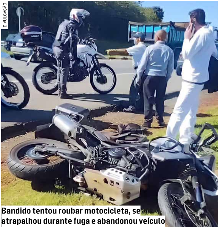
Bandido tentou roubar motocicleta, se atrapalhou durante fuga e abandonou veículo