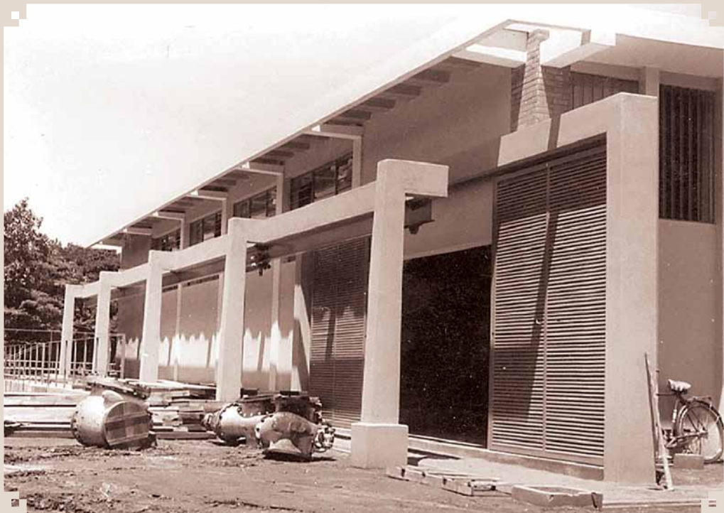
Foto da década de 1970, mostrando a construção do conjunto que serviria de vestiários e sauna, no conjunto poliesportivo do Clube Recreativo Sumaré, na Avenida Rebouças. Os vestiários foram utilizados com a inauguração das piscinas, no mandato de Alaerte Menuzzo. Já o Conjunto Fisioterápico foi inaugurado no mandato seguinte, de Leonardo Coltro.