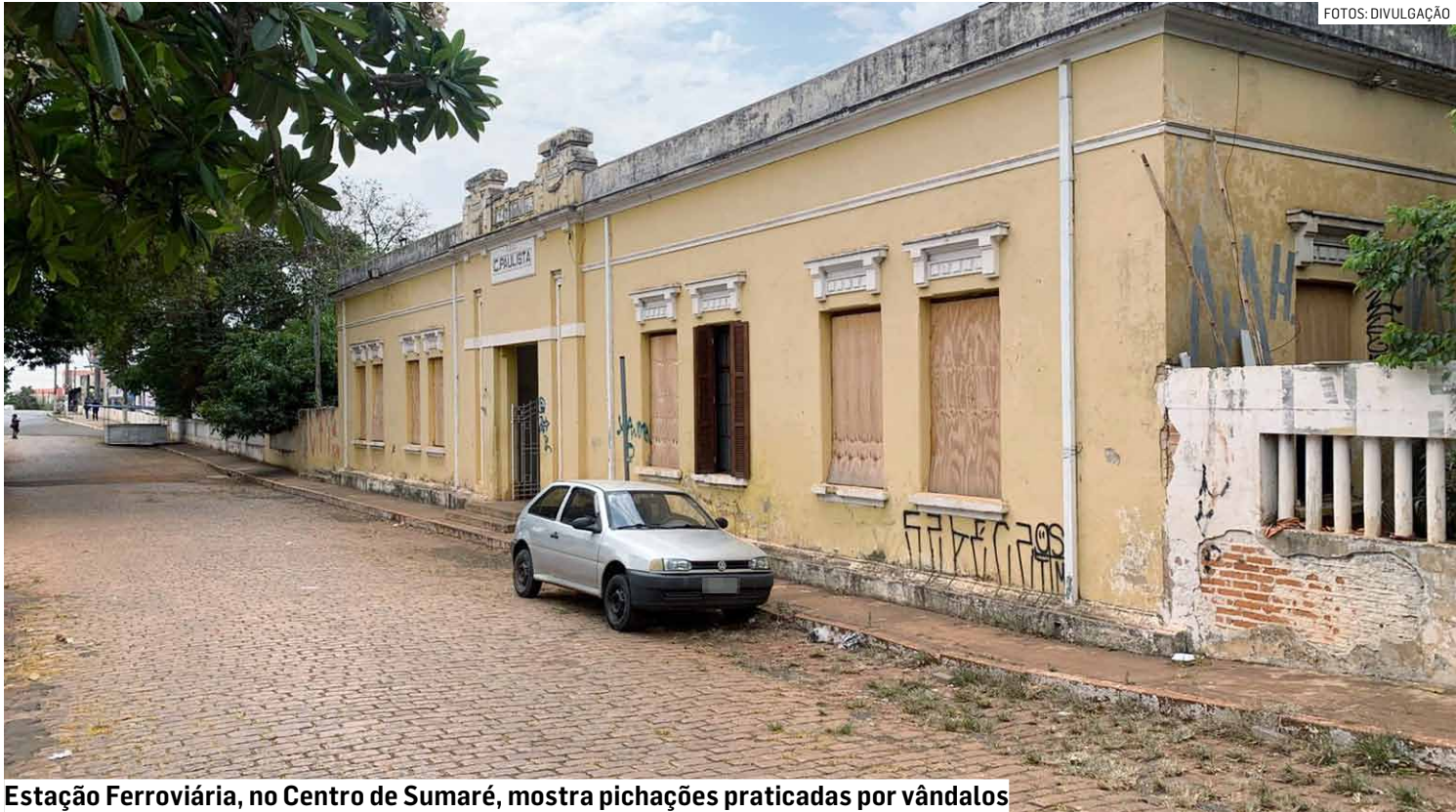
Estação Ferroviária, no Centro de Sumaré, mostra pichações praticadas por vândalos

O projeto que passa a tramitar no Legislativo define pichação como qualquer inscrição, rabisco ou sinal gráfico feito sem autorização do proprietário, incluindo muros, fachadas, repartições públicas e equipamentos urbanos. A punição será aplicada após processo administrativo, ga-