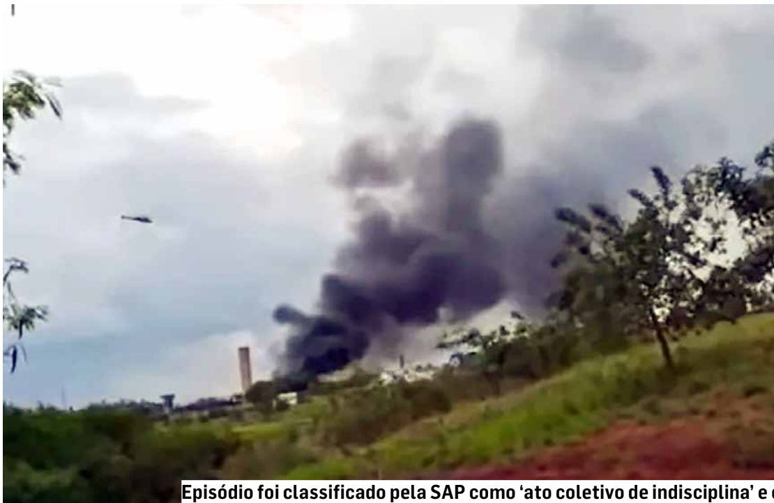
Episódio foi classificado pela SAP como 'ato coletivo de indisciplina' e começou após apreensão de bebida alcoólica; fumaça foi vista à distância

Detentos que atuaram no motim registrado na última segunda-feira (24), na Penitenciária III, serão encaminhados para outros presídios; Estado admite que houve feridos durante tumulto com queima de colchões após apreensão de bebidas