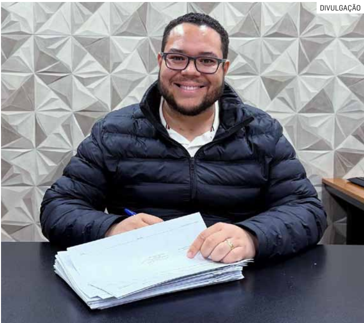
Após impugnações, cronograma da decoração natalina em Paulínia começou um pouco mais tarde

A administração pública no Diário Oficial o contrato 364/2025, firmado com empresa que será responsável pela montagem completa da decoração natalina. O investimento total é de R$ 8,1 milhões, com vigência de 12 meses. O pacote inclui montagem de toda a estrutura, interligações e derivações elétricas, manutenção diária, reparos, conservação dos itens, segurança, assistência técnica durante toda a programação e a desmontagem ao término das festividades. O transporte de to-