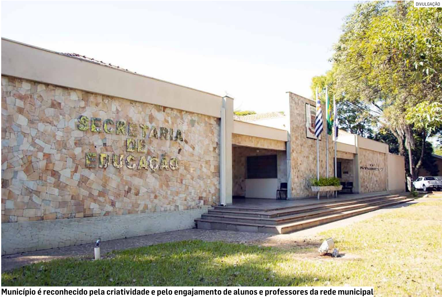
Município é reconhecido pela criatividade e pelo engajamento de alunos e professores da rede municipal

O concurso, que neste ano teve como tema “Água: Guardião da Biodiversidade”, recebeu mais de 200 inscrições de 70 escolas da região. A EMEB Paulo Azenha concorre com um vídeo criado a partir de uma