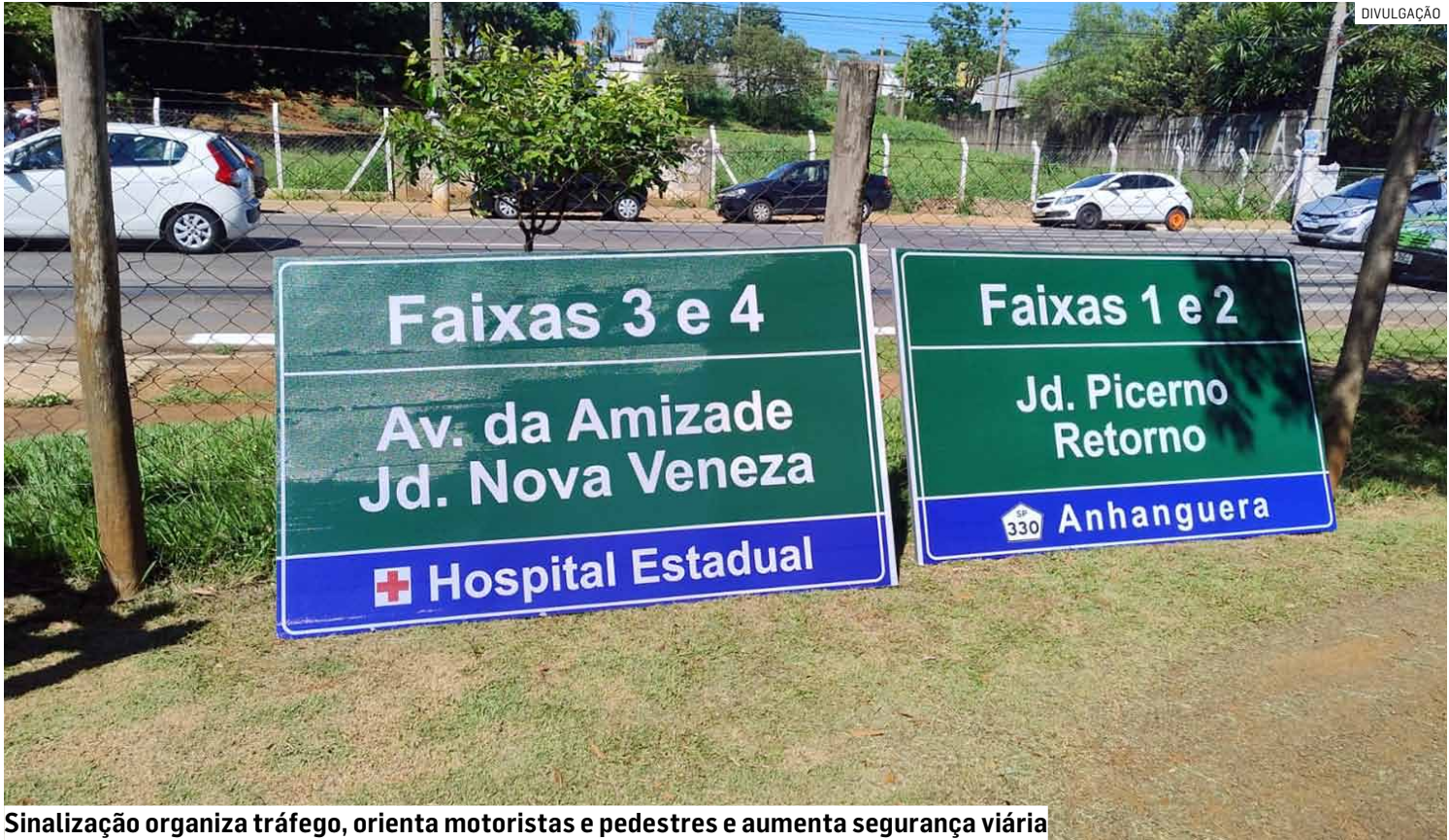
Sinalização organiza tráfego, orienta motoristas e pedestres e aumenta segurança viária