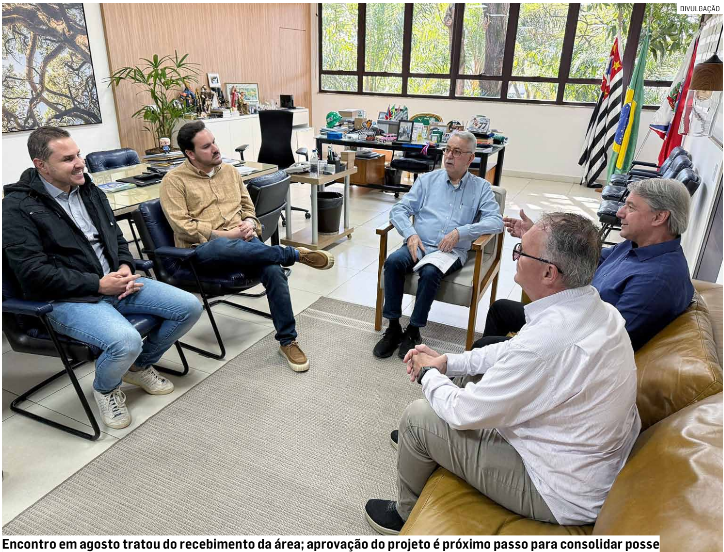
Encontro em agosto tratou do recebimento da área; aprovação do projeto é próximo passo para consolidar posse

O terreno em questão, localizado na Rua Sergipe, esquina com a Rua Piauí, é composto por quatro glebas com metragem total superior a 31 mil m², dentro de um complexo maior que chega a 55,2 mil m². Embora pertença formalmente ao Governo do Estado, a área é administrada pela Prefeitura de Americana há décadas, desde sua inauguração nos anos 1970, recebendo investimentos municipais, manutenção contínua e abrigando atividades esportivas, culturais e sociais frequentadas por milhares de moradores.