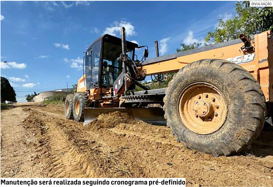
Manutenção será realizada seguindo cronograma pré-definido

Após a finalização destes bairros, os trabalhos voltarão para o São Sebastião, onde a prefeitura busca adquirir mais terra e pedras para nivelamento das ruas.