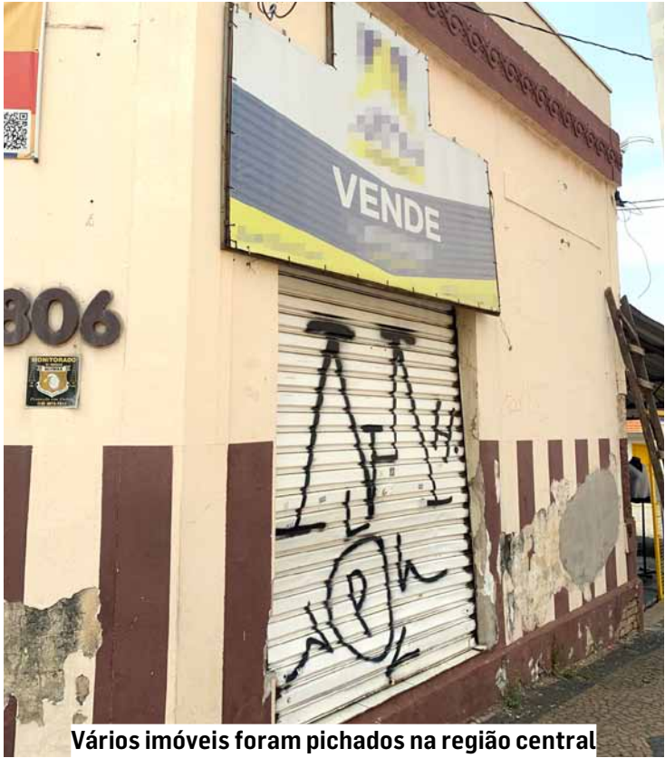
Vários imóveis foram pichados na região central

Projeto do vereador Rai do Paraíso prevê multa administrativa de R$ 2 mil para quem pichar bens públicos ou privados da cidade e obriga infrator a pagar pela limpeza; proposta cria recompensa inédita