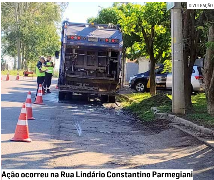
Ação ocorreu na Rua Lindário Constantino Parmegiani

rança viária e o cumprimento das normas ambientais, multou nove veículos. Durante a blitz, foram fiscalizados 30 veículos e 10 carretas. Deste total, nove veículos e carretas foram autuados com base no Código de Trânsito Brasileiro e dois veículos receberam autuações pela Sustentabilidade, conforme a Lei Ambiental nº 5.793/25, artigo 29-12. Foram aplicadas oito multas graves e uma gravíssima.