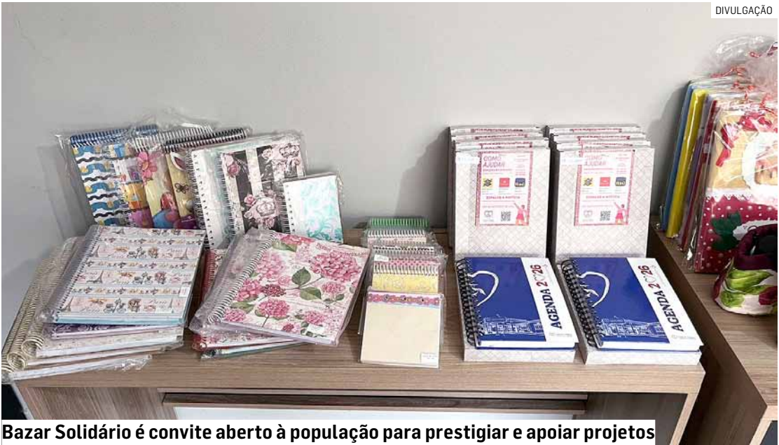
Bazar Solidário é convite aberto à população para prestigiar e apoiar projetos

“A expressiva participação do público na inauguração demonstrou a relevância da ação e evidenciou a importância de espaços que promovam inclusão, apoio mútuo e oportunidades. Ao lon-