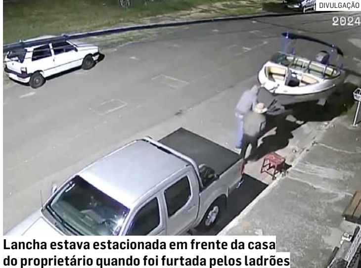
Lancha estava estacionada em frente da casa do proprietário quando foi furtada pelos ladrões

Nas imagens é possível ver a lancha estacionada atrás de uma caminhonete. Em seguida, dois homens, um usando moleton com capuz e outro com chapéu, se aproximam da embarcação. Eles conseguem desengatar a lancha do veículo e começam a empurrá-la pela rua. A imagem mostra a dupla empurrando a lancha até o final da rua, onde ela é então engatada em outro veículo estacionado. Após o