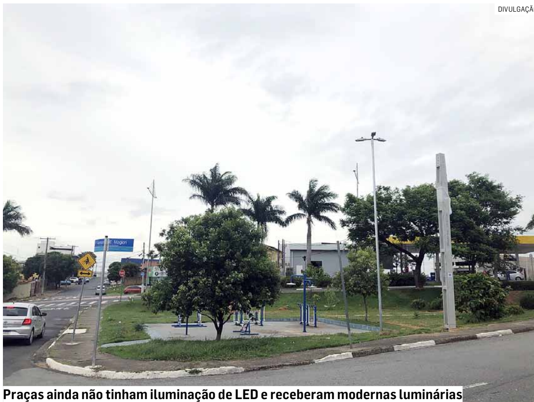
Praças ainda não tinham iluminação de LED e receberam modernas luminárias

Ainda de acordo com o Departamento de Iluminação Pública, a implantação