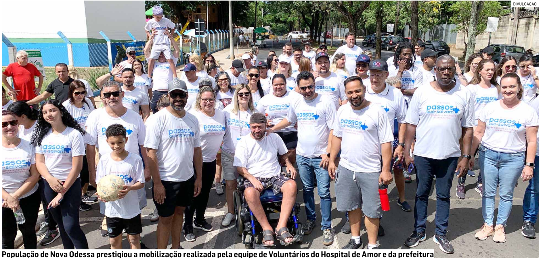
População de Nova Odessa prestigiou a mobilização realizada pela equipe de Voluntários do Hospital de Amor e da prefeitura

Além de apoiar o funcionamento do Hospital de Amor de Barretos, o objetivo da campanha é conscientizar a população so-