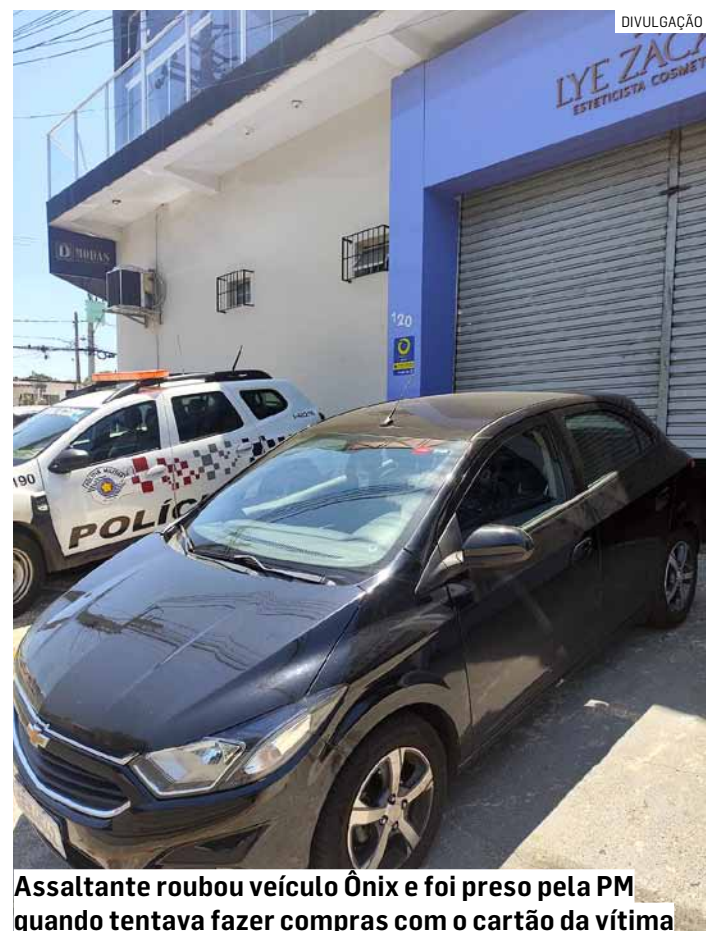
Assaltante roubou veículo Onix e foi preso pela PM quando tentava fazer compras com o cartão da vítima

Em consulta foi descoberto que homem possui diversas passagens criminais pelos estados de São Paulo e da Bahia. Foi registrado boletim de ocorrência de flagrante e o acusado ficou detido.