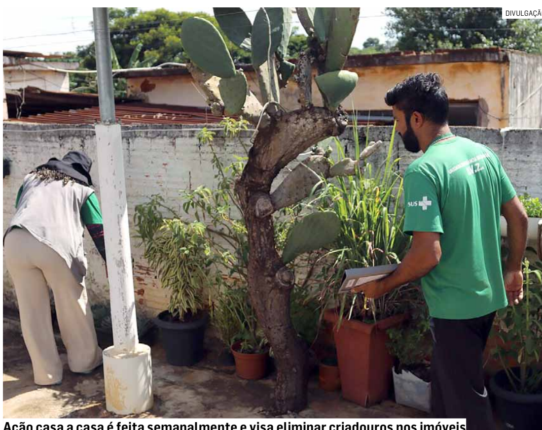
Ação casa a casa é feita semanalmente e visa eliminar criadouros nos imóveis