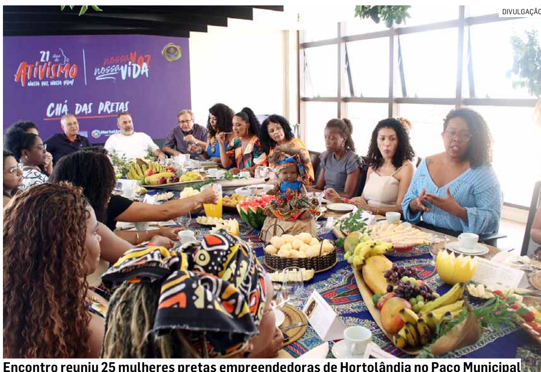
Encontro reuniu 25 mulheres pretas empreendedoras de Hortolândia no Paço Municipal

Administradoras de empresas, advogadas, contadoras, psicólogas e empresárias do ramo da alimentação, beleza, saúde e bem-estar. O encontro com empreendedoras de Hortolândia reuniu mulheres negras de diferentes perfis, formações profissionais e idades. Além de promover o diálogo e a troca de experiências entre as participantes, o evento estimulou a reflexão sobre temas como igualdade de gêne-