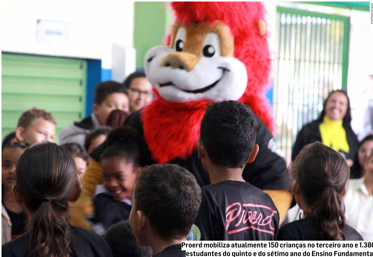
Proerd mobiliza atualmente 150 crianças no terceiro ano e 1.380 estudantes do quinto e do sétimo ano do Ensino Fundamental

Os eventos, que se estenderão até quinta-feira (28), serão abertos a toda comunidade escolar e acontecerão sempre às 19h no auditório Arlete Afonso, localizado na rua Pastor Hugo Gegembauer, 265, no Parque Ortolândia. Durante as cerimônias de formatura, os estudantes receberão certificados de conclusão, camisetas com o símbolo do Proerd e participação de sorteios de brindes. Os eventos celebrarão o encerramento do semestre de atividades em que os estudantes aprendem noções de cidadania e prevenção à violência, alinhadas à Teoria Socioemocio-