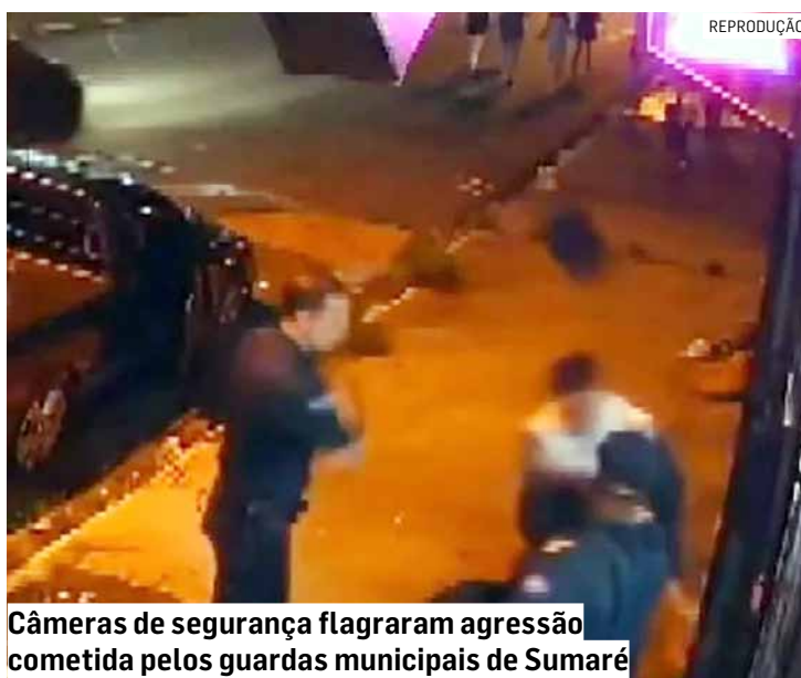
Câmeras de segurança flagraram agressão cometida pelos guardas municipais de Sumaré

Quando o homem é liberado para entrar no carro, ele é atingido por mais um golpe de cacetete. O mesmo guarda ainda é flagrado atingindo um motociclista que passa pela rua. A Prefeitura de Sumaré informou que abriu uma sindicância e que a Guarda Municipal está investigando o caso.