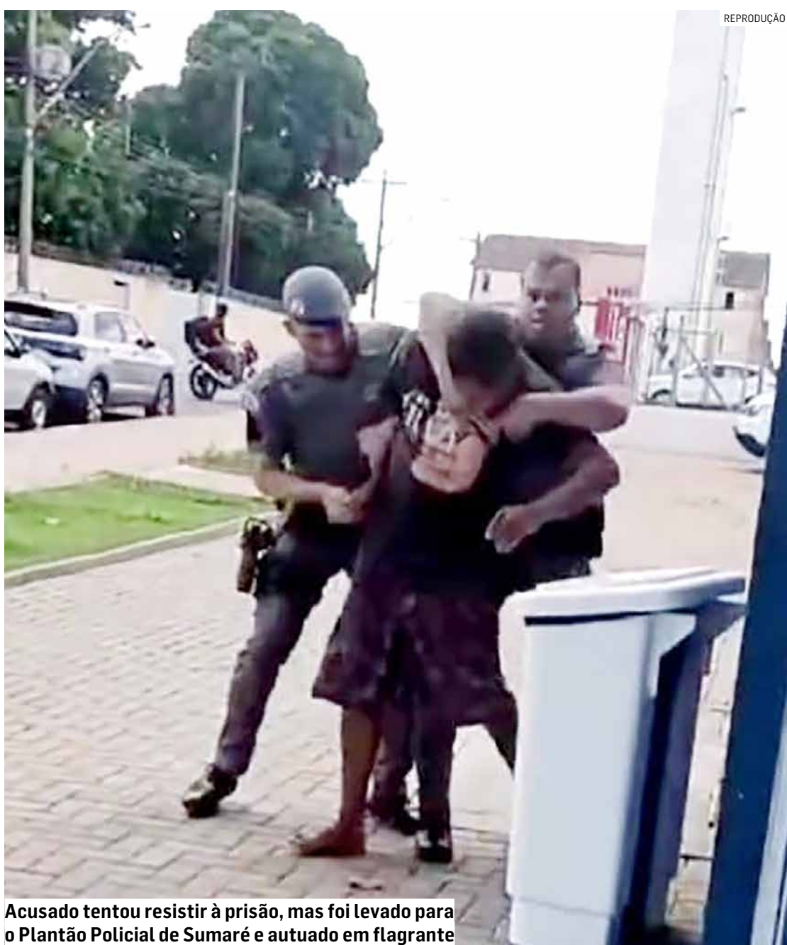
Acusado tentou resistir à prisão, mas foi levado para o Plantão Policial de Sumaré e autuado em flagrante

A Guarda Municipal de Hortolândia apreendeu um adolescente de 16 anos com uma motocicleta furtada no domingo (24) em Hortolândia. O jovem foi conduzido ao Plantão Policial de Hortolândia, onde o delegado tomou conhecimento dos fatos e, após ouvir o infrator, ele foi liberado para a mãe. A moto foi recolhida ao pátio.