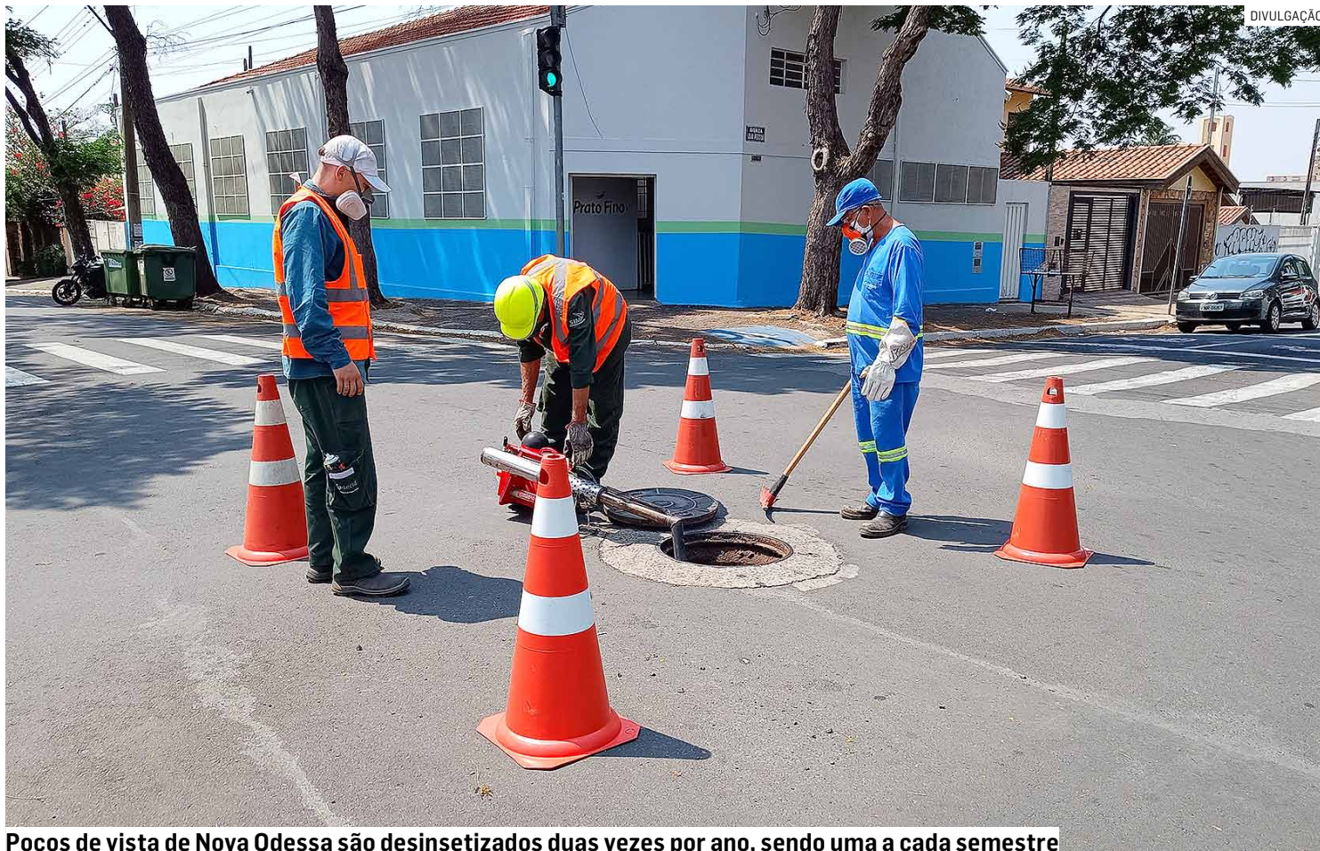
Poços de visita de Nova Odessa são desinsetizados duas vezes por ano, sendo uma a cada semestre

Os poços de visita são desinsetizados duas vezes por ano, sendo uma a cada semestre. Em 2024, os serviços vêm sendo executados pela empresa Ettore Nalini Dedetizadora, contratada pela Coden, e fiscalizados pelo Setor de Zoonoses. Para a desratização, a cidade foi dividida em cinco regiões, que serão contempladas de acordo com o cronograma abaixo, a partir desta terça-feira: Jardim Capuava, Jardim Alvorada, Jardim Santa Rita 1, Condomínios Firenze e Nápoles,