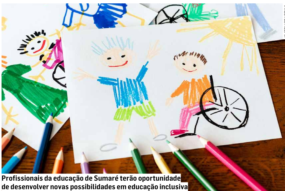
Profissionais da educação de Sumaré terão oportunidade de desenvolver novas possibilidades em educação inclusiva

O evento contará com as palestras ‘Não confundir planejamento pedagógico com discurso demagógico’, ministrada por Alexandre Augusto Pau-