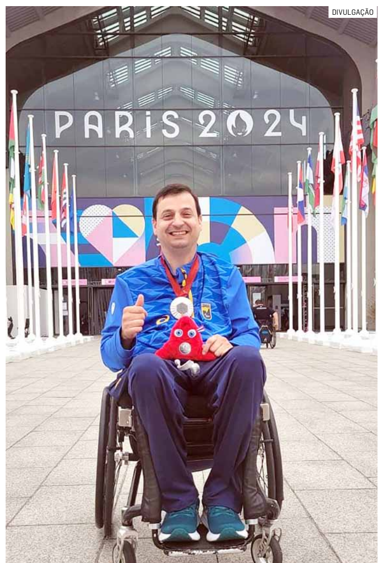
Público poderá conhecer mais sobre a trajetória do atleta e bastidores da conquista em Paris, além de pedir autógrafos