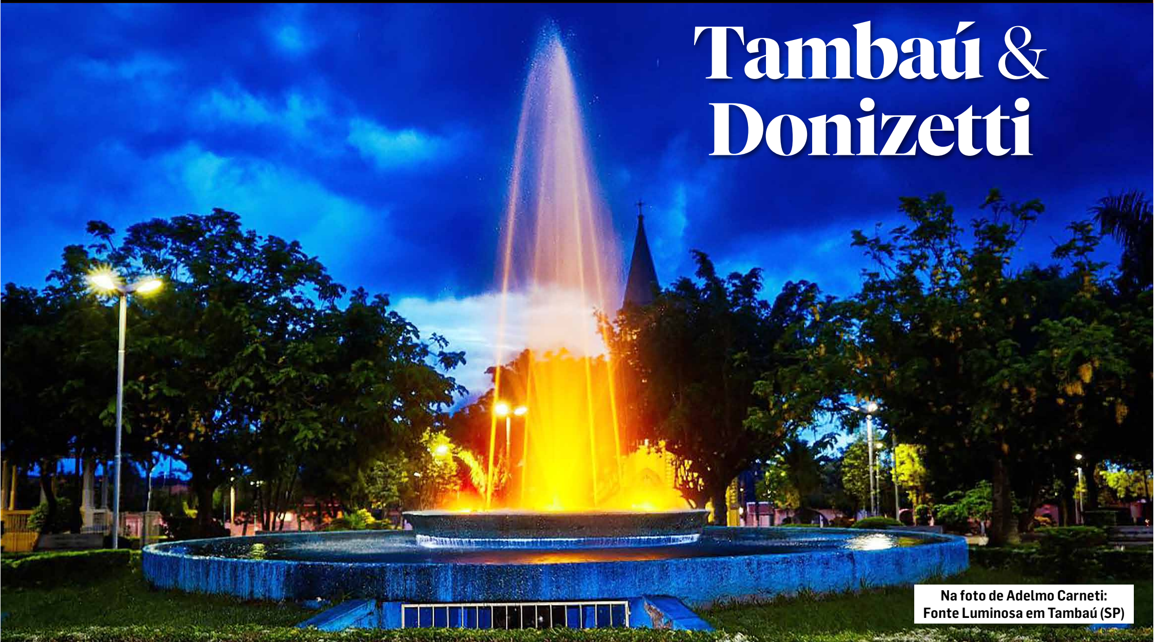
Fonte Luminosa em Tambaú (SP)

Os dois nomes não se confundem, mas quando um é citado logo o outro é lembrado. Mormente para aqueles com mais idade, da época em que o Padre Donizetti era vivo. Naqueles idos, era tamanha a quantidade de ônibus para Tambaú que chegava a causar congestionamento nas rodovias. Todos eles transportavamromeiros em busca da bênção do Padre Donizetti, pois muitos milagres na ocasião foram noticiados. Assim, o cacote de receber visitantes com amizade e gentilezas deram fama à cidade de boa receptiva, a qual dura até hoje e que, também, é um dos fatores que ajudou transformá-la com o título de “Município de Interesse Turístico”.