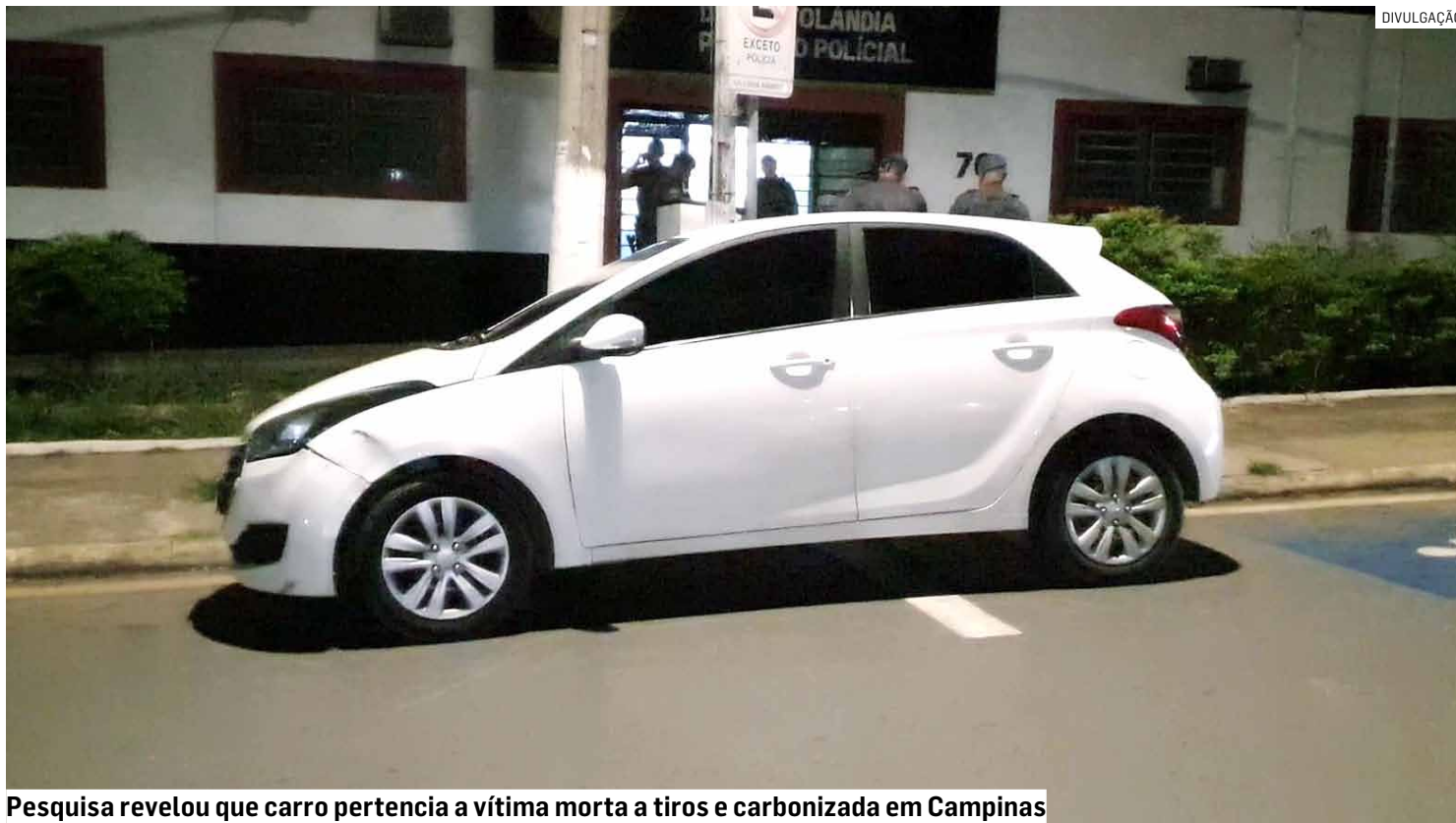
Pesquisa revelou que carro pertencia a vítima morta a tiros e carbonizada em Campinas

A equipe policial realizava patrulhamento pelo bairro quando avistou o veículo. Foi tentado, com os devidos sinais sonoros e luminosos, convencer o motorista parar, porém, ele desobedeceu a ordem legal de parada, houve acompanhamento por vá-