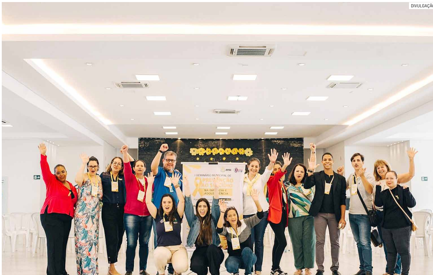
Temas abordados e qualidade das palestras trouxeram reflexões profundas e novas ferramentas de atuação aos profissionais