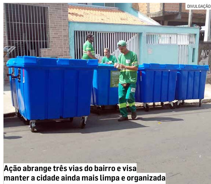
Ação abrange três vias do bairro e visa manter a cidade ainda mais limpa e organizada

Segundo balanço da Secretaria, Hortolândia já conta com mil contêineres distribuídos nas principais avenidas da cidade. Bairros como Jardim Amanda, Terras do Santo Antônio, Jardim Mirante, Jardim Interlagos e Jardim Campos Verdes já foram contemplados com a medida, consolidando o compromisso do município com uma gestão ambientalmente responsável e urbana eficiente.