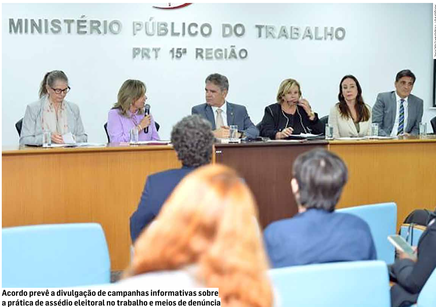
Acordo prevê a divulgação de campanhas informativas sobre a prática de assédio eleitoral no trabalho e meios de denúncia

As denúncias podem ser remetidas para os endereços www.prt15.mpt.mp.br