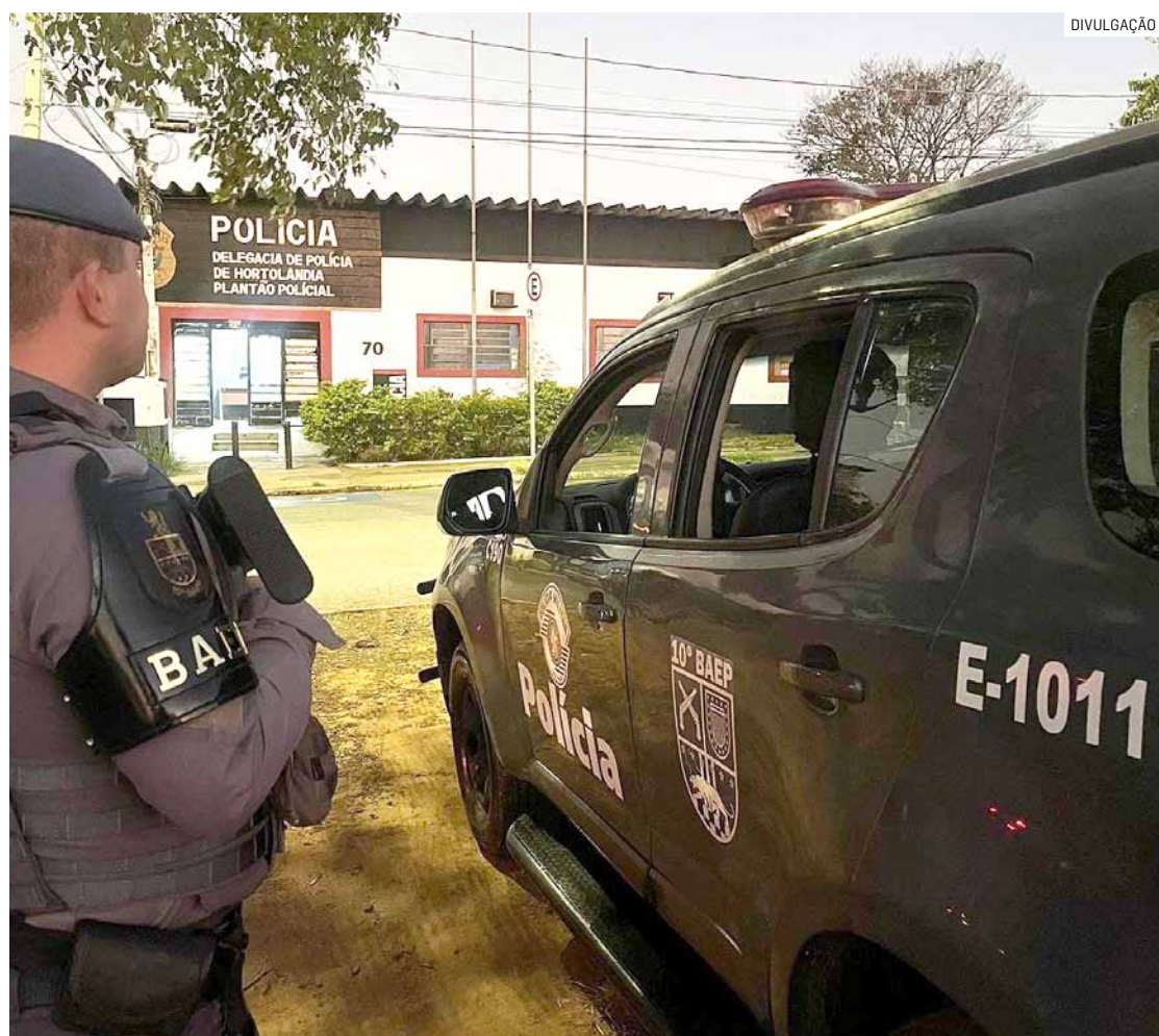
Procurado detido em Hortolândia foi levado ao Plantão Policial e ficou à disposição da Justiça