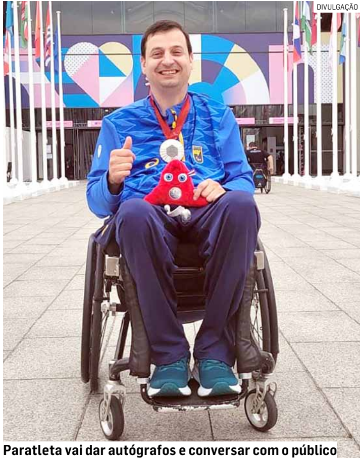
Paratleta vai dar autógrafos e conversar com o público