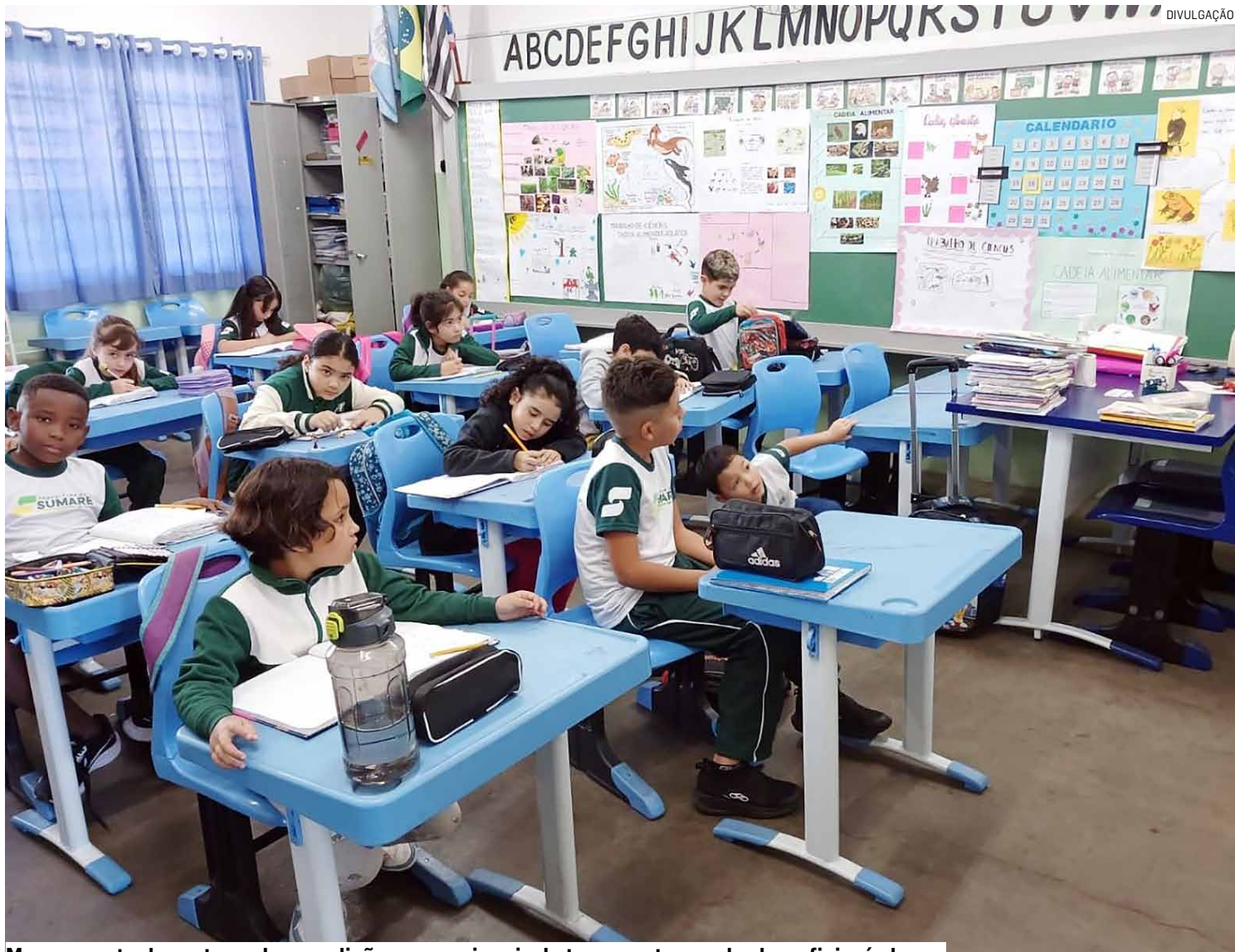
Mapeamento das rotas e das condições operacionais do transporte escolar beneficiará alunos

A prefeitura argumenta que o objetivo é criar uma