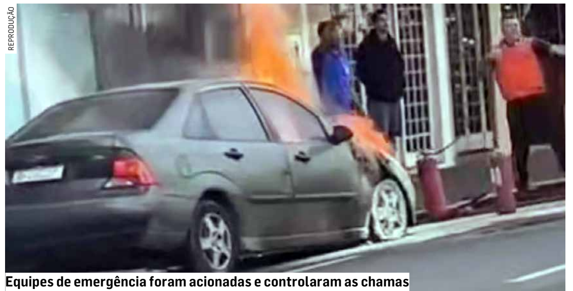
Equipes de emergência foram acionadas e controlaram as chamas

Até o momento, não há confirmação de feridos. As causas do incêndio ainda são desconhecidas e deverão ser apuradas.