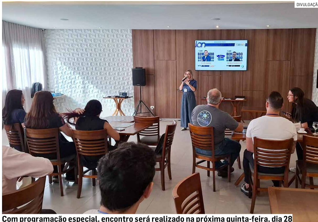
Com programação especial, encontro será realizado na próxima quinta-feira, dia 28

“O grupo de networking ACIAS ION nasceu para apoiar os empreendedores de Sumaré e há cinco anos vem conectando as empresas e fomentando negócios. É hoje o principal grupo de networking de Sumaré, fruto de um trabalho contínuo realizado pela ACIAS”, co-