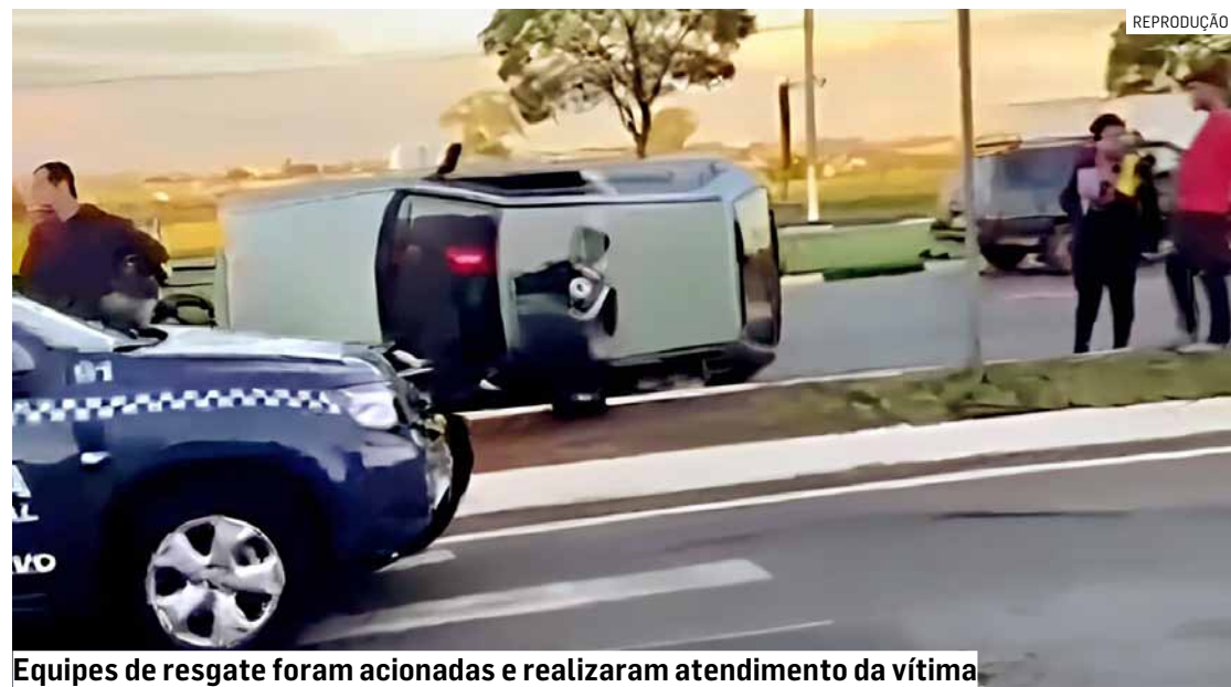
Equipes de resgate foram acionadas e realizaram atendimento da vítima

Cézar Oliveira • HORTOLÂNDIA tribunaliberal@tribunaliberal.com.br