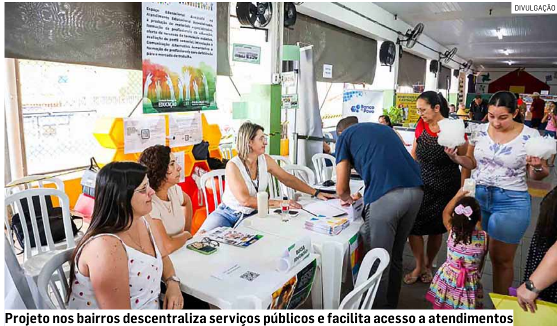
Projeto nos bairros descentraliza serviços públicos e facilita acesso a atendimentos

Da Redação • PAULÍNIA tribunaliberal@tribunaliberal.com.br