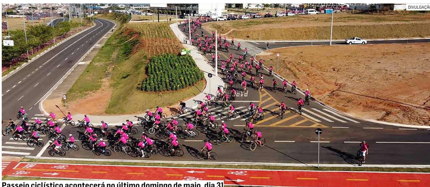
Passeio ciclístico acontecerá no último domingo de maio, dia 31

As inscrições gratuitas para a nona edição do “Vem de Bike”, tradicional passeio ciclístico promovido pela Prefeitura de Hortolândia que faz parte dos eventos oficiais aos 35 anos da cidade, seguem abertas. De acordo com a Secretaria de Mobilidade Urbana, já são mais de 900 participantes confirmados. O “Vem de Bike” acontece no domingo (31), a partir das 7h com o objetivo de promover a mobilidade ativa e a sustentabilidade.