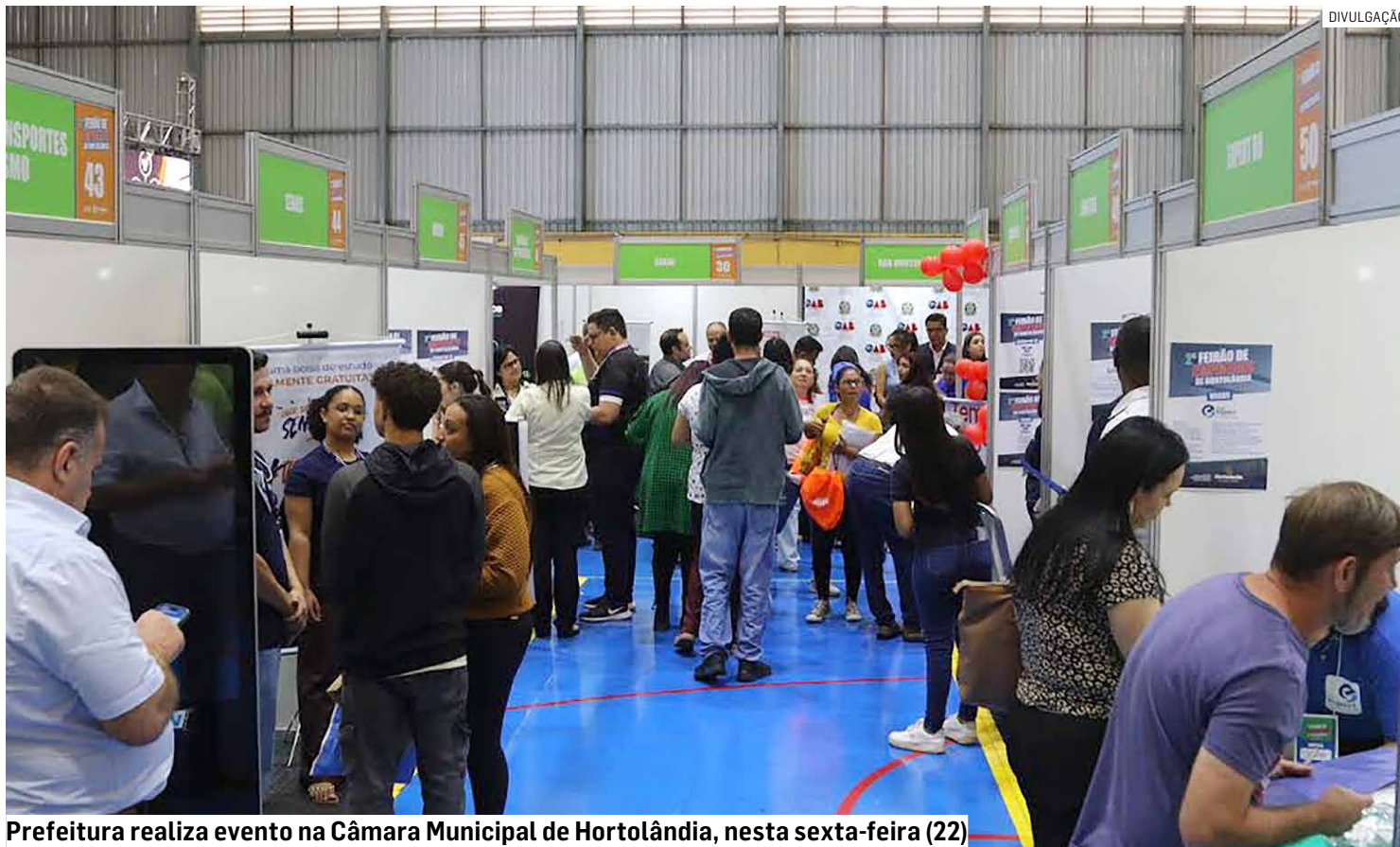
Prefeitura realiza evento na Câmara Municipal de Hortolândia, nesta sexta-feira (22)

Para possibilitar que o público compareça ao evento, a Secretaria de Mobilidade Urbana irá disponibilizar uma linha especial de ônibus, cujo número será 310A - TMH (Termi-