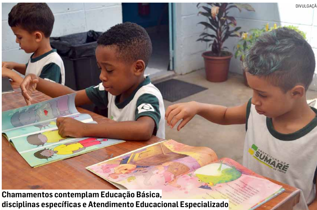
Chamamentos contemplam Educação Básica, disciplinas específicas e Atendimento Educacional Especializado

Os editais contemplam vagas para Professor Mu-