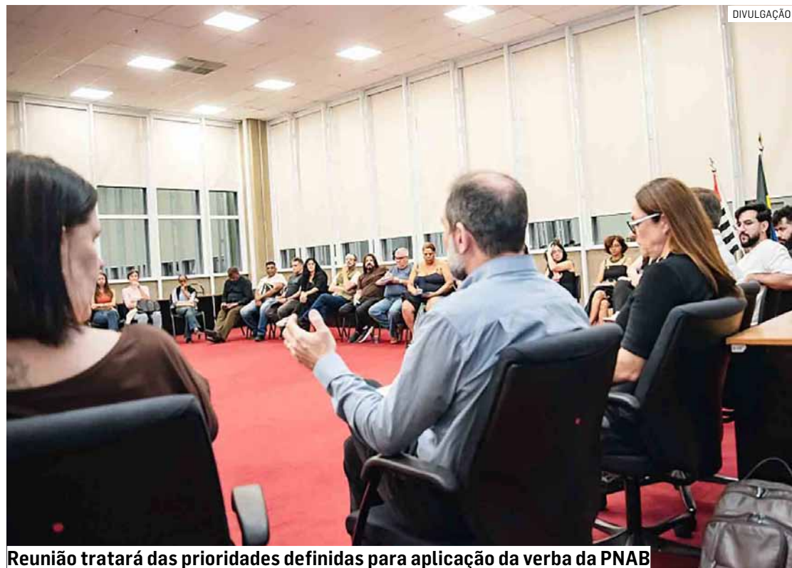
Reunião tratará das prioridades definidas para aplicação da verba da PNAB

O encontro é uma continuidade do que foi dialogado e combinado na escuta pública realizada no último dia 8 de maio e na oportunidade serão apresentados o resultado das contribuições recebidas durante a oitava com a classe artística; as prioridades definidas pa-