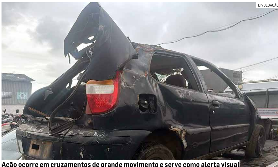
Ação ocorre em cruzamentos de grande movimento e serve como alerta visual

A intervenção é uma iniciativa da Secretaria de Segurança Pública e acontece simultaneamente nos seguintes locais: Avenida