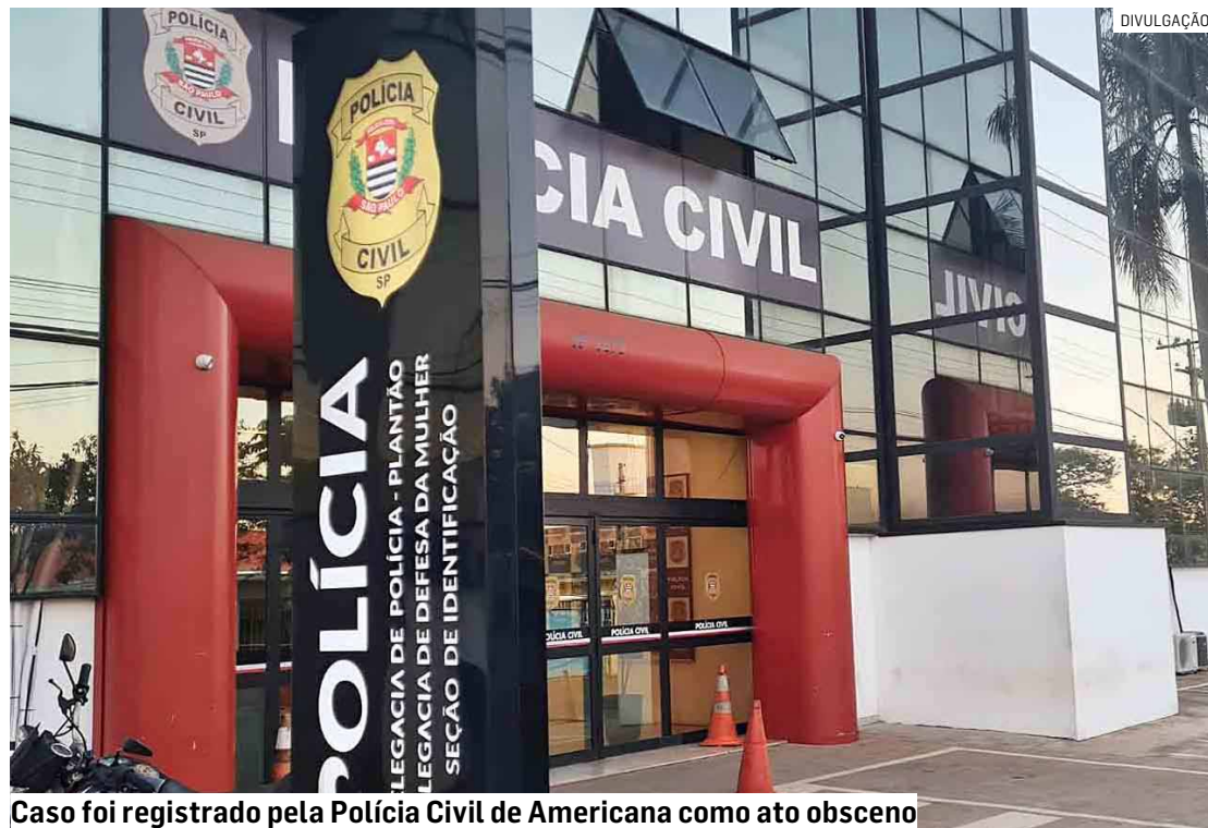
Caso foi registrado pela Polícia Civil de Americana como ato obscuro

Os agentes tentaram contato no apartamento e, posteriormente, tiveram a entrada autorizada pela mãe do jovem, que esteve no local acompanhada por familiares.