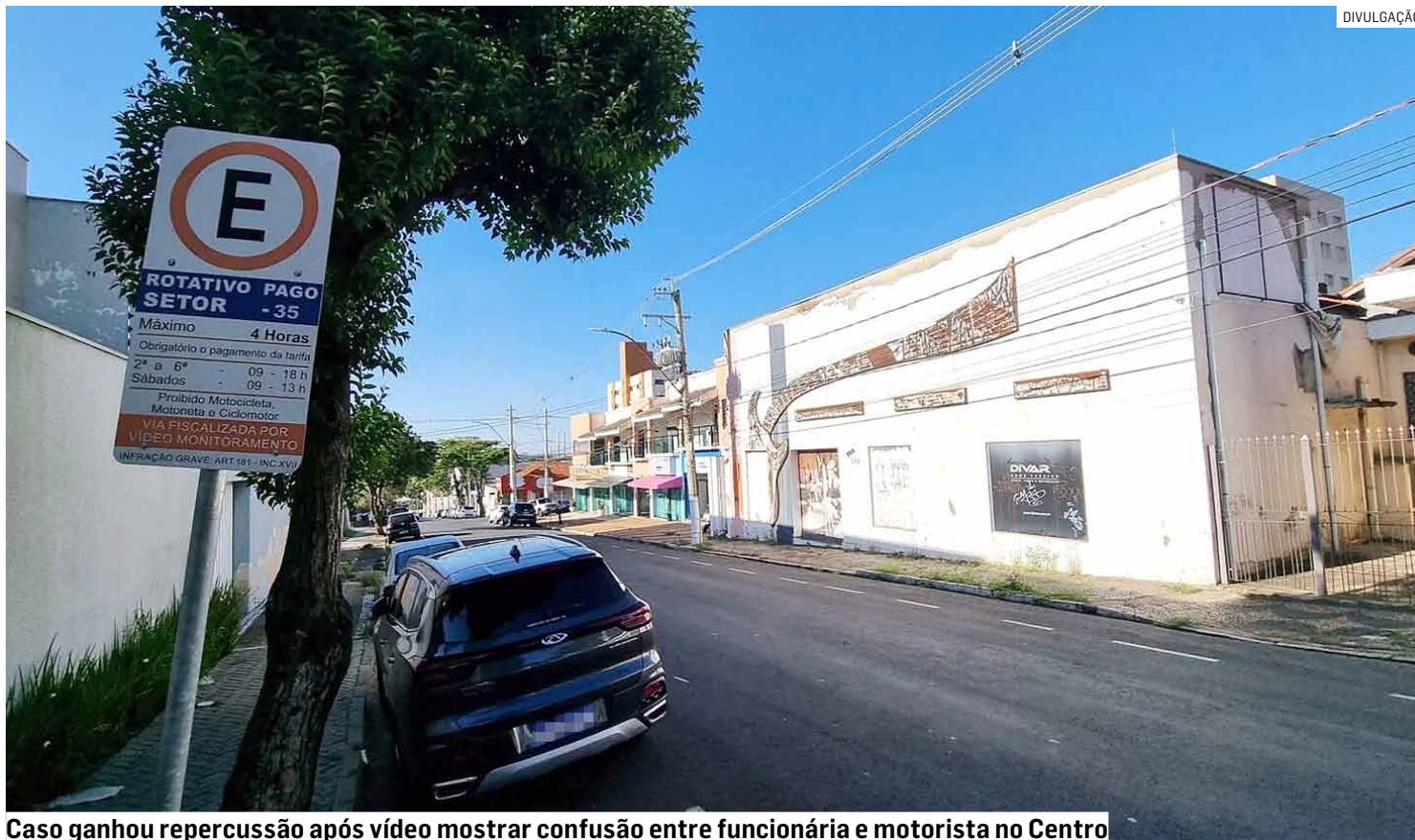
Caso ganhou repercussão após vídeo mostrar confusão entre funcionária e motorista no Centro

“A Prefeitura de Americana repudia qualquer tipo de agressão ou uso de violência. Diante do ocorrido que ganhou repercussão nesta segunda-feira, a Administração notificou a Estapar para que preste esclarecimentos sobre o caso e informe quais providências serão adotadas com relação aos funcionários envolvidos”, informou o município.