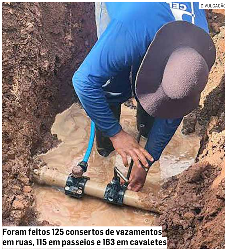
Foram feitos 125 consertos de vazamentos em ruas, 115 em passeios e 163 em cavaletes

si, Frezzarin, Iate Clube de Americana, Jardim Boer, Jardim Brasil, Jardim da Balsa, Jardim da Mata, Jardim da Paz, Jardim dos Lírios, Jardim Ipiranga, Jardim Nossa Senhora de Fátima, Jardim Nova Aliança, Jardim Paulistano, Morada do Sol, Nova Carioba, Parque da Liberdade, Parque Gramado, Parque Universitário, Portal da Colina, Praia Azul, Praia dos Na-