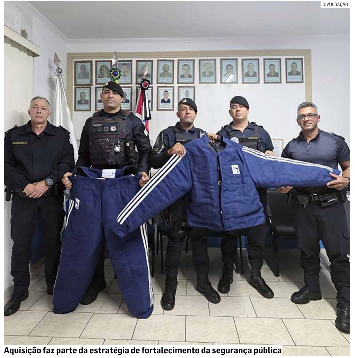
Aquisição faz parte da estratégia de fortalecimento da segurança pública

O encontro abordou temas como prevenção de acidentes, fatores de risco no trânsito, direção evasiva e segurança viária, reunindo participantes de diferentes cidades da região, tanto presencialmente quanto de forma online.