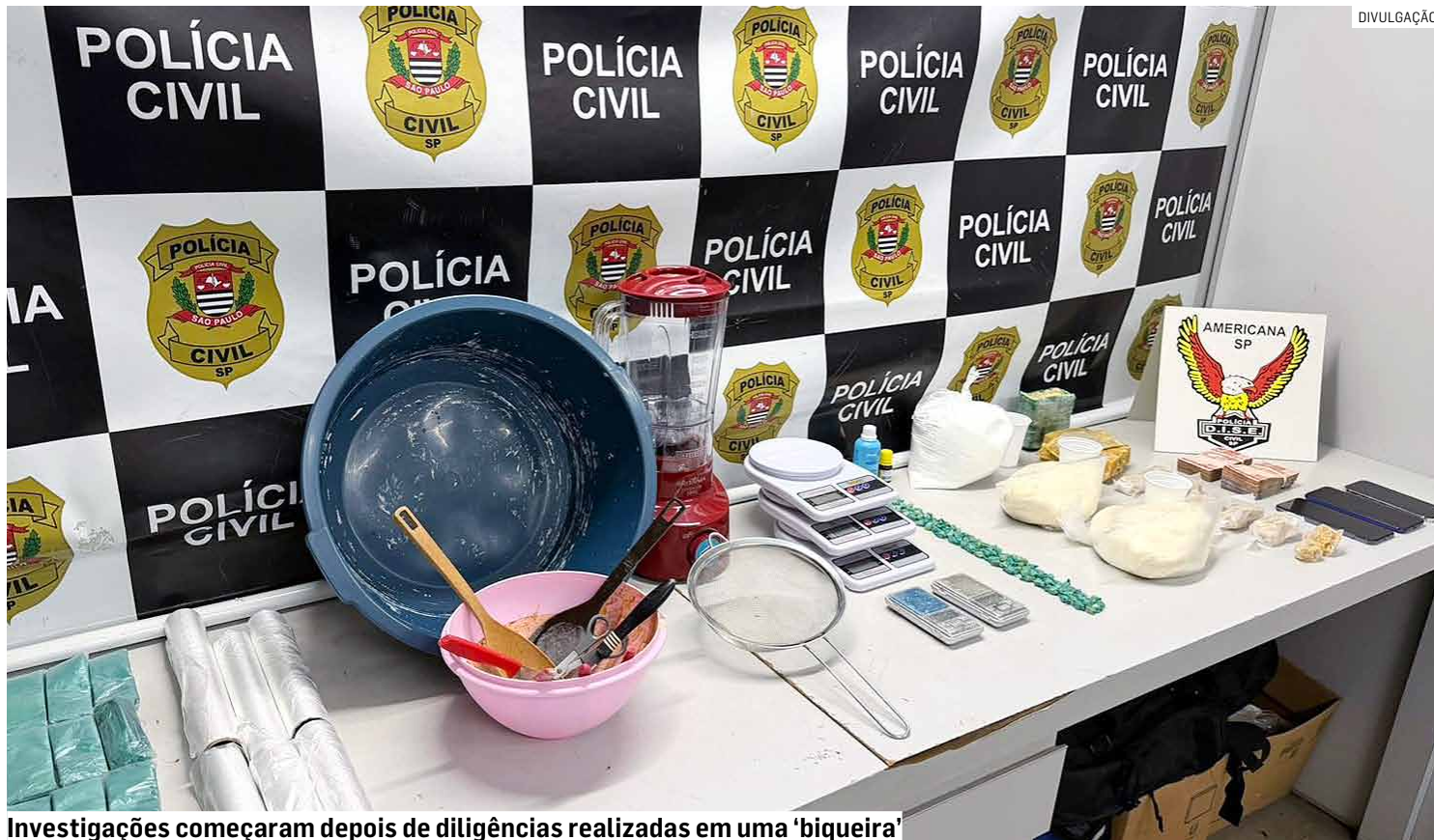
Investigações começaram depois de diligências realizadas em uma 'biqueira'

As investigações tiveram início após diligências realizadas pela Dise em uma "biqueira" localizada no Jardim Nova Europa. Com o avanço do trabalho investigativo, os po-