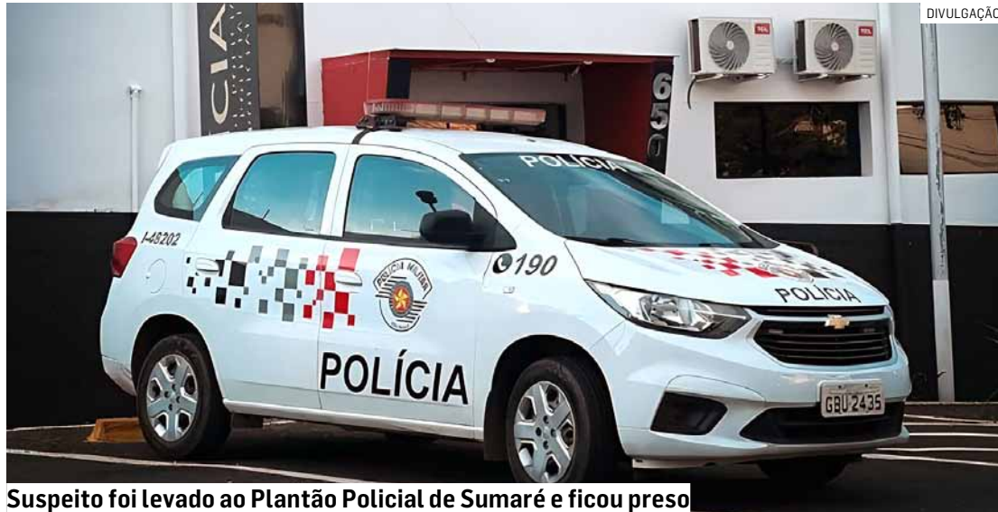
Suspeito foi levado ao Plantão Policial de Sumaré e ficou preso

De acordo com a corporação, equipes realizavam patrulhamento preventivo pela região quando foram abordadas por um homem de 47 anos. Bastante abalado, ele contou aos policiais que dormia na calçada quando acordou com o suspeito pra-