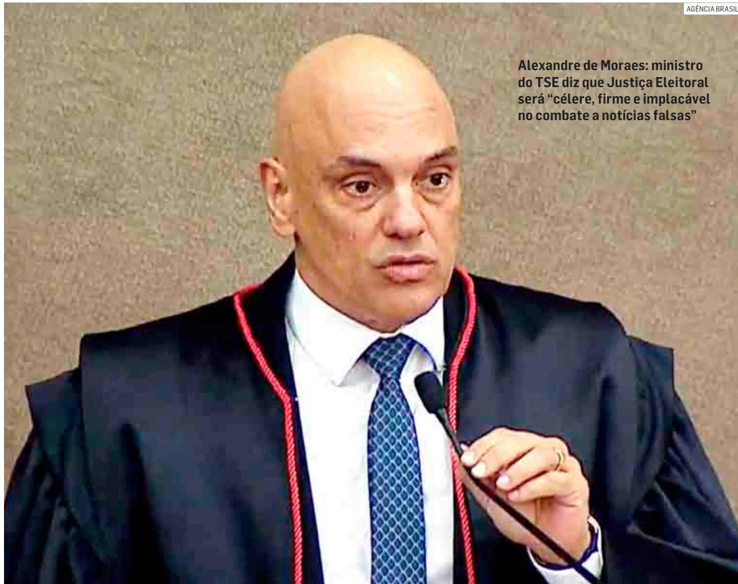
Alexandre de Moraes: ministro do TSE diz que Justiça Eleitoral será "célere, firme e implacável no combate a notícias falsas"

Nesta semana, durante seu discurso de posse, o novo ministro do TSE, Alexandre de Moraes, reforçou a intensificação das medidas de combate às fake news, principal desafio do órgão des-