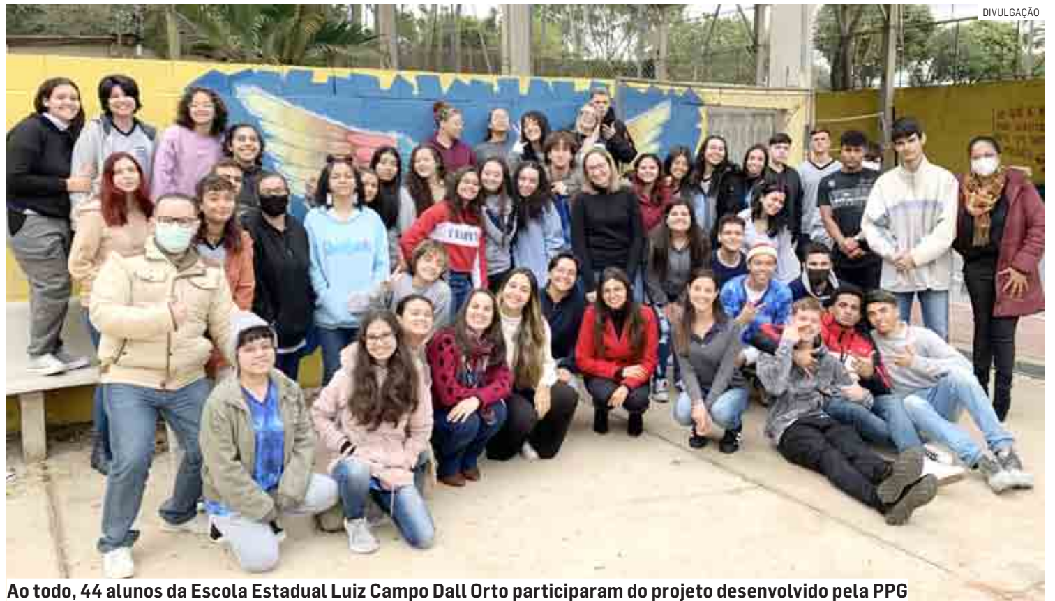
Ao todo, 44 alunos da Escola Estadual Luiz Campo Dall Orto participaram do projeto desenvolvido pela PPG

Os outros programas investidos pela PPG que acontecerão ainda em 2022 são o “Montando sua Carreira + Diversi-