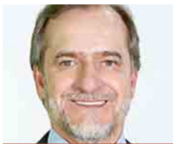
DALBEN (CIDADANIA) - SUMARÉ