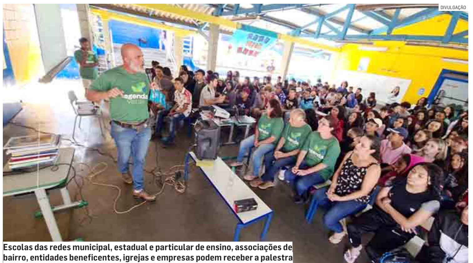
Escolas das redes municipal, estadual e particular de ensino, associações de bairro, entidades beneficentes, igrejas e empresas podem receber a palestra

Escolas das redes municipal, estadual e particular de ensino, associações de bairro, entidades beneficentes, igrejas e empresas que tenham interesse em receber a palestra sobre educação