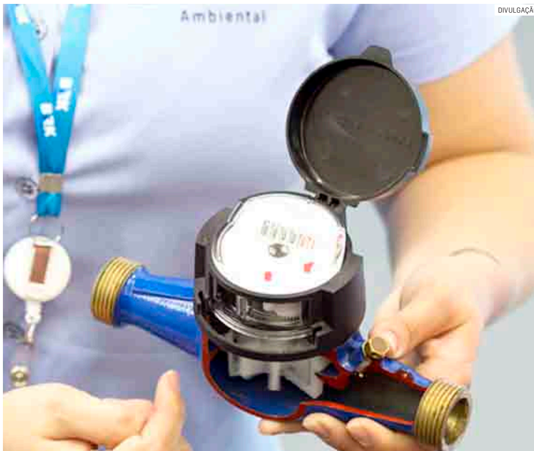
Hidrômetro é um equipamento de precisão que registra o consumo do imóvel em tempo real

O aparelho registra o volume de água utilizado em um imóvel, o que resulta no valor da fatura ao fim do mês, de acordo com o uso. Portanto, toda vez que o chuveiro