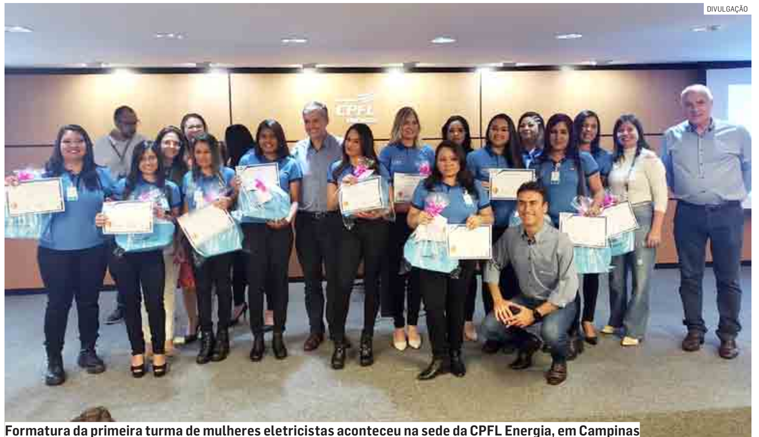
Formatura da primeira turma de mulheres eletricistas aconteceu na sede da CPFL Energia, em Campinas

As escolas de eletricistas exclusivas para mulheres iniciaram em 2021 na CPFL e integram as ações do CPFL + Diversa. O programa foi criado em 2020 pela CPFL e busca organizar e orientar as ações da companhia na busca pela diversidade, equidade e inclusão.