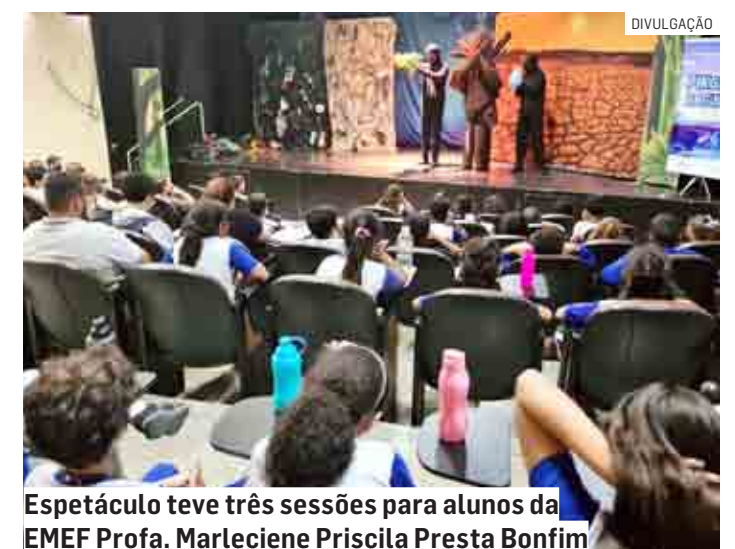
Espectáculo teve três sessões para alunos da EMEF Profa. Marleciene Priscila Presta Bonfim

Para piorar, as águas estão sujas, e por causa disso, os peixes estão doentes. Todos esses problemas foram causados pela Madame Polú e seu mordomo, Sr. Sujerinha. Para vencer essa vilã e salvar o rio, Pingo vai contar com a ajuda de outros pingos d’água e também das crianças.