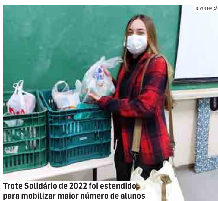
Trote Solidário de 2022 foi estendido para mobilizar maior número de alunos