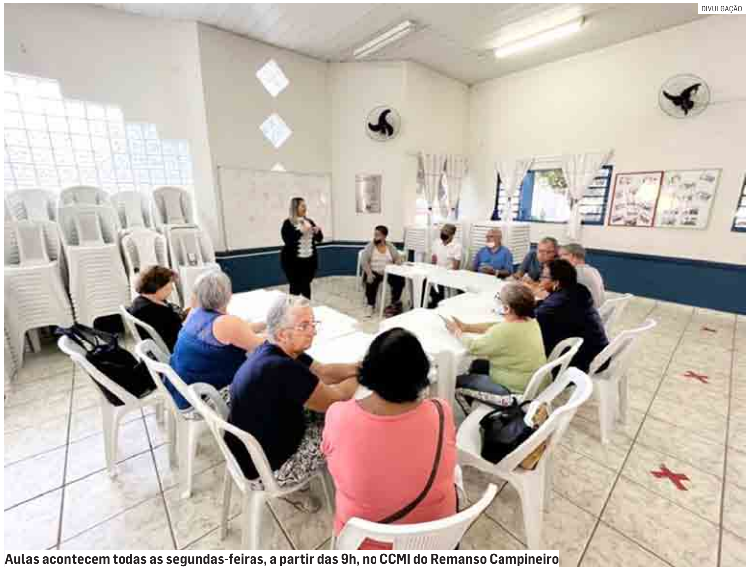
Aulas acontecem todas as segundas-feiras, a partir das 9h, no CCMI do Remanso Campineiro

Segundo a coordenadora, o uso da tecnologia pelo grupo da Me-