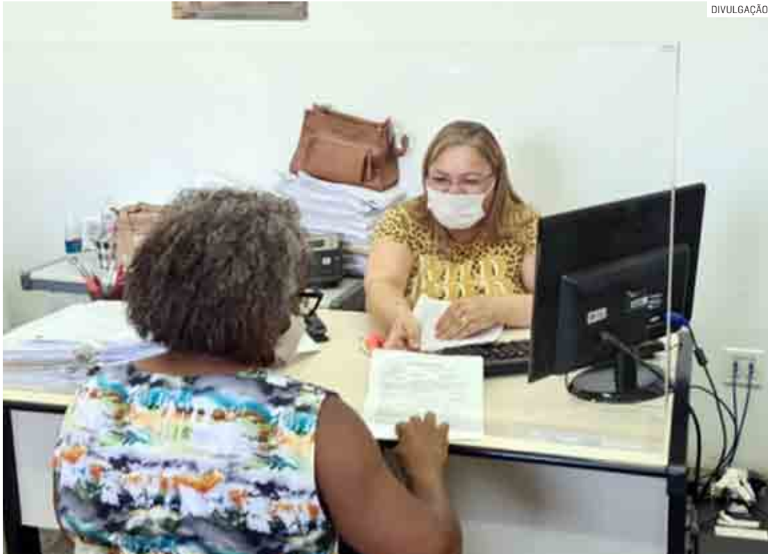
Banco do Povo é um órgão do governo do Estado que atua em parceria com as prefeituras

De acordo com balanço divulgado pela Prefeitura de Hortolândia, mês de julho bateu recorde de contratos, que totalizaram R$ 1.032.246,39