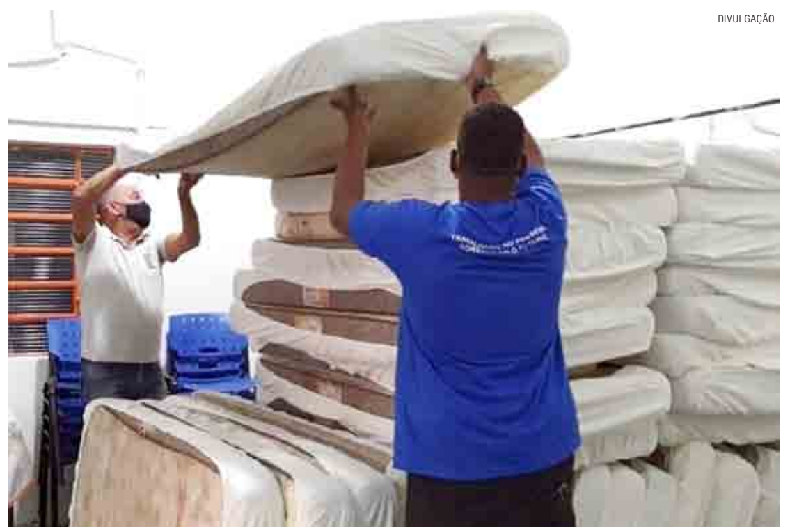
Instituto Esperançar presta serviços públicos de acolhimento e abrigo provisório na cidade

Da Redação | HORTOLÂNDIA tribunaliberal@tribunaliberal.com.br