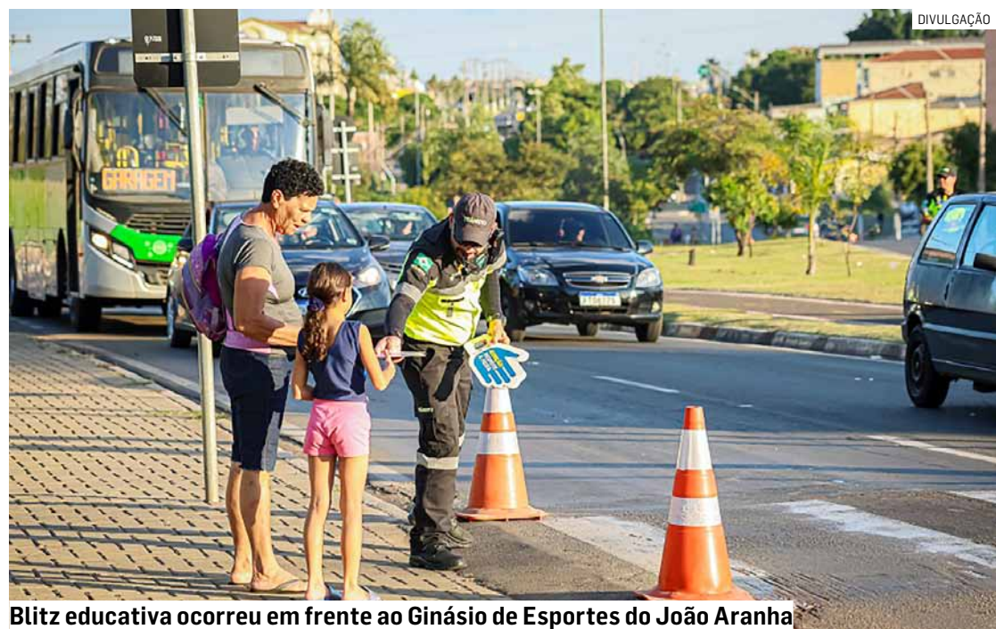
Blitz educativa ocorreu em frente ao Ginásio de Esportes do João Aranha