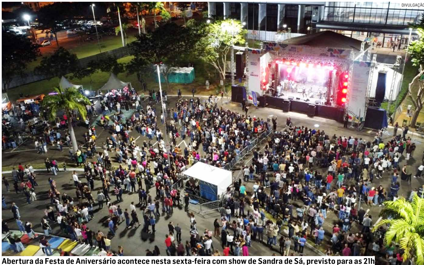
Abertura da Festa de Aniversário acontece nesta sexta-feira com show de Sandra de Sá, previsto para as 21h

Assim como nos anos anteriores, o estacionamento da Festa será realizado no entorno da Praça. O recinto vai contar com mais de 50 barracas e food trucks com opções gastronômicas, Feira de Artesanato e o Parque do Amiguinho – com opções de diversão para crianças e adultos. O Aniversário de Nova Odessa tem início na sexta-feira, dia 23, com o show da lendária cantora Sandra de Sá, previsto para as 21h. Neste dia, o recinto abre ao público às 19h.