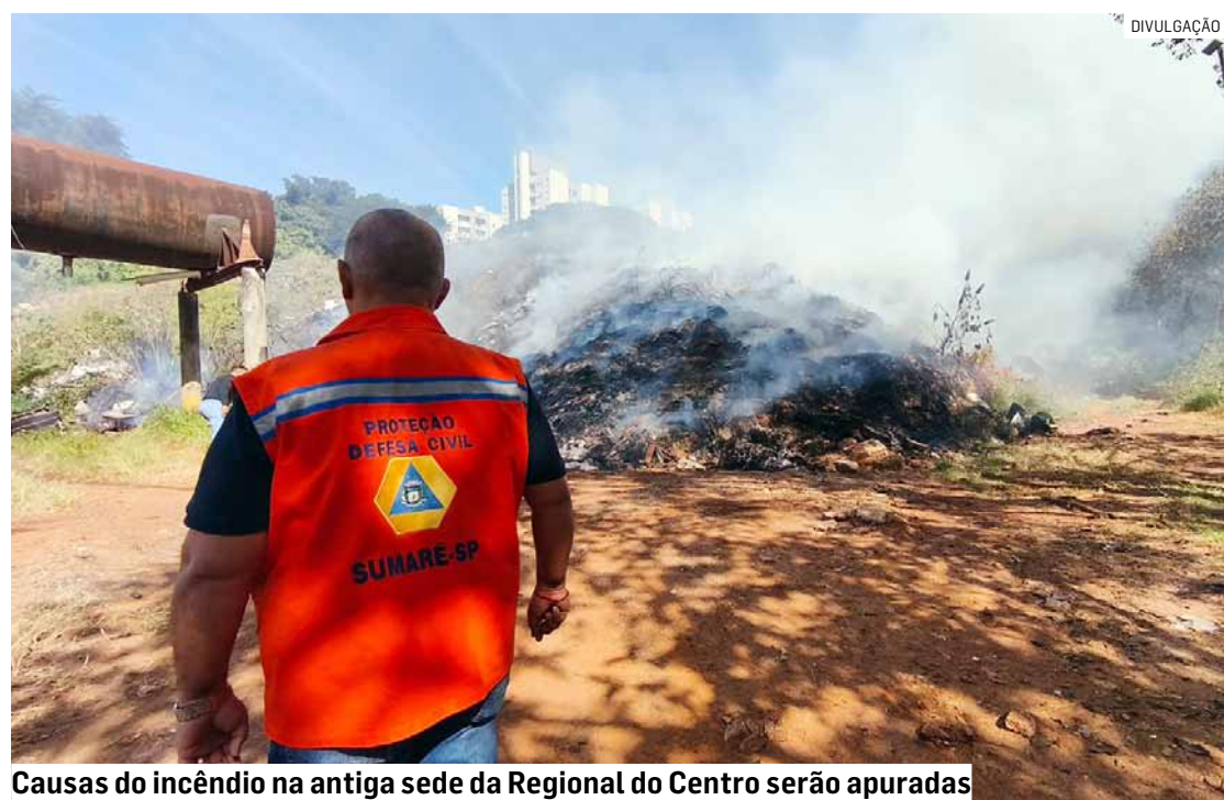
Causas do incêndio na antiga sede da Regional do Centro serão apuradas

A administração municipal destacou que todas as medidas de segurança estão sendo adotadas e que seguirá acompanhando o caso.