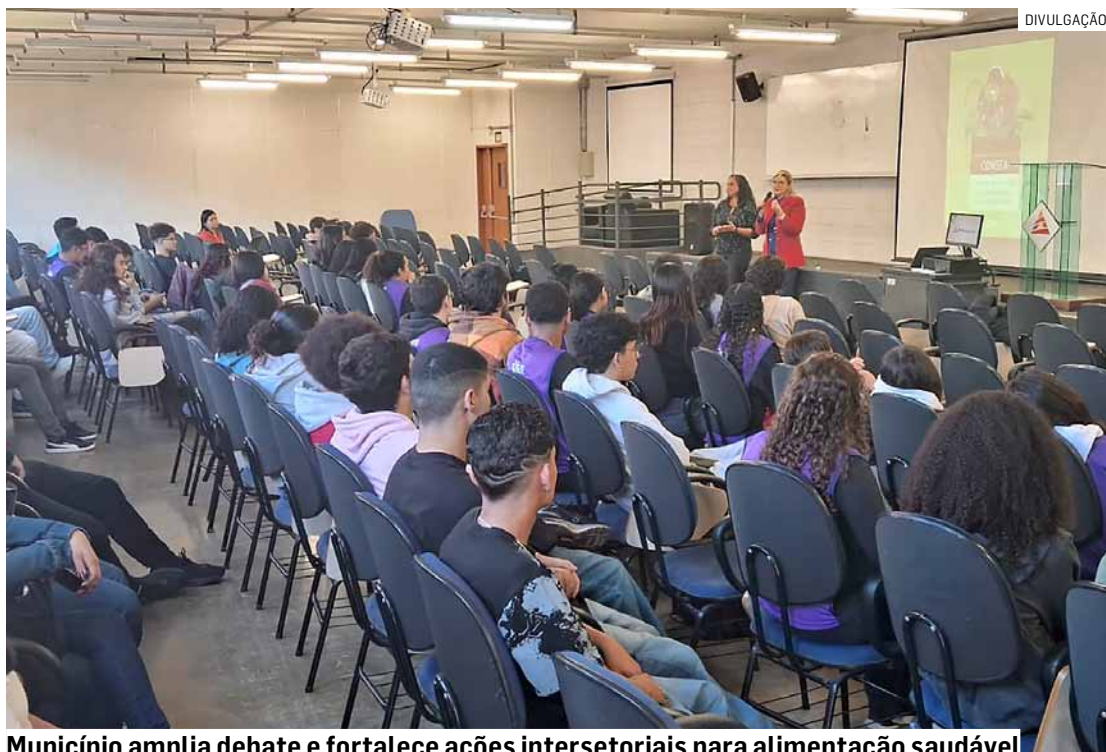
Município amplia debate e fortalece ações intersetoriais para alimentação saudável