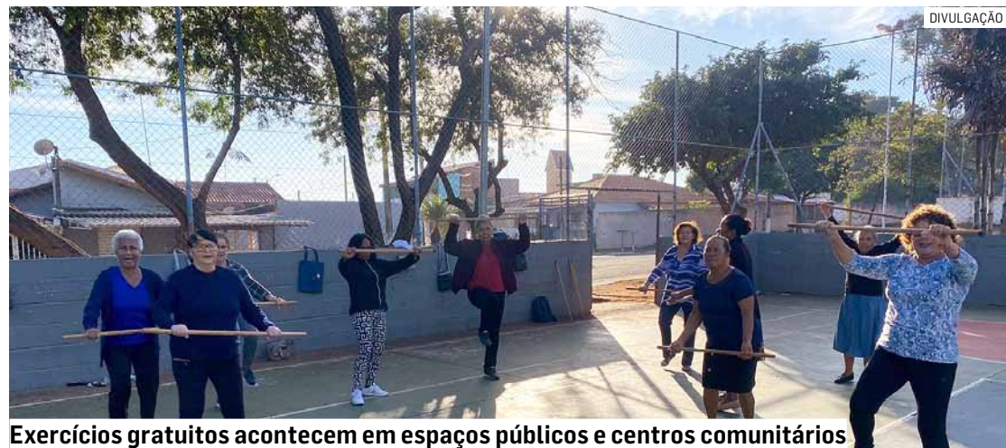
Exercícios gratuitos acontecem em espaços públicos e centros comunitários

Sextas-feiras: Praça Rosa Maluf (Praça do Cannon) - Jardim Marchissolo