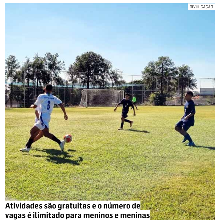
Atividades são gratuitas e o número de vagas é ilimitado para meninos e meninas

São 25 modalidades disponíveis, gratuitamente, em 12 espaços distribuídos em diferentes regiões da cidade pelo projeto da prefeitura.