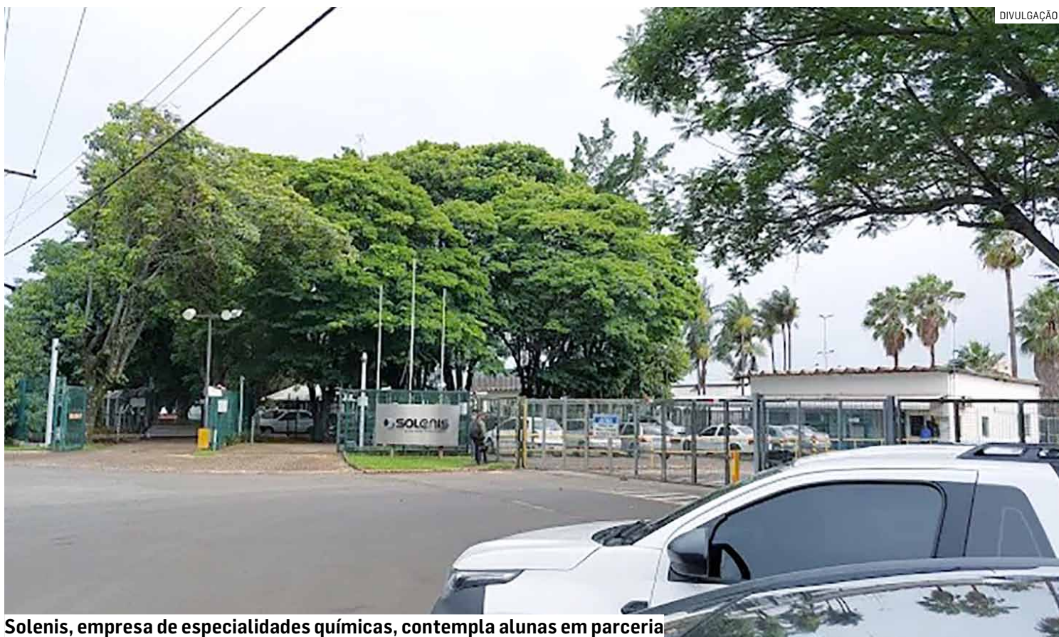
Solenis, empresa de especialidades químicas, contempla alunas em parceria

Essa parceria integra a estratégia de diversidade e inclusão da Solenis, que inclui metas para aumentar a participação de mulheres e outros grupos sub-