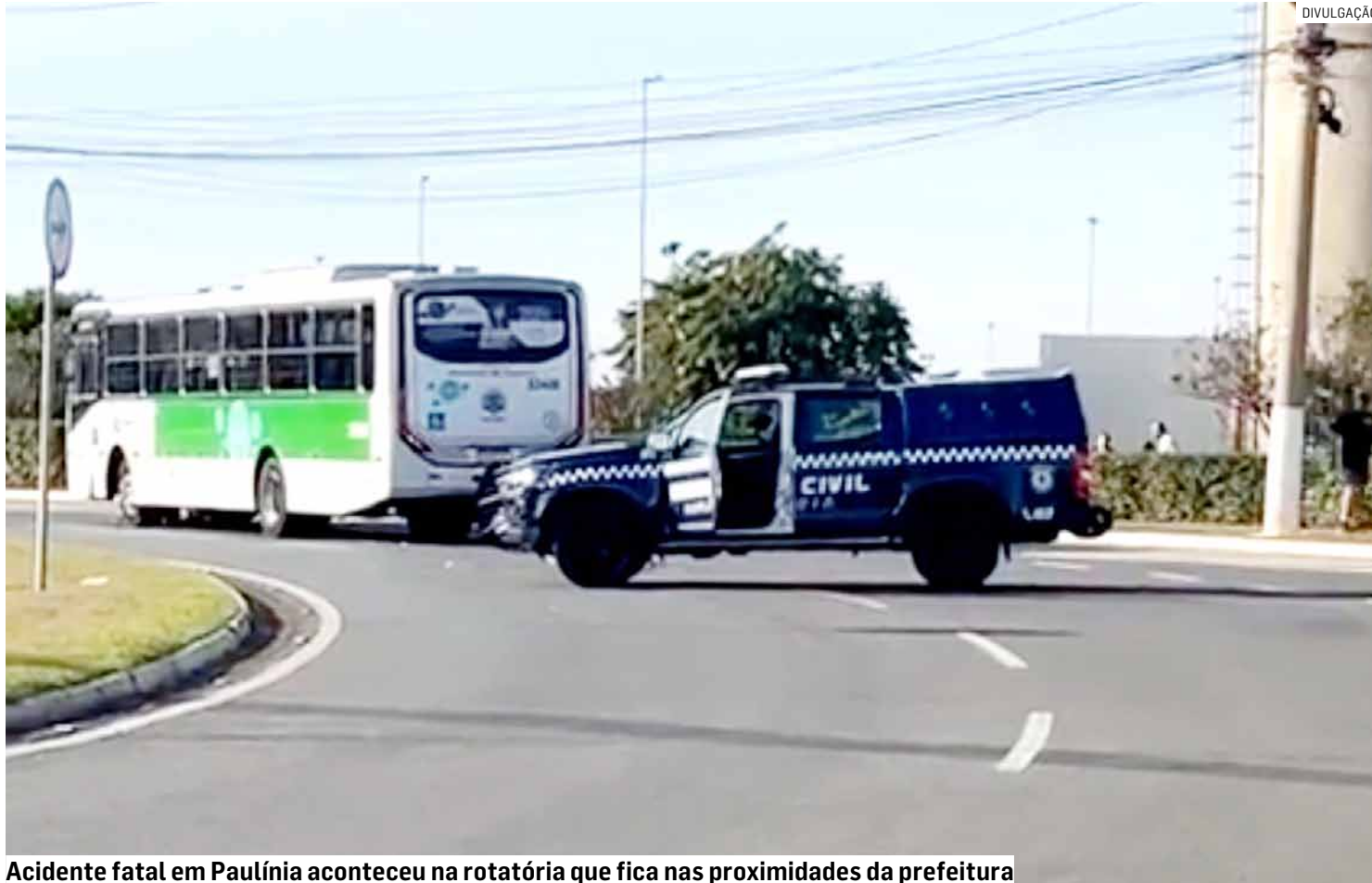
Acidente fatal em Paulínia aconteceu na rotatória que fica nas proximidades da prefeitura

As equipes da Guarda Civil Municipal e do resgate compareceram ao local e prestaram os primeiros atendimentos às vítimas.