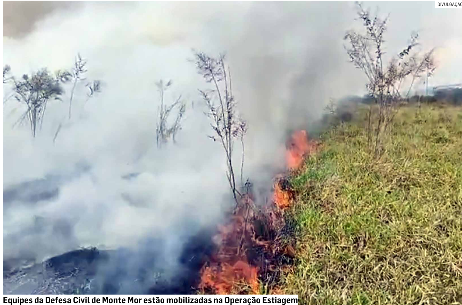
Equipes da Defesa Civil de Monte Mor estão mobilizadas na Operação Estiagem

Operação Estiagem tem início no município e segue até 30 de setembro, com possibilidade de prorrogação; decreto assinado pelo prefeito Murilo Rinaldo permite ações emergenciais e autuações contra autores de incêndios na cidade