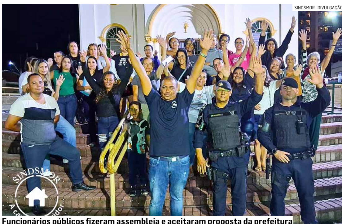
Funcionários públicos fizeram assembleia e aceitaram proposta da prefeitura

Além do reajuste salarial, os trabalhadores obtiveram aumento do teto salarial para R$ 2.500,00 —