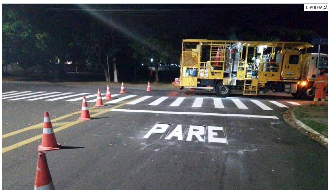
Ação organiza o trânsito nas ruas de acesso para o viaduto quando o dispositivo for liberado

Equipes da Prefeitura de Hortolândia realizaram o reforço e a implantação da sinalização de solo em vias do Jardim Rosolém que darão acesso ao novo viaduto. A estrutura segue em obras, sobre a Rodovia Jornalista Francisco Aguirre Proença (SP-101), e ligará o bairro ao Jardim Sumarinho. De acordo com a Secretaria de Mobilidade Urbana, o trabalho foi concluído no trecho entre as ruas Emma Fredericci Geraldelli e Papa João Paulo II. Na área foram pintadas faixas de pedestres, faixas de retenção, faixas duplas amarelas e alertas "PARE".