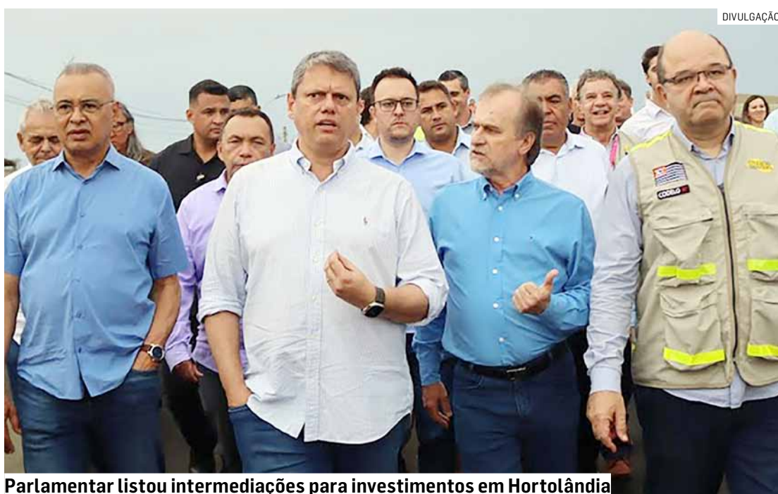
Parlamentar listou intermediações para investimentos em Hortolândia

“Hortolândia é uma cidade pela qual temos muito carinho. Jovem e promissora, tem se destacado nos cenários regional, estadual e nacional. Nesta data em que completa 34 anos de história, queremos parabenizar a todos os hortolandenses, que tanto contribuem para o desenvolvimento dessa querida cidade. Para mim, é também