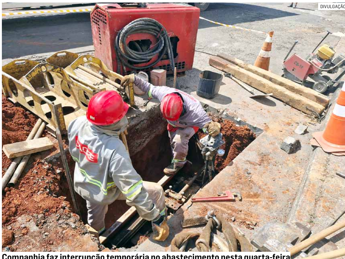
Companhia faz interrupção temporária no abastecimento nesta quarta-feira

A iniciativa faz parte de um projeto abrangente de