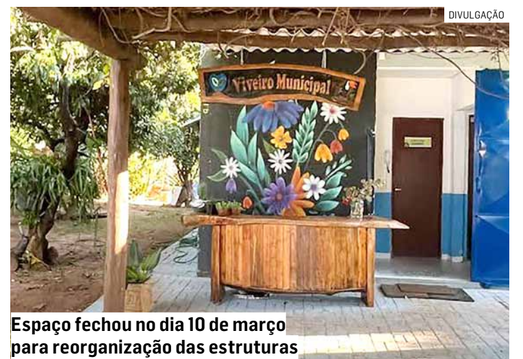
Espaço fechou no dia 10 de março para reorganização das estruturas

O Viveiro Municipal está localizado na Rua Stefano Dilo, 350, no Adventista Campineiro. O horário de atendimento é de segunda a sexta-feira, das 7h30 às 11h30 e das 13h às 16h.