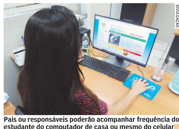
Pais ou responsáveis poderão acompanhar frequência do estudante do computador de casa ou mesmo do celular