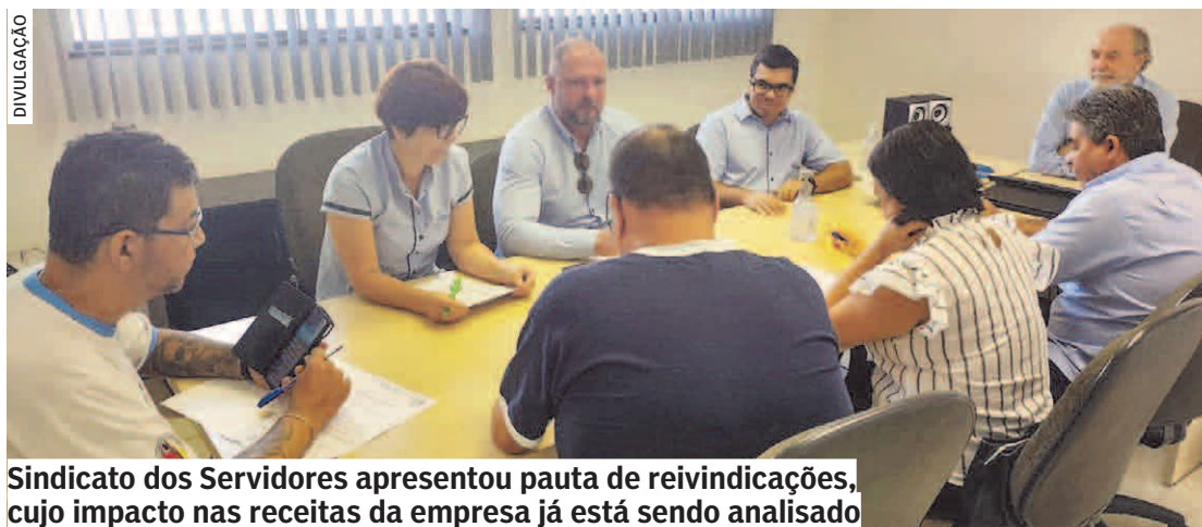
Sindicato dos Servidores apresentou pauta de reivindicações, cujo impacto nas receitas da empresa já está sendo analisado