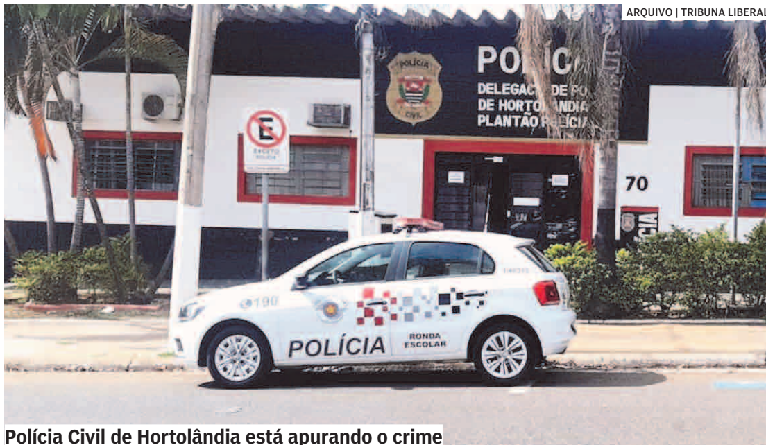
Polícia Civil de Hortolândia está apurando o crime

O caso foi registrado como homicídio. Segundo a Polícia Militar, o crime ocorreu por volta das 18h10 dentro do estabelecimento, que fica na Rua Sivaldi Joana dos Santos, 75, no Jardim Santiago. Um desconhecido teria invadido o local e efetuado os disparos contra a vítima. Após os disparos, o autor se evadiu. Quando os policiais militares chegaram, localizaram apenas a vítima, que aparentemente