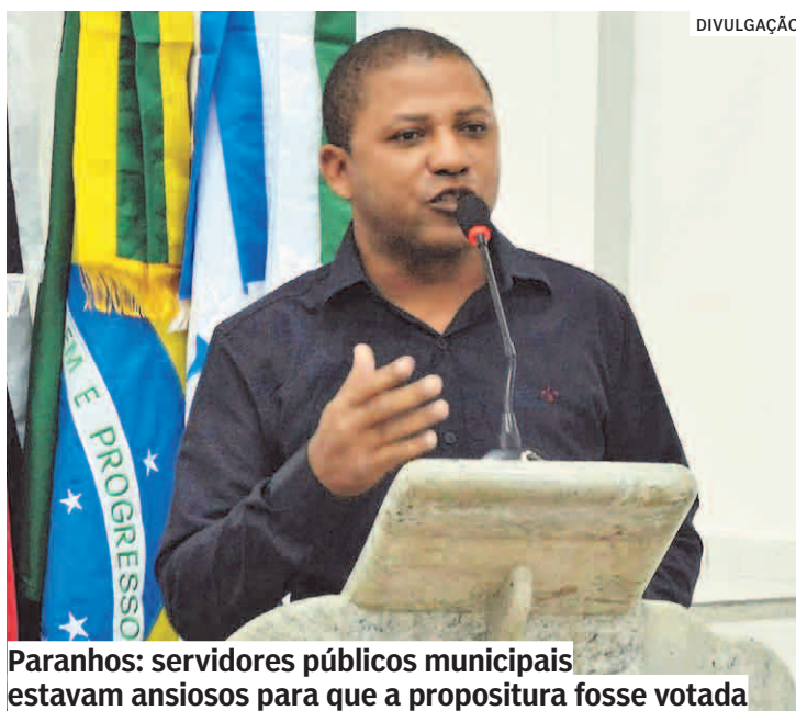
Paranhos: servidores públicos municipais estavam ansiosos para que a proposição fosse votada

O PLC não cita os valores das referências salariais. Antes da votação, alguns parlamentares afirmaram que, com essa mudança no Plano de Carreira dos Servidores, funcionários públicos que recebem cerca de R$ 2 mil poderão ser contemplados com o vale-transporte anteriormente, o benefício era concedido aos que recebem cerca de R$ 1,4 mil, explicaram.