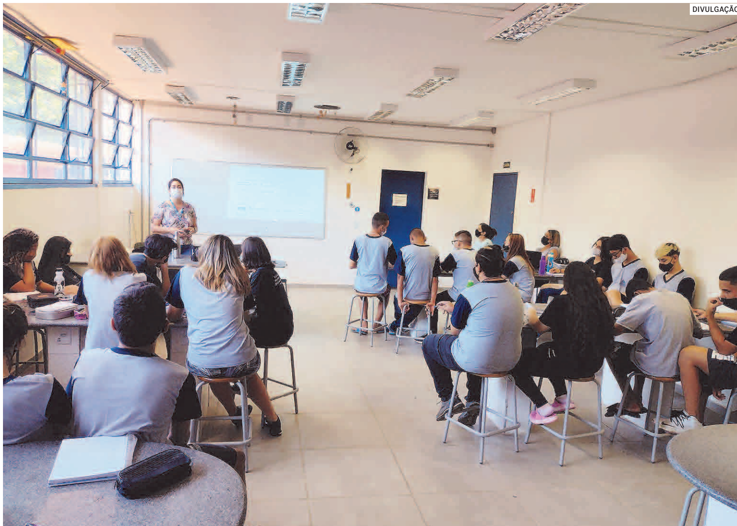
Palestras podem ser realizadas em instituições de ensino público ou privado, empresas, entidades e associações

Outro ponto importante abordado foram as análises realizadas pela empresa. Para se ter uma