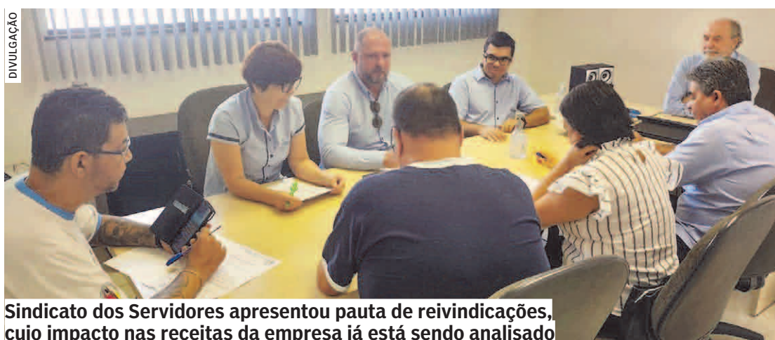
Sindicato dos Servidores apresentou pauta de reivindicações, cujo impacto nas receitas da empresa já está sendo analisado