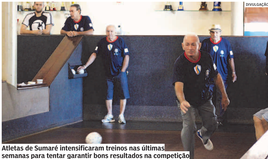
Atletas de Sumaré intensificaram treinos nas últimas semanas para tentar garantir bons resultados na competição

“O grupo está animado e empenhado com a disputa. Por conta da pandemia de Covid-19, o CCTI ficou quase dois