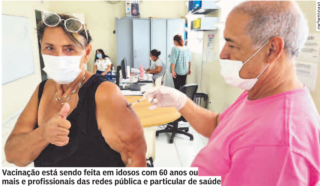
Vacinação está sendo feita em idosos com 60 anos ou mais e profissionais das redes pública e particular de saúde

A Secretaria de Saúde alerta a população que a pneumonia pode levar a óbito, principalmente idosos, bebês e crianças. A pneumonia é uma infecção que acomete os pulmões, que podem ficar cheios de líquido. Os principais sintomas da pneumonia são tosse com catarro ou pus de cor amarelada ou esver-