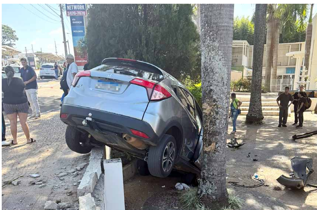
Acidente poderia ter sido mais grave caso tivesse ocorrido na saída dos alunos ao meio-dia