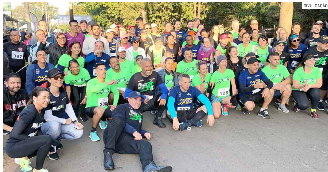
Evento esportivo acontece em frente ao Jardim Botânico Plantarum, na avenida Brasil

O evento promete reunir atletas e entusiastas de toda a região. O percurso, com cerca de 5 quilômetros, parte da Praça Vera Luzia Lorenzi, seguindo por trechos asfaltados pelas ruas do município. A retirada