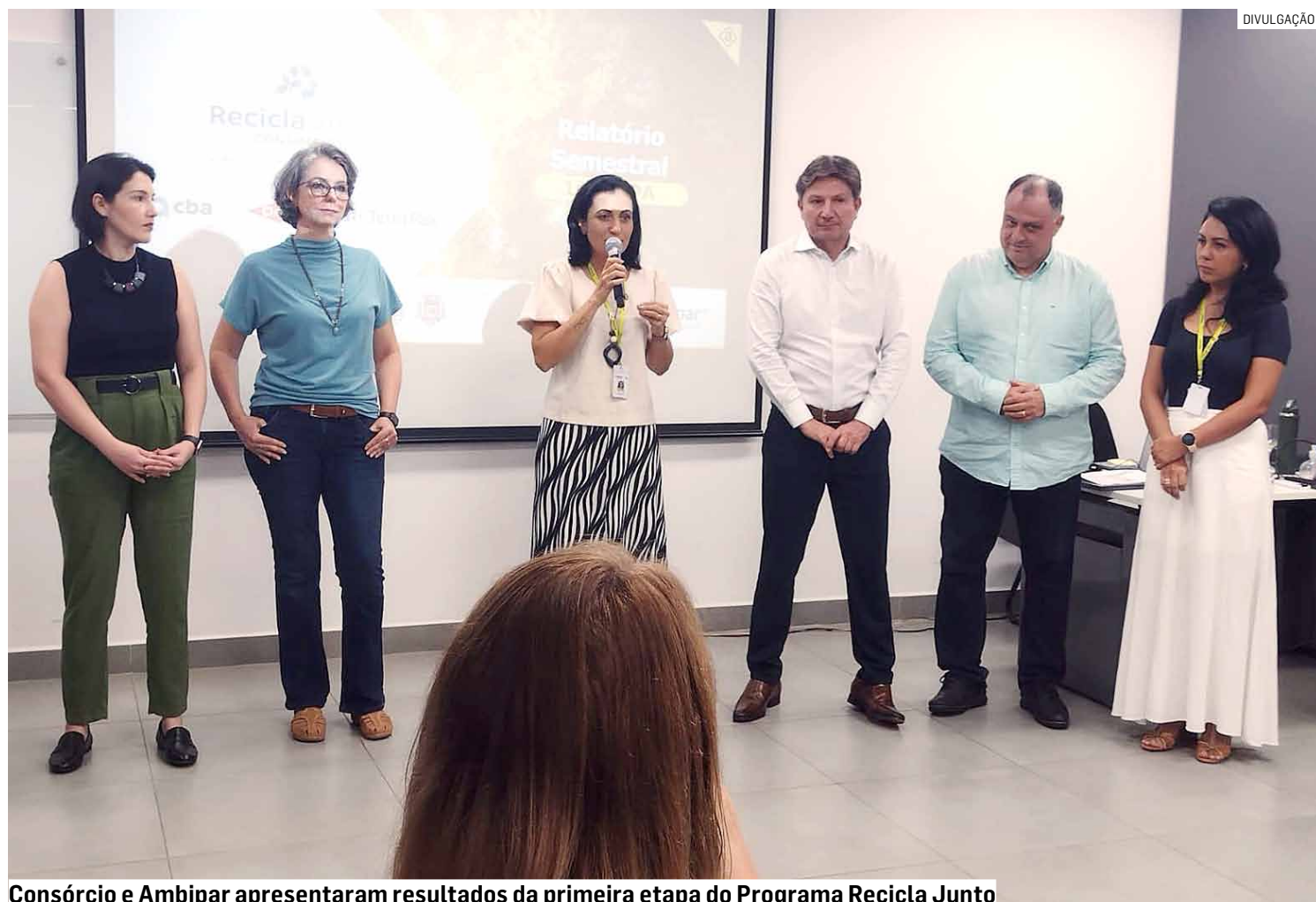
Consórcio e Ambipar apresentaram resultados da primeira etapa do Programa Recicla Junto

O território de atuação do Consórcio tem uma população de aproximadamente 1 milhão de pessoas que produzem cerca de 700 toneladas de resíduos por dia. Pelo menos 30% desse volume são resíduos secos - vidro, plásticos, papel, papelão e metal - com potencial de reciclagem e que são descartados nos aterros sanitários, gerando grande impacto negativo ao meio