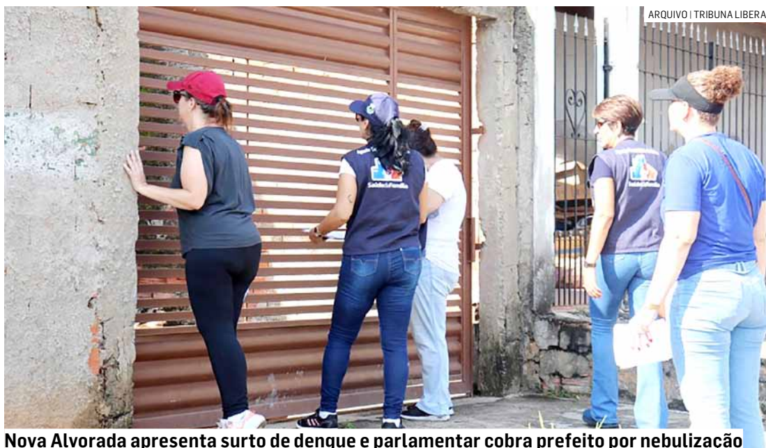
Nova Alvorada apresenta surto de dengue e parlamentar cobra prefeito por nebulização

A medida visa prevenir a necessidade de hospitalização de moradores infectados, reduzindo a sobrecarga no sistema de saúde lo-