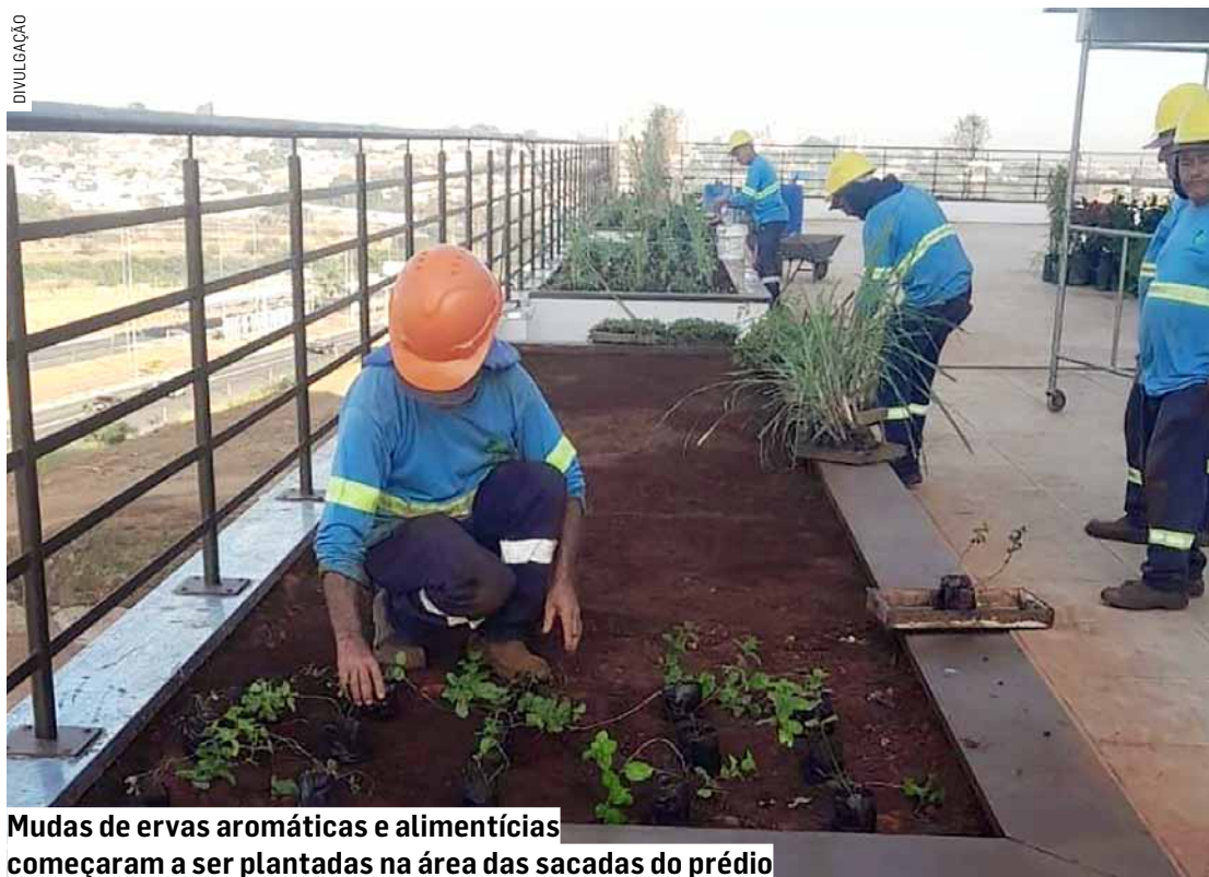
Mudas de ervas aromáticas e alimentícias começaram a ser plantadas na área das sacadas do prédio

A ação conta com o apoio de equipes da Secretaria de Serviços Urbanos, que auxiliaram no plantio e fazem a rega das plantas. Na semeadura das mudas está sendo utilizado o adubo orgânico cedido pela Prefeitura de Campinas.