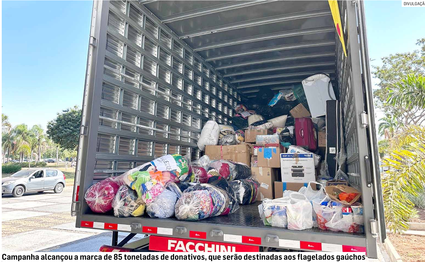
Campanha alcançou a marca de 85 toneladas de donativos, que serão destinadas aos flagelados gaúchos

Nesta sexta-feira, última carreta partiu para o Rio Grande do Sul carregada de doações, que podem continuar sendo feitas nas agências do Correios