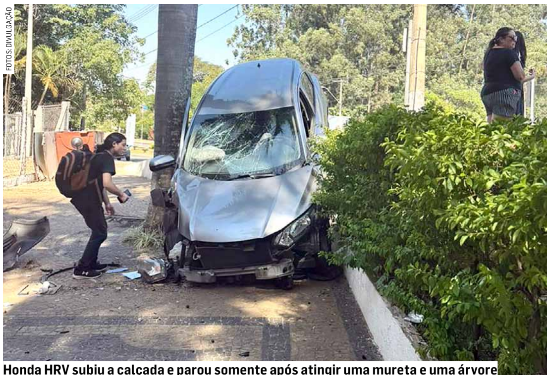
Honda HRV subiu a calçada e parou somente após atingir uma mureta e uma árvore

Um carro desgovernado atingiu mãe e filha na calçada da Faculdade e Colégio Network, em Nova Odessa, no início da tarde desta sexta-feira (17). Apesar do susto e dos ferimentos, o acidente poderia ter outras proporções caso ocorresse no horário de saída dos estudantes, que acontece por volta do meio-dia. De acordo com as informações do Corpo de Bombeiros, as vítimas estavam sentadas no meio-fio, na avenida Ampepio Gazzetta, quando o carro, que seguia no sentido Sumaré - Nova Odessa, as atingiu. Mãe e filha foram socorridas pelos bombeiros ao Hospital e Maternidade Municipal Doutor Acílio Carreon Garcia, em Nova Odessa. Já o motorista teve ferimentos leves. Ele disse aos militares que perdeu o controle do veículo, mas não soube informar o motivo e só se recordava do momento que foi retirado do carro pelos bombeiros. Um dos militares disse que ele não exalava cheiro de álcool e não soube informar se o condutor passou pelo teste do bafômetro. O carro atingiu as vítimas, passou pela calçada e só parou após cair de frente na área interna do colégio.