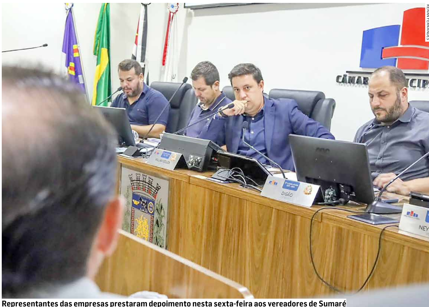
Representantes das empresas prestaram depoimento nesta sexta-feira aos vereadores de Sumaré

Após a convocação da CPI (Comissão Parlamentar de Inquérito), através dos ofícios emitidos pelo