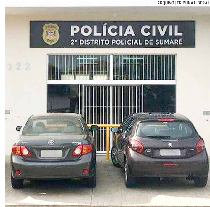
Adulto foi autuado em flagrante e adolescente liberado

A dupla foi conduzida ao 2º Distrito Policial de Sumaré, onde a ocorrência foi registrada por tráfico de drogas. No local, os policiais constataram que um dos suspeitos era adolescente. Ele foi entregue ao responsável e o adulto foi detido.