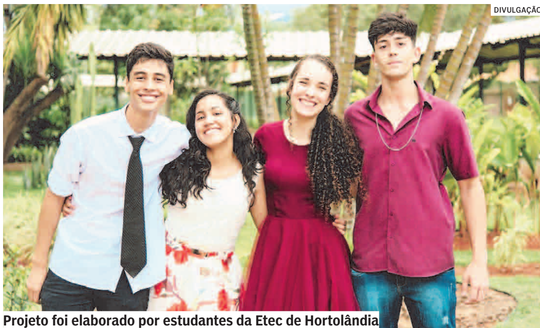
Projeto foi elaborado por estudantes da Etec de Hortolândia

Investimento será de R$ 55 milhões e as obras estão previstas para começar no segundo semestre deste ano, na região do Jd. Novo Ângulo