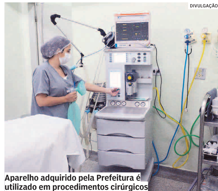
Aparelho adquirido pela Prefeitura é utilizado em procedimentos cirúrgicos