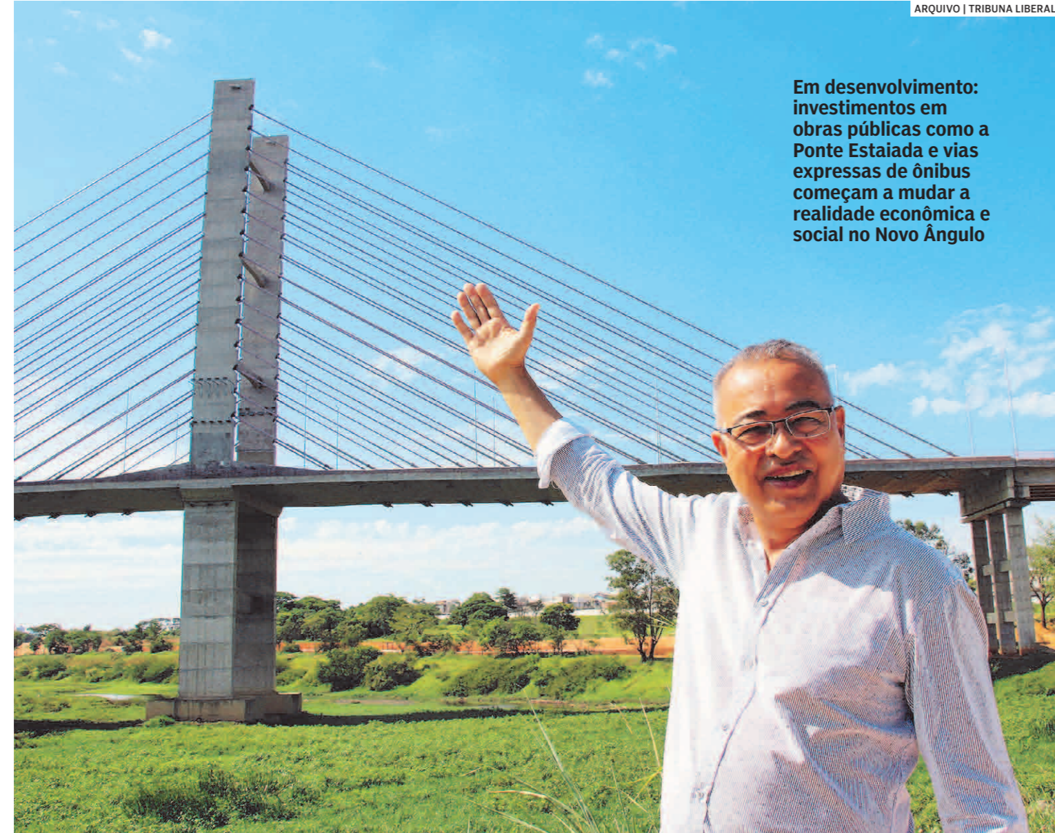
Em desenvolvimento: investimentos em obras públicas como a Ponte Estaiada e vias expressas de ônibus começam a mudar a realidade econômica e social no Novo Ângulo

O novo Paço Municipal será construído em uma área de 60 mil m², propriedade da Prefeitura, na Avenida Sabina Batista de Camargo, antiga Estrada da Granja, localizada às margens do Corredor Metropolitano, próximo à Ponte Estaiada. De acordo com a Secretaria de Planejamento Urbano e Gestão Estratégica, o prédio terá 10 mil m² de área construída, espaço suficiente para abrigar todas as secretarias de governo, departamentos e órgãos de atendimento ao público que, atualmente, funcionam em prédios alugados. Cerca de 2 mil servidores trabalharão no local. A metragem rema-