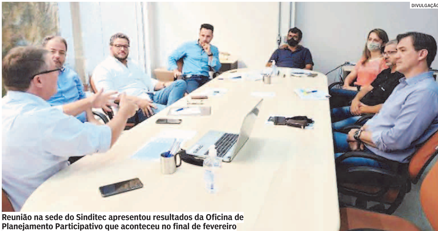
Reunião na sede do Sinditec apresentou resultados da Oficina de Planejamento Participativo que aconteceu no final de fevereiro

Estiveram presentes na reunião o presiden-