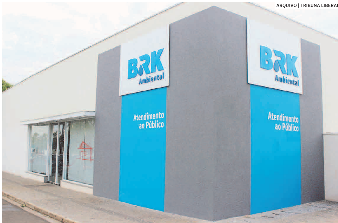
Até 30 de abril, clientes que realizarem o pagamento da primeira conta da BRK pelo PicPay, com cartão de crédito cadastrado no app, recebem até 40% de cashback

“A BRK tem o compromisso de otimizar e facilitar a vida dos clientes por meio de grandes parcerias. A plataforma, além de favorecer o cliente, permite que o cashback recebido seja utilizado no pagamento da próxima fatura ou em outras utilidades do apli-