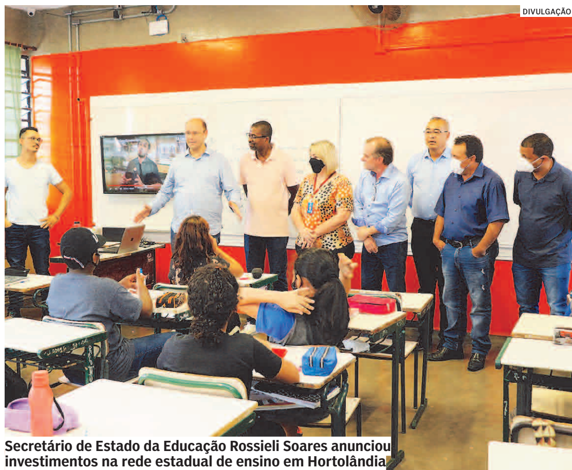
Secretário de Estado da Educação Rossieli Soares anunciou investimentos na rede estadual de ensino em Hortolândia.

Ao lado do prefeito Zezé Gomes, Secretário de Estado da Educação anunciou construção de escolas, adequações no sistema elétrico de escolas e construção de duas quadras