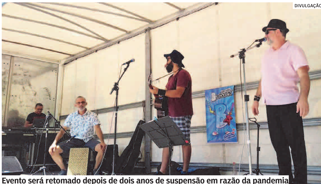
Evento será retomado depois de dois anos de suspensão em razão da pandemia

A entrada é gratuita. Como opções de alimentação, haverá barracas de espetinho, chope, hot dog, pastel e alimentação vegetariana e vegana. Feiras alternativas e de artesanato também farão parte do evento, que trará uma variedade de opções em suas barracas.