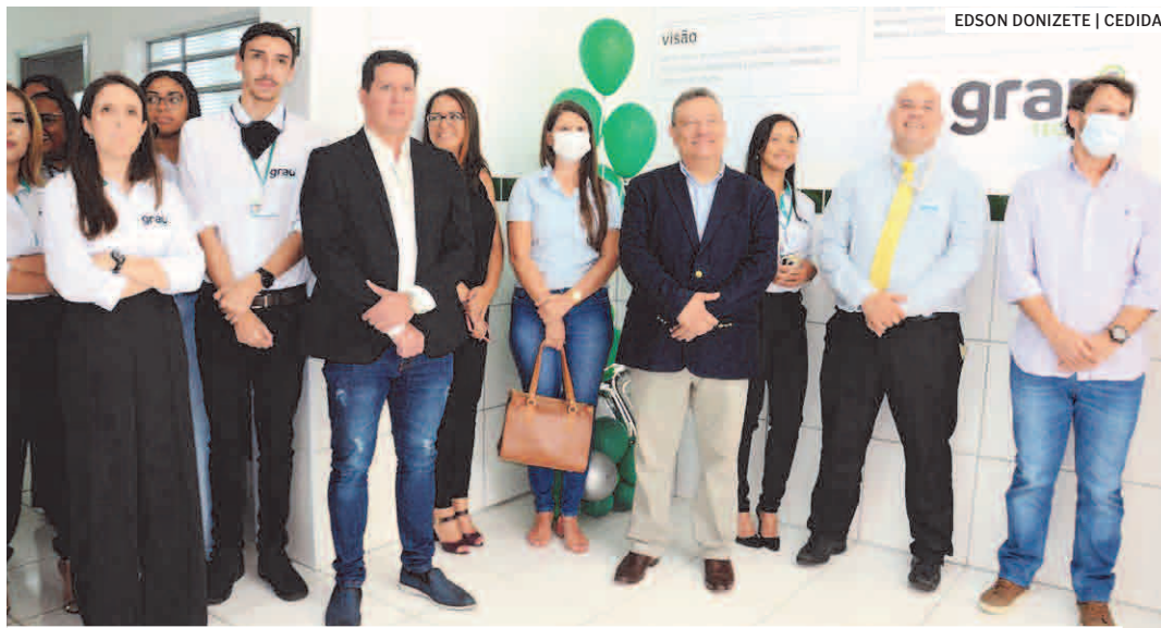
Solenidade realizada na sexta-feira marcou a inauguração da unidade de Sumaré

O Grau Técnico, uma das maiores redes de ensino técnico do Brasil, inaugurou sua primeira unidade em Sumaré, nesta sexta-feira (25). A solenidade de inauguração reuniu empresários, representantes da prefeitura e da Acias (Associação Comercial, Industrial e Agropecuária de Sumaré). A nova unidade recebeu mais de R$ 2 milhões em investimentos. PÁGINA 03