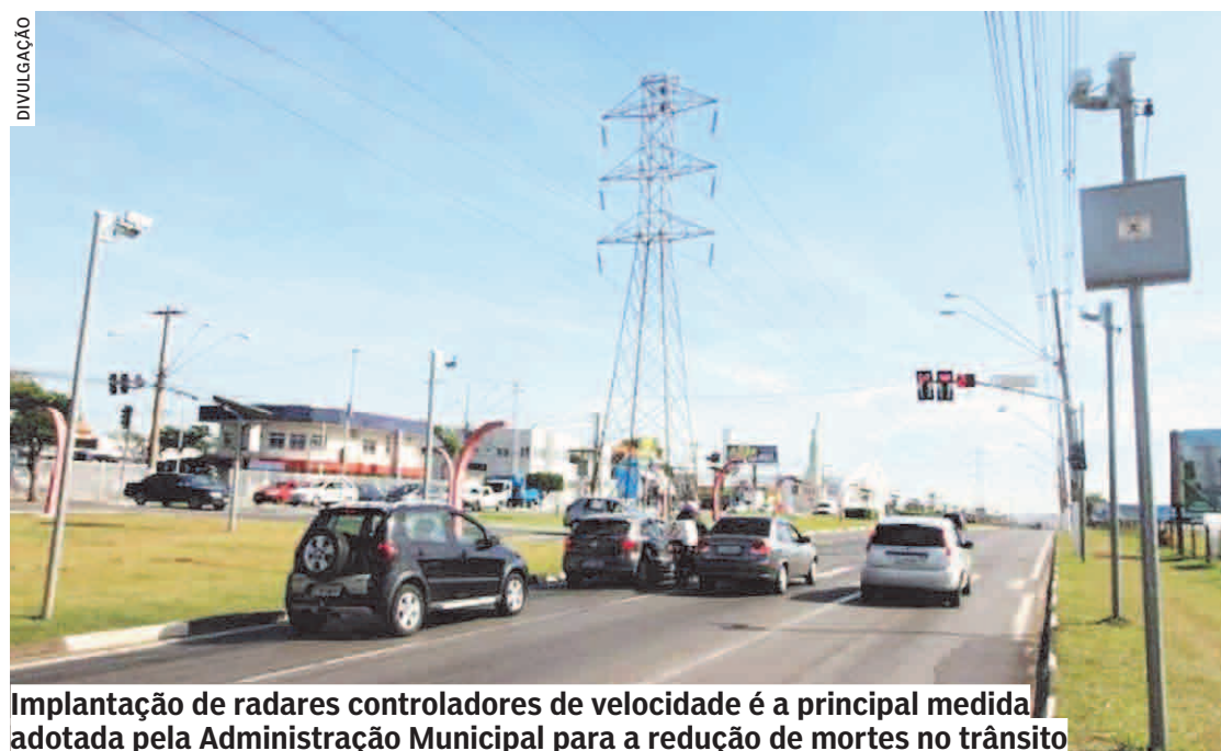
Implantação de radares controladores de velocidade é a principal medida adotada pela Administração Municipal para a redução de mortes no trânsito

Ações da Prefeitura, desde 2017, têm contribuído para queda nos números de acidentes nas ruas e avenidas