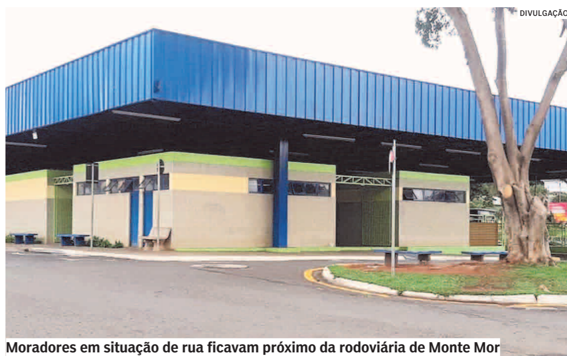
Moradores em situação de rua ficavam próximo da rodoviária de Monte Mor

“Eu vou mostrar como se governa uma cidade. Fiquem bravo comigo. Podem ficar, mas agora tem prefeito nessa cidade”, disse Brischi, durante a transmissão. No vídeo, o prefeito afirma que mandou fazer seis viagens transportando os sem-teto. Citou as cidades de Rio das Pedras, Bauriv, Campinas, São Paulo e Orquideas. Disse ainda que no dia seguinte haveria mais duas viagens -para Itararé e São Rafael. “Preciso cuidar da minha cidade. Pessoas do bem me ajudem! Me apoiem! Tem muita gente metendo o lóco (sic) no Edivaldo. O lóco (sic) no prefeito. Só