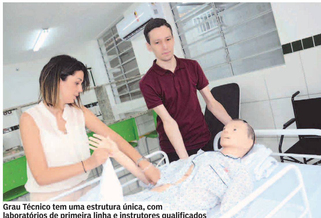
Grau Técnico tem uma estrutura única, com laboratórios de primeira linha e instrutores qualificados

Mais informações nos sites www.grautecnico.com.br e www.graup.com.br