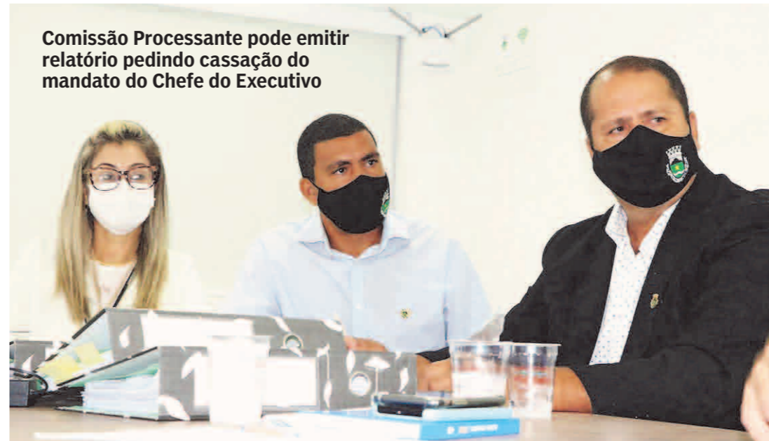
Comissão Processante pode emitir relatório pedindo cassação do mandato do Chefe do Executivo