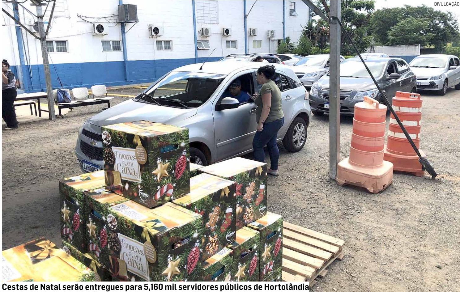
Cestas de Natal serão entregues para 5,160 mil servidores públicos de Hortolândia

Depois de realizar o login, o servidor público de-