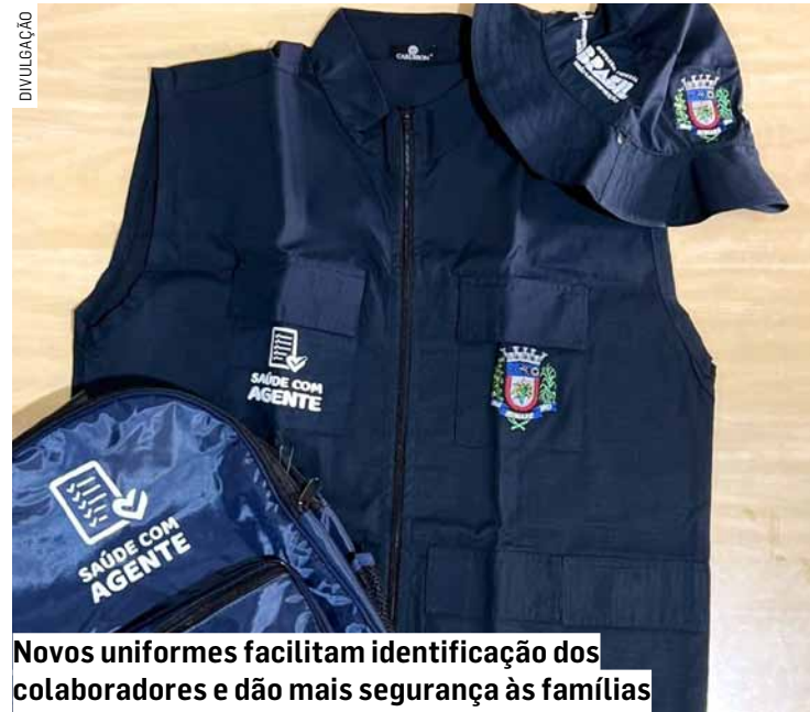
Novos uniformes facilitam identificação dos colaboradores e dão mais segurança às famílias

Da Redação • SUMARÉ tribunaliberal@tribunaliberal.com.br