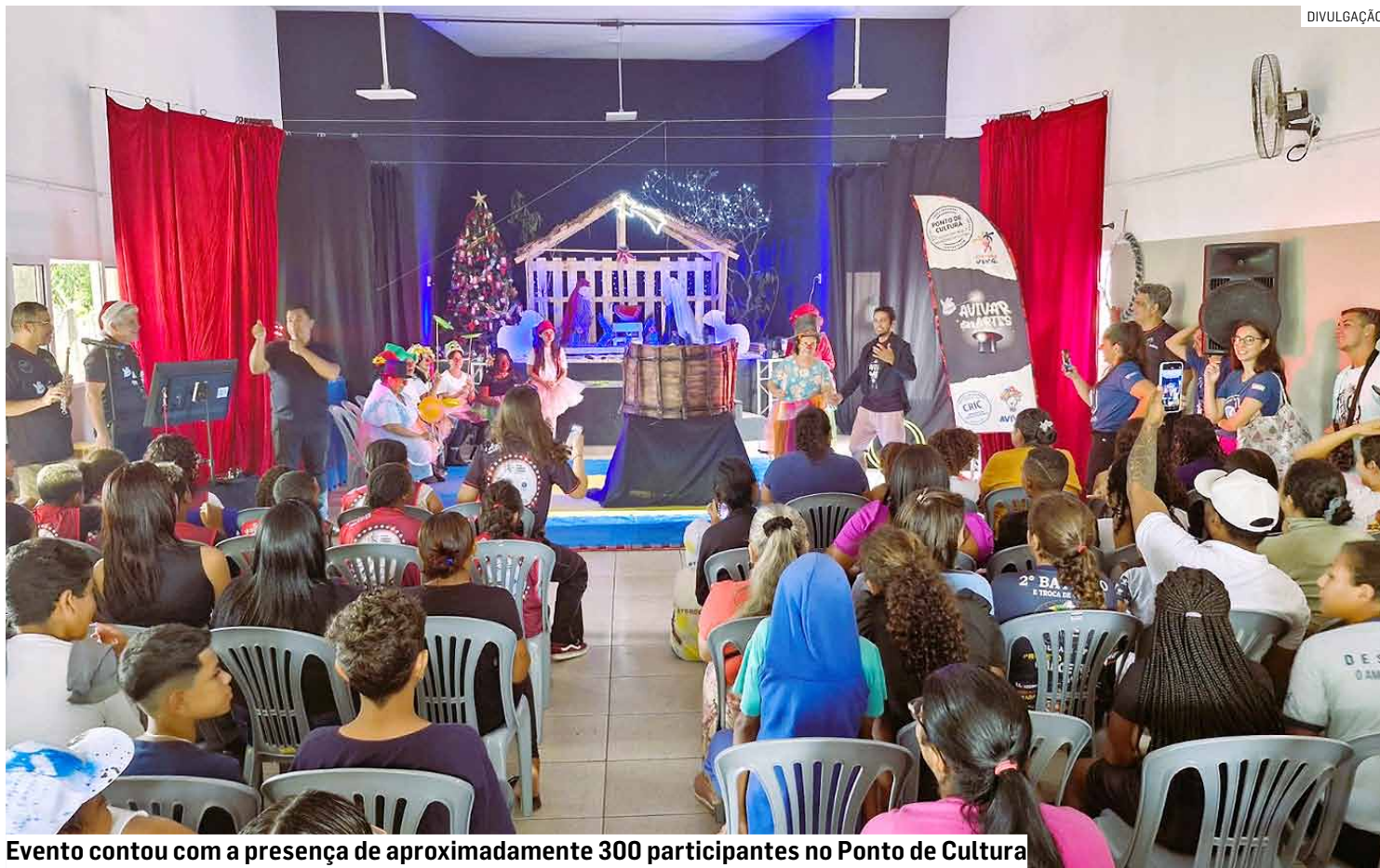
Evento contou com a presença de aproximadamente 300 participantes no Ponto de Cultura

Já passava das 12h quando o evento foi encerrado e a plateia saiu novamente encantada após ter a oportu-