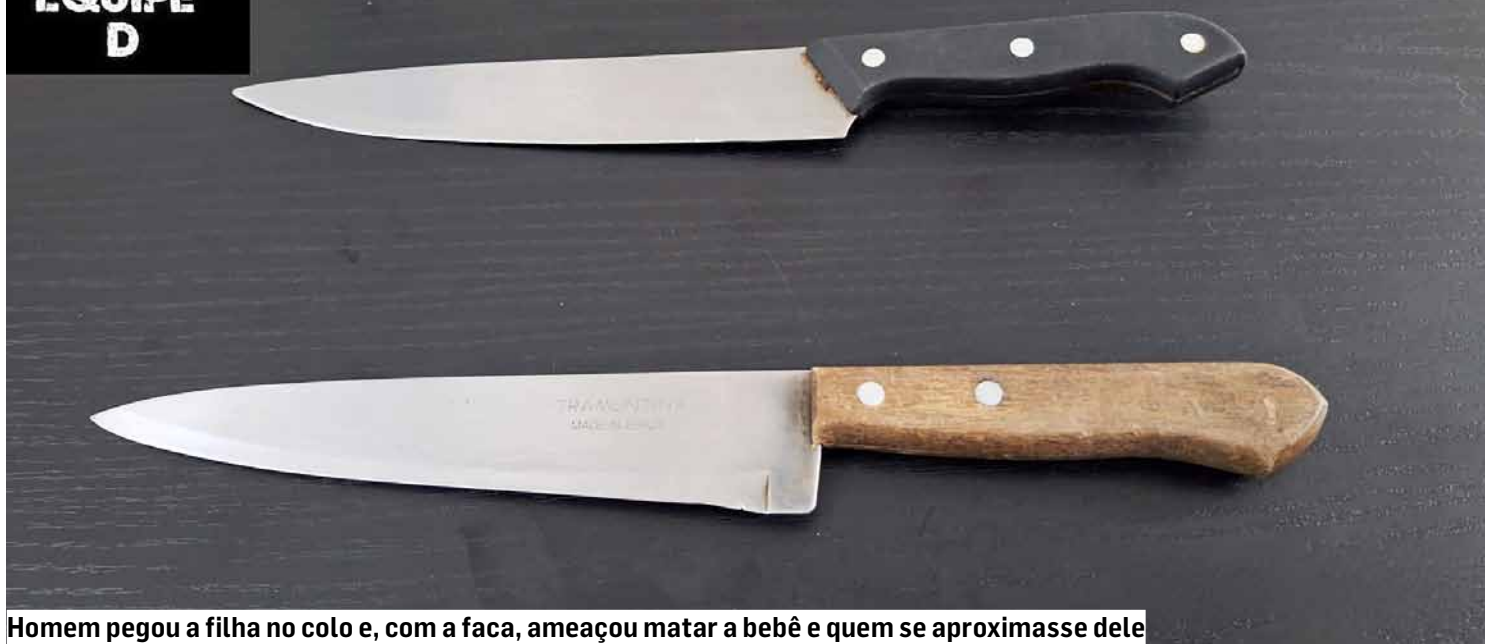
Homem pegou a filha no colo e, com a faca, ameaçou matar a bebê e quem se aproximasse dele