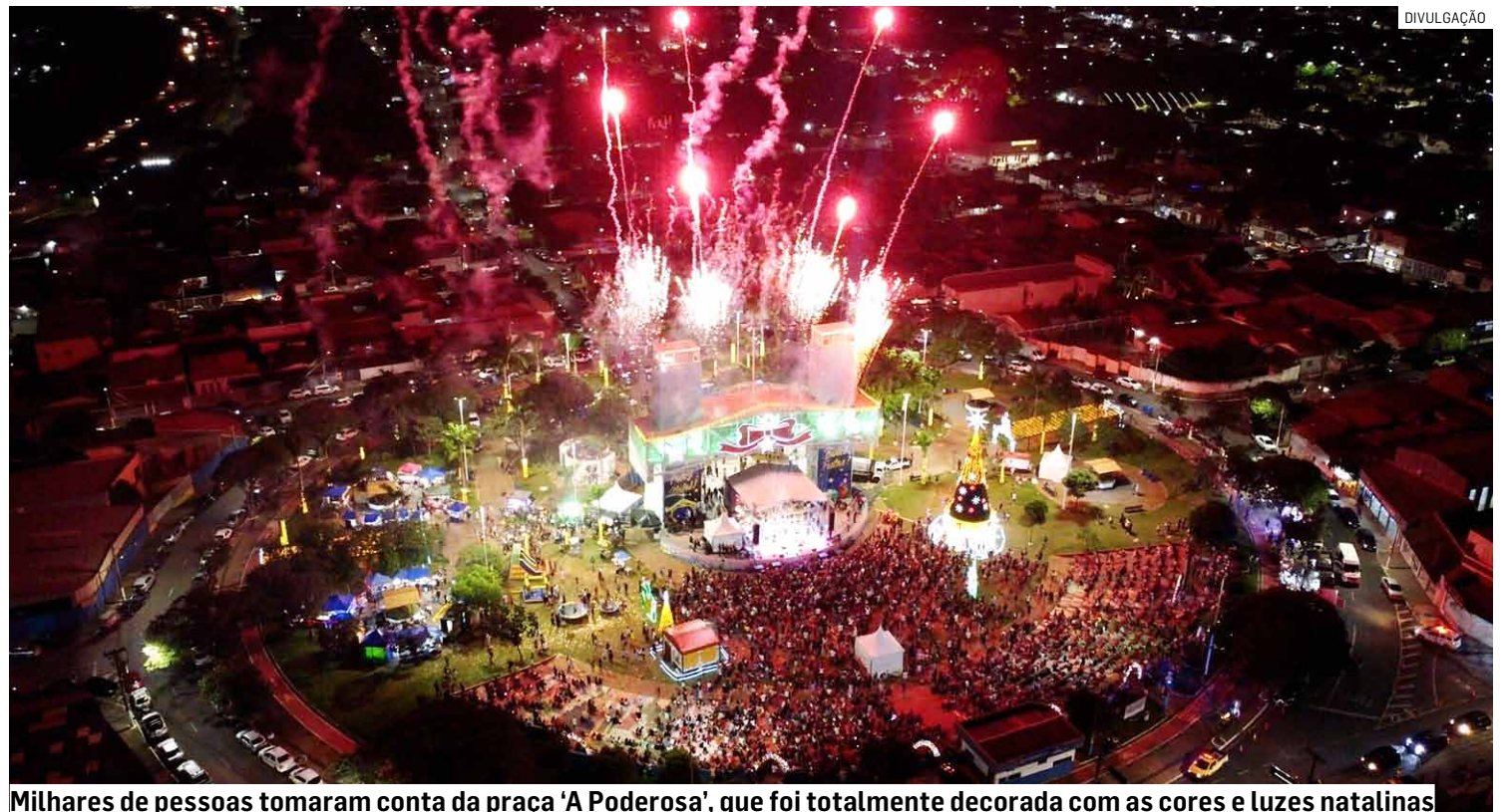
Milhares de pessoas tomaram conta da praça 'A Poderosa', que foi totalmente decorada com as cores e luzes natalinas

Uma das crianças que se surpreendeu com a aparição mágica do Papai Noel