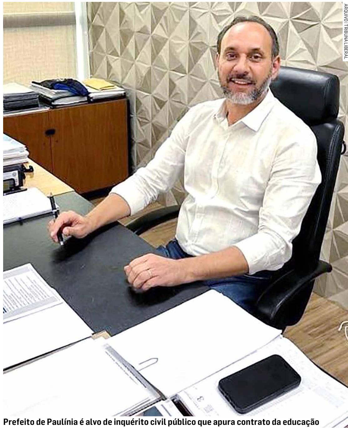
Prefeito de Paulínia é alvo de inquérito civil público que apura contrato da educação

Procurada para comentar a investigação, a Prefeitura de Paulínia informou que as alegações feitas pelo denunciante são infundadas. "Todos os esclarecimentos necessários já foram devidamente prestados ao Ministério Público, reforçando o compromisso da administração com a legalidade e a transparência na gestão pública", disse, por meio de nota.