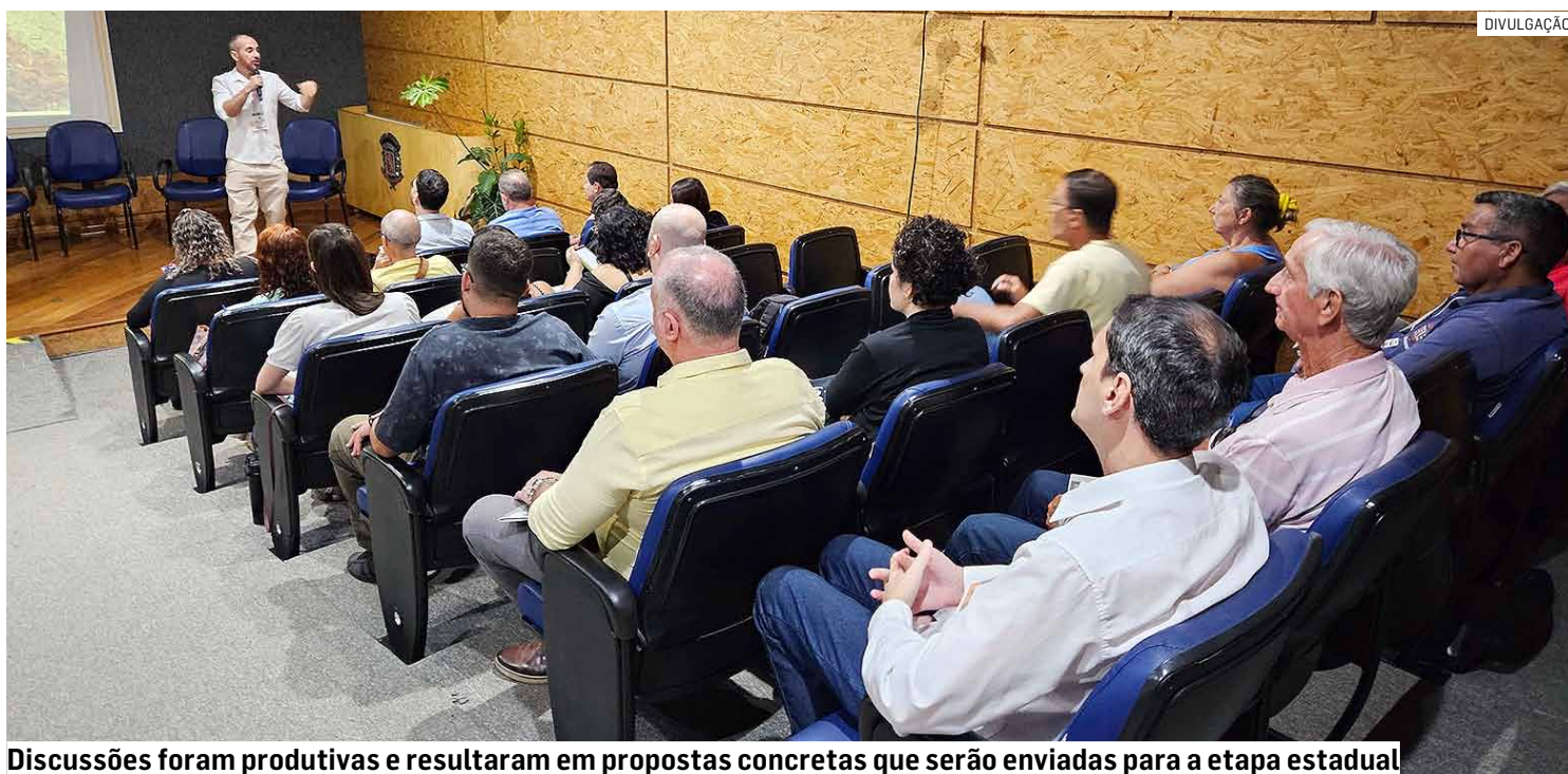
Discussões foram produtivas e resultaram em propostas concretas que serão enviadas para a etapa estadual

Iniciativa busca ampliar a cobertura vegetal e promover um ambiente mais saudável e sustentável, incluindo a diminuição das temperaturas no meio urbano