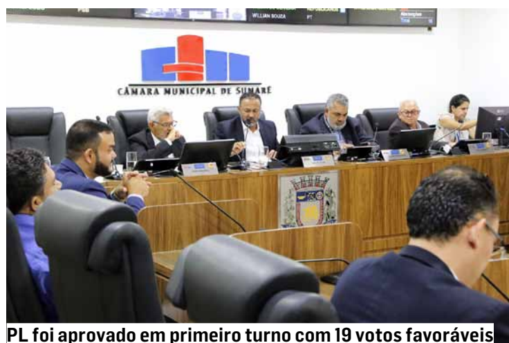
PL foi aprovado em primeiro turno com 19 votos favoráveis

Na última sessão ordinária do ano, os vereadores de Sumaré votam, em segundo turno, a LOA (Lei Orçamentária Anual) para 2025. O projeto de lei de autoria do prefeito Luiz Dalben (PSD) prevê uma receita líquida no valor de R$ 1,499 bilhão para o próximo ano. O PL foi aprovado em primeiro turno com 19 votos favoráveis. A sessão da Câmara Municipal