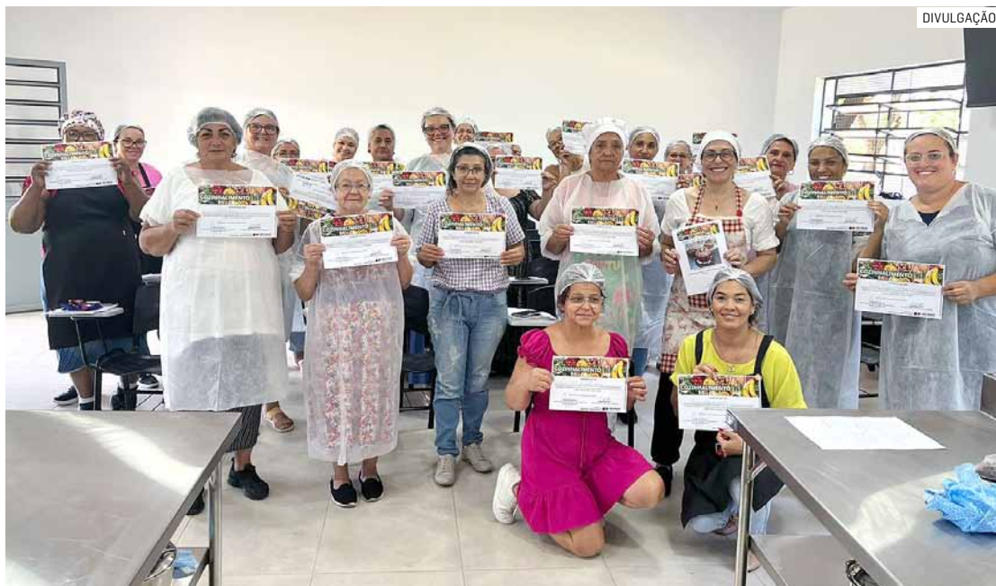
Participantes receberam certificados do curso, além de apostila e um livro com as receitas

Da Redação • NOVA ODESSA tribunaliberal@tribunaliberal.com.br