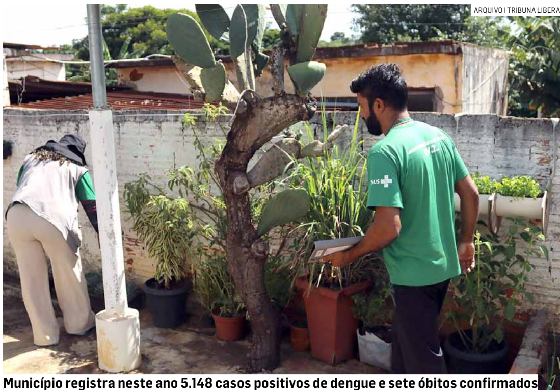
Município registra neste ano 5.148 casos positivos de dengue e sete óbitos confirmados

A ADL consiste em fazer a contagem da quantidade de larvas do Aedes aegypti encontradas nas casas