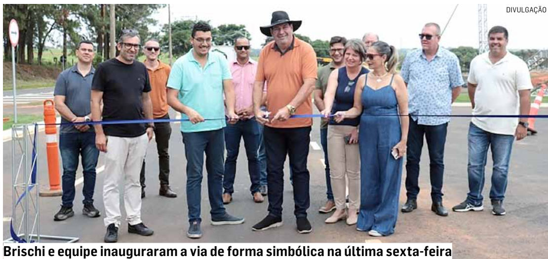
Brischi e equipe inauguraram a via de forma simbólica na última sexta-feira

Da Redação • MONTE MOR tribunaliberal@tribunaliberal.com.br