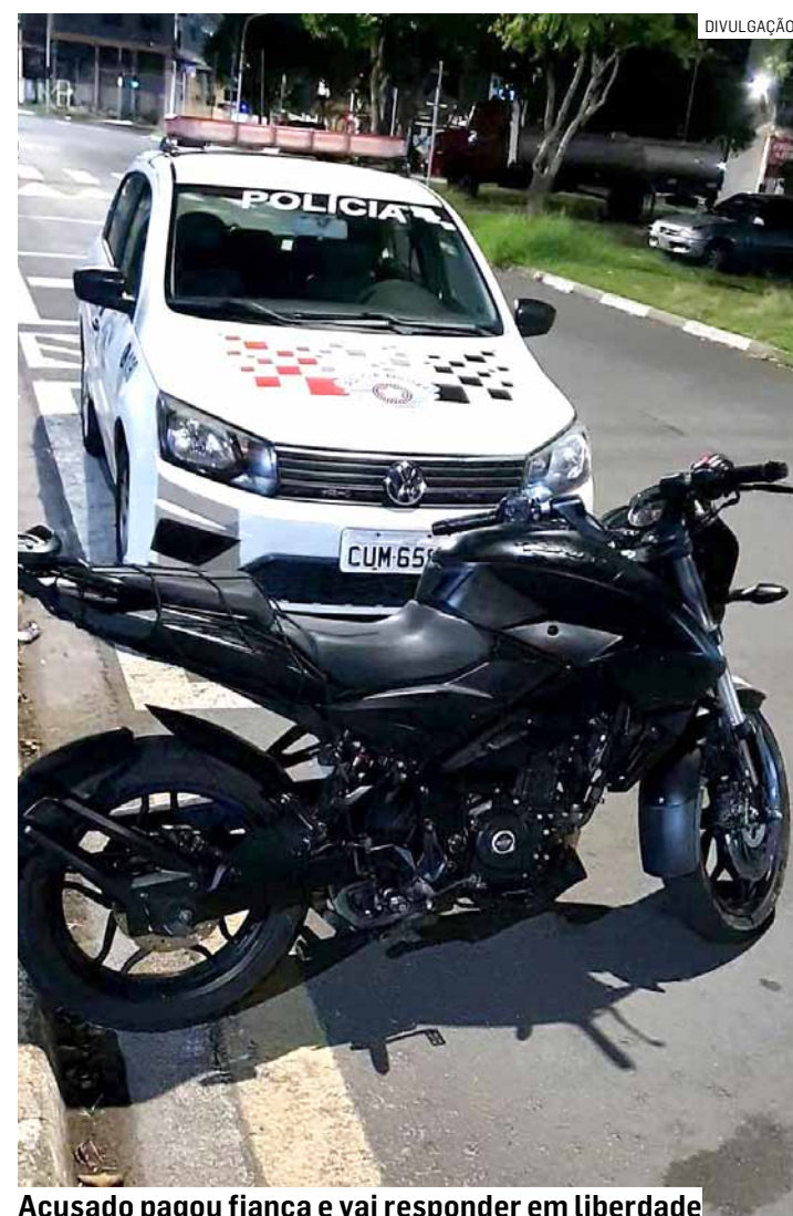
Acusado pagou fiança e vai responder em liberdade

O acusado e a moto foram conduzidos ao Plantão Policial de Hortolândia. O delegado registrou boletim de ocorrência de receptação e arbitrou fiança de um salário mínimo (R$1,412 mil), que foi pago por familiares do detido. O vai responder ao processo em liberdade.