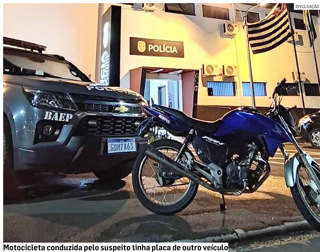
Motocicleta conduzida pelo suspeito tinha placa de outro veículo