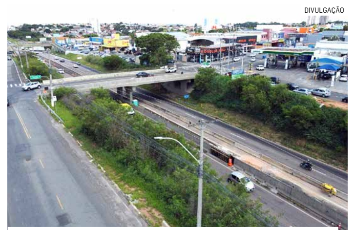
Alternativa para os motoristas é o uso da pista marginal

Das 21h de terça-feira até às 5h da quarta-feira (18), o bloqueio do tráfego será no sentido Monte Mor da rodovia e o desvio do tráfego acontecerá para a rua Waldiva Fernandes Duarte da Silva. Agentes de trânsito estarão no local da operação para contribuir com a orientação aos motoristas. A ação deve durar durante toda a semana.