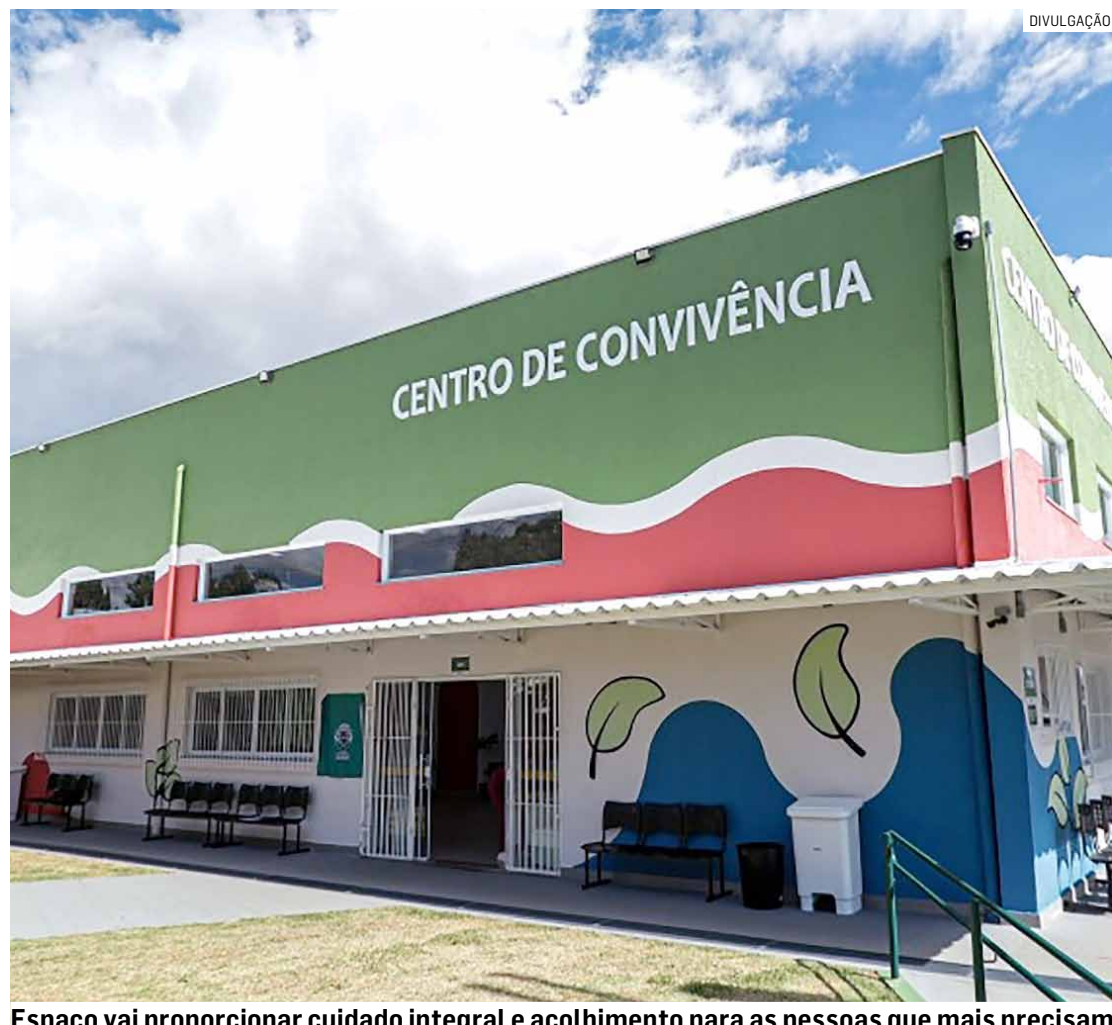
Espaço vai proporcionar cuidado integral e acolhimento para as pessoas que mais precisam

Localizado à rua Jaime Ramos dos Santos, 22, no Jardim Nossa Senhora Aparecida, o Centro de Convivência da Saúde funcionará de segunda a sexta-feira, das 7h às 19h.