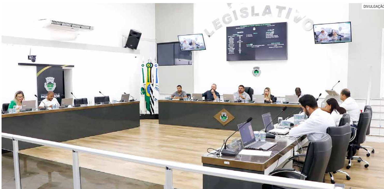
Vereadores também aprovaram emenda modificativa ao projeto, que prevê limite de 25% para créditos suplementares

Da Redação • MONTE MOR tribunaliberal@tribunaliberal.com.br