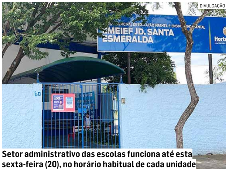
Setor administrativo das escolas funciona até esta sexta-feira (20), no horário habitual de cada unidade

O Samu pode ser acionado pelo número 192. Unidades especializadas, como o CAISM (Centro de Atenção Integral à Saúde da Mulher), o CEM (Centro de Especialidades Médicas), o CEI (Centro Especializado de Infectologia), o Centro de Especialidades Odontológicas e o Centro de Reabilitação Física Mônica Cristina Blanco, também terão operação regular. Além disso, a UVZ (Uni-