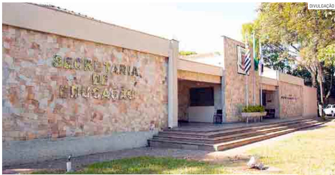
Secretaria da Educação de Nova Odessa realizará o evento na quinta e sexta-feira

Atualmente, a Rede Municipal de Ensino de Nova Odessa possui 25 unidades, entre creches, pré-escolas e escolas de Ensino Fundamental I. E conta com 55 diretores e especialistas, 400 professores, 200 integrantes nas equipes de apoio, atendendo cerca de 5,6 mil alunos.