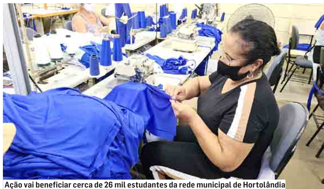
Ação vai beneficiar cerca de 26 mil estudantes da rede municipal de Hortolândia

A confecção dos itens que compõem os kits de uniformes escolares de inverno entra na reta final. São produzidas, atualmente, 55.417 peças