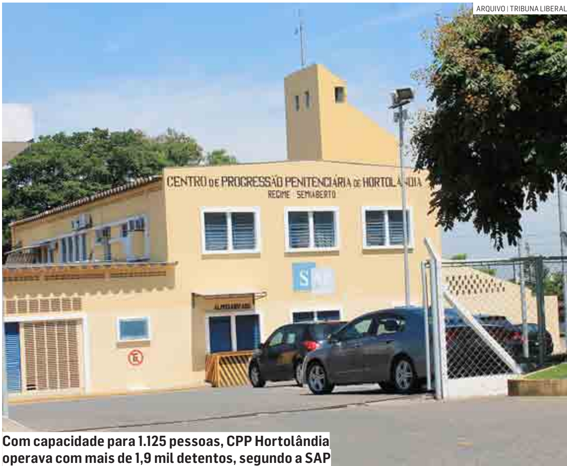
Com capacidade para 1.125 pessoas, CPP Hortolândia operava com mais de 1,9 mil detentos, segundo a SAP