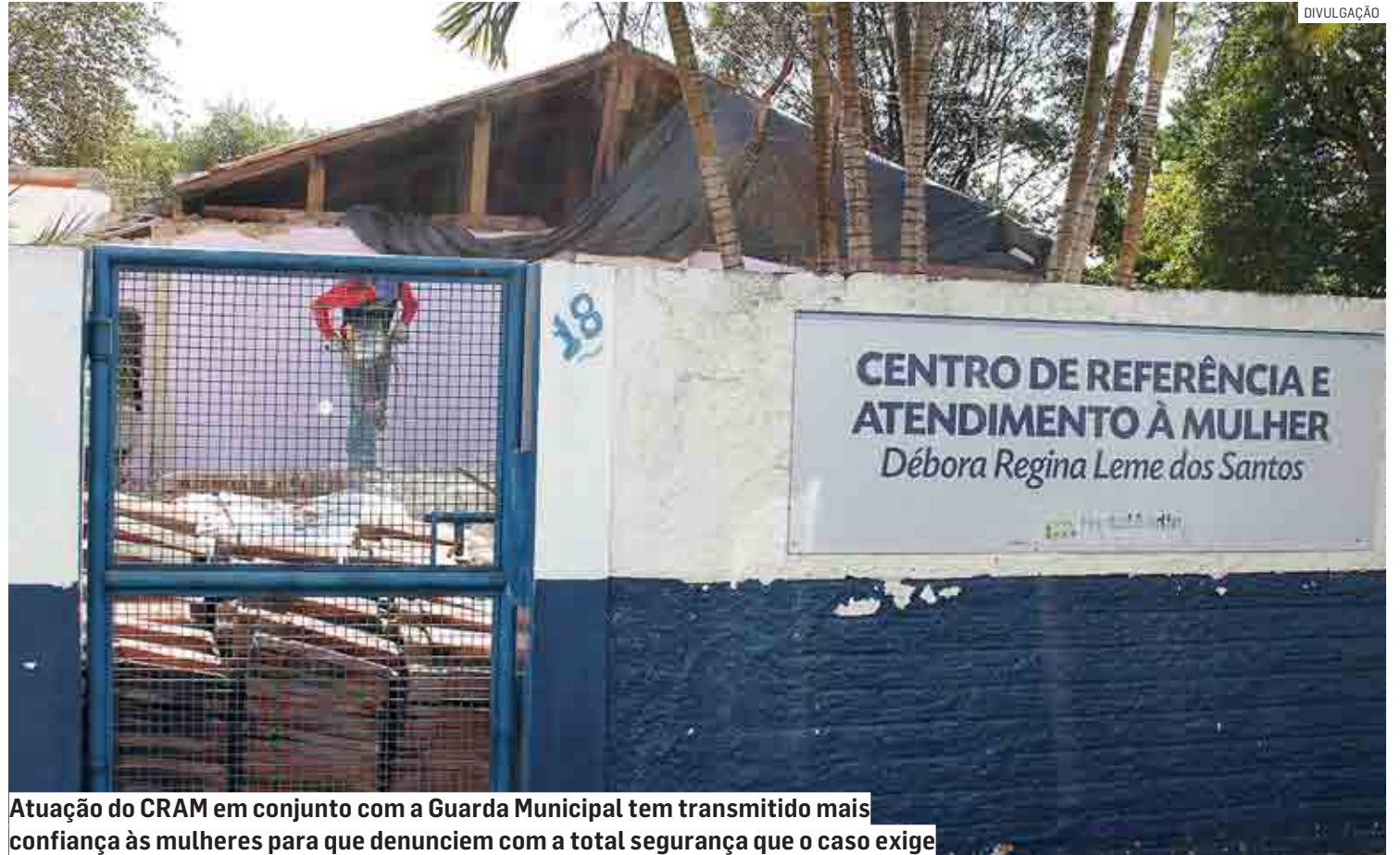
Atuação do CRAM em conjunto com a Guarda Municipal tem transmitido mais confiança às mulheres para que denunciem com a total segurança que o caso exige

“Nos últimos anos houve a criação de novos canais de denúncia, peça importante para que as mulheres se sentissem confiantes para procurar as autoridades, denunciando o crime que estão sofrendo. Um bom exemplo destes novos canais de denúncia foi a implantação da delegacia eletrônica, uma vez que a mulher deixaria de passar pela exposição de ir até um balcão de distrito policial para relatar a violência sofrida. Outro ponto importante, em Hortolândia, vem sendo a atuação do CRAM, em conjunto com a Guarda Municipal, cujo trabalho se consolida ao longo dos anos e hoje transmite uma confiança a mais para as mulheres, para que possam denunciar com a total segurança que o caso exige. Outro ponto que merece ser destacado, é que