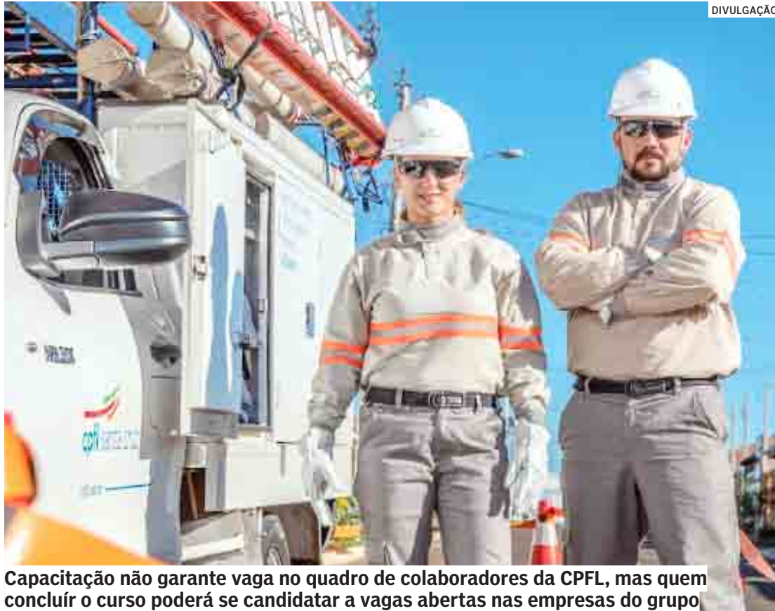
Capacitação não garante vaga no quadro de colaboradores da CPFL, mas quem concluir o curso poderá se candidatar a vagas abertas nas empresas do grupo.

Os interessados devem ter acima de 19 anos, ensino fundamental comple-