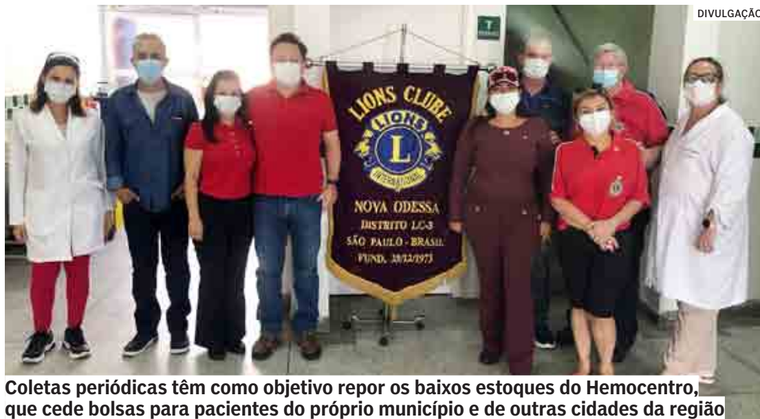
Coletas periódicas têm como objetivo repor os baixos estoques do Hemocentro, que cede bolsas para pacientes do próprio município e de outras cidades da região

As coletas periódicas têm como objetivo repor os baixos estoques do Hemocentro, que cede bolsas para os pacientes do próprio município e de outras cidades da região. Ou seja, todos os hospi-