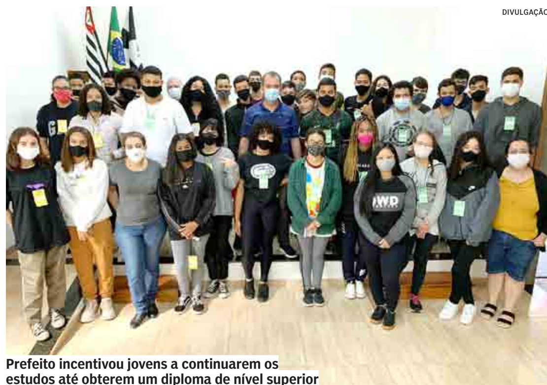
Prefeito incentivou jovens a continuarem os estudos até obterem um diploma de nível superior