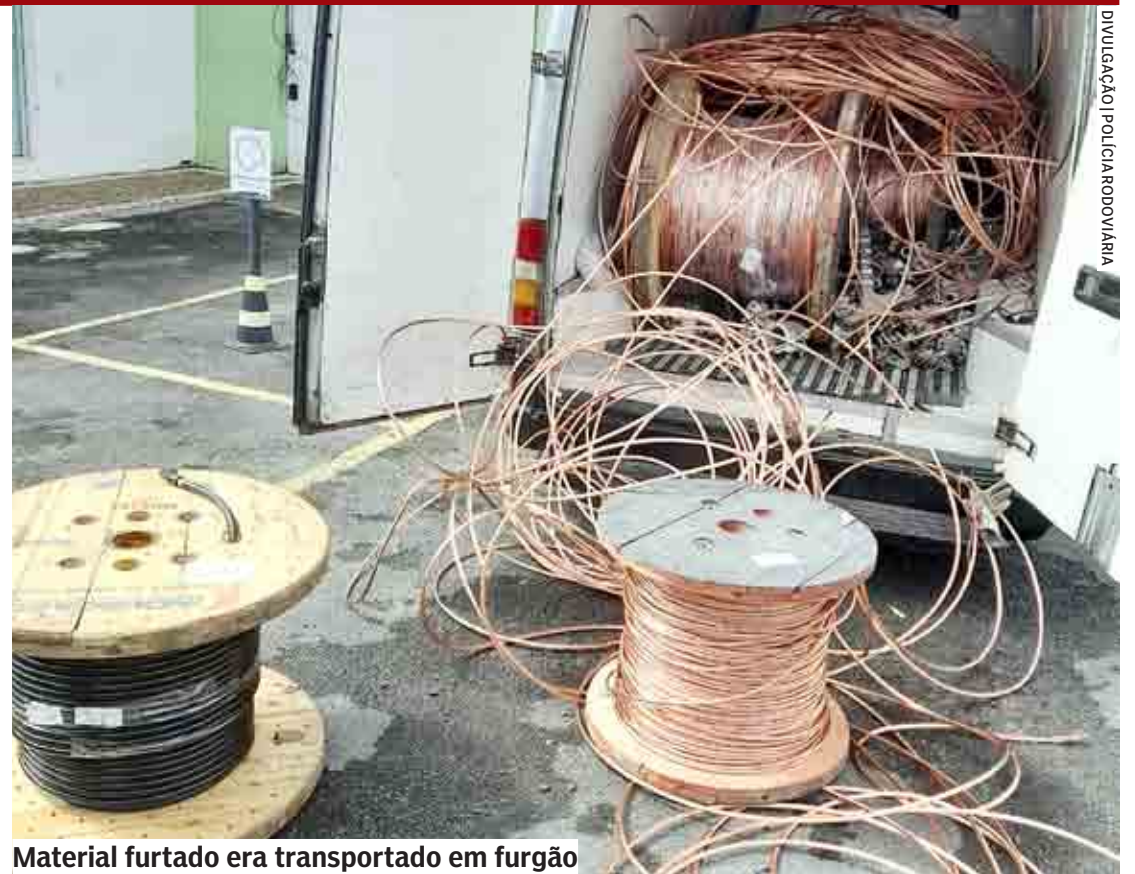
Material furtado era transportado em furgão

Segundo a Polícia Rodoviária, às 11h40, os policiais faziam patrulhamento, quando perceberam que um veículo MB/Sprinter de cor prata transitava com excesso de peso. Os policiais constataram que ele usava uniforme da empresa, mas o veículo não tinha qual-