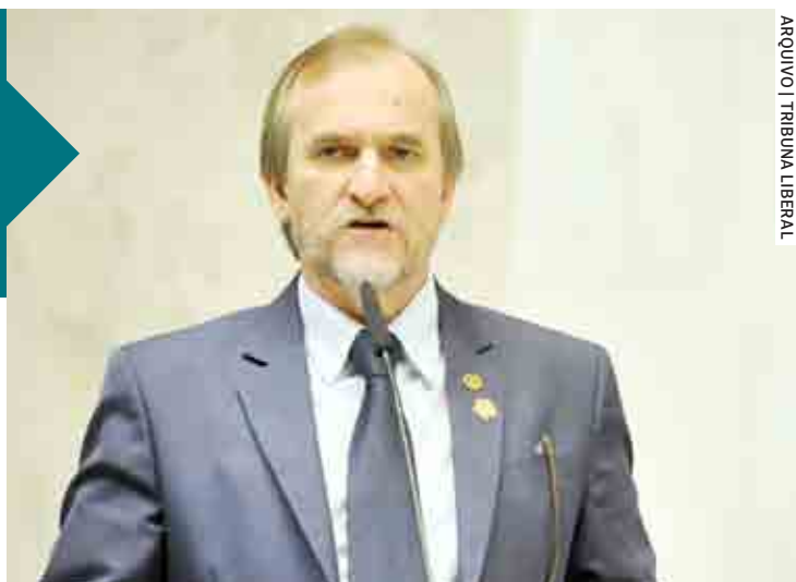
ARQUIVO | TRIBUNA LIBERAL

Dalben solicita intensificação de serviços sociais durante baixas temperaturas