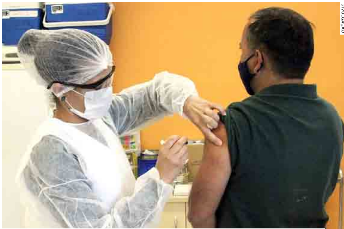
Serão vacinados nesta etapa caminhoneiros, trabalhadores do transporte coletivo, forças de segurança, funcionários do sistema prisional e pessoas privadas de liberdade

A Secretaria de Saúde ressalta que tem havido pouca procura pela vacina de pessoas com deficiência, de hipertensos e pessoas com diabetes. Em razão disso, a Secretaria de Saúde reforça para que esses públicos procurem a UBS mais próxima de sua re-