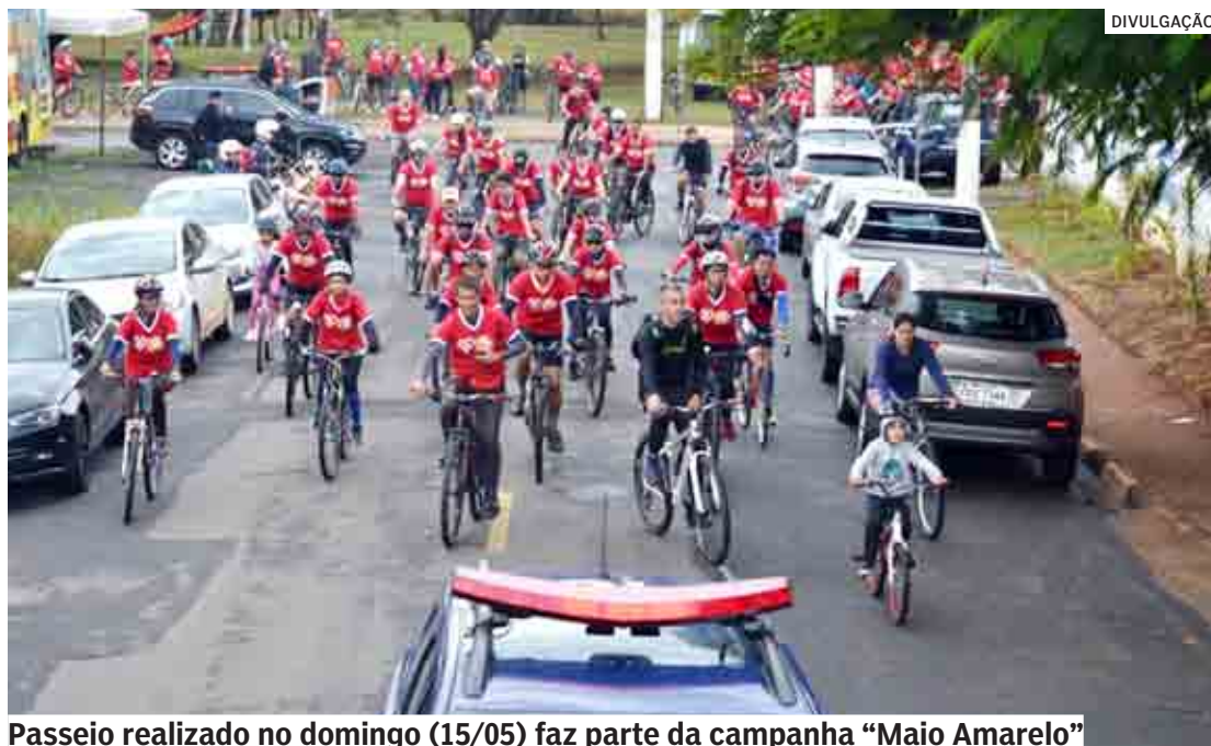
Passeio realizado no domingo (15/05) faz parte da campanha "Maio Amarelo"

"É muito importante ver este passeio com tantos ciclistas na manhã de um domingo. Vamos, cada dia mais, intensificar as ações para melhorar e