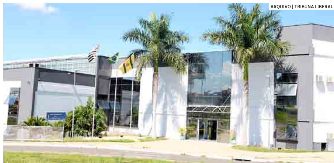
ARQUIVO | TRIBUNA LIBERAL

Por unanimidade, os vereadores de Hortolândia aprovaram o projeto de lei 75/2022, que reajusta os subsídios do prefeito em 42,94% dos atuais R$ 16.790,54 para R$ 24 mil. O mesmo projeto aumentou em 33,25% os vencimentos dos secretários municipais e do vice-prefeito.