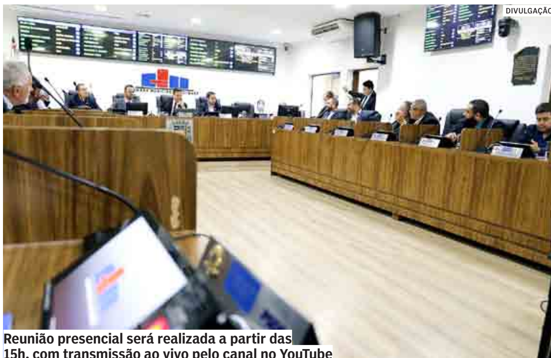
Reunião presencial será realizada a partir das 15h, com transmissão ao vivo pelo canal no YouTube