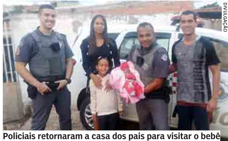
Policiais retornaram a casa dos pais para visitar o bebê

Cristiani Azanha | SUMARÉ cris@tribunaliberal.com.br