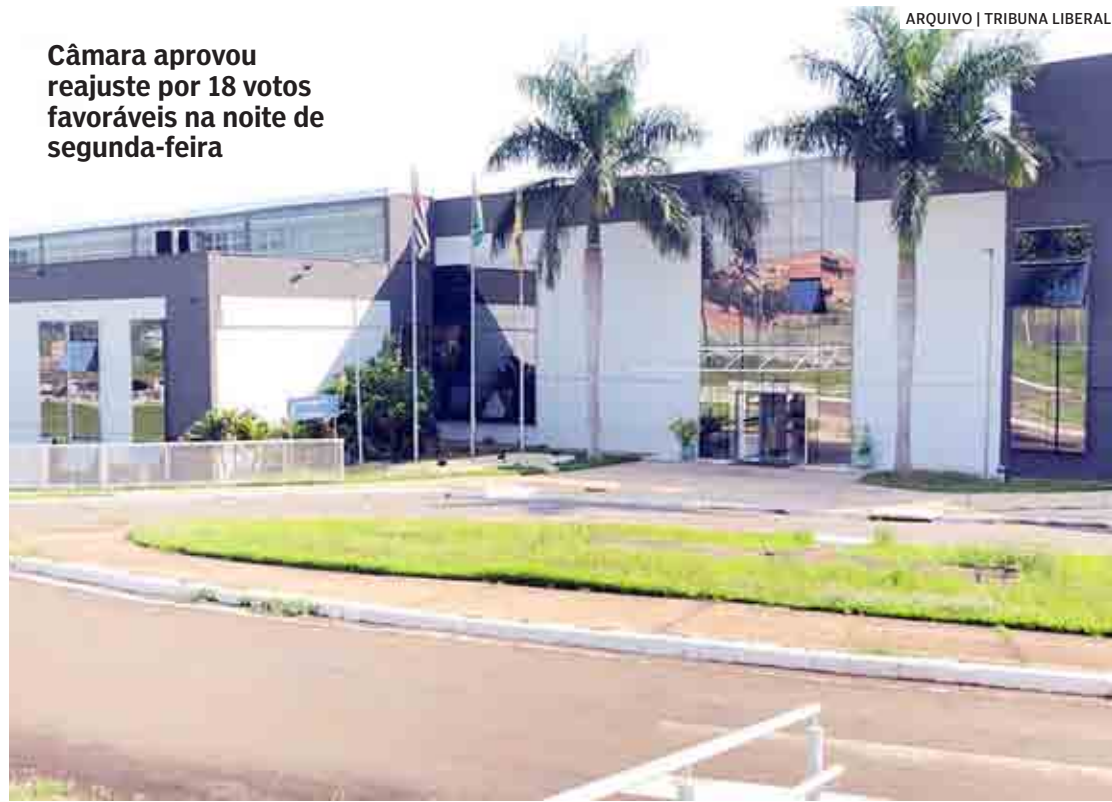
Câmara aprovou reajuste por 18 votos favoráveis na noite de segunda-feira