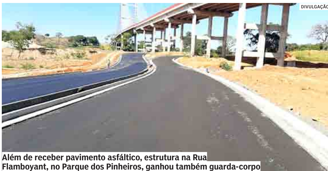
Além de receber pavimento asfáltico, estrutura na Rua Flamboyant, no Parque dos Pinheiros, ganhou também guarda-corpo

Nos canteiros de obras que ficam na Região Central, outras intervenções também estão em andamento nas imediações da Ponte da Esperança: a área de chácara ao lado da ponte da Vila Real passa por limpeza para, em breve, funcionar como saída para a nova via