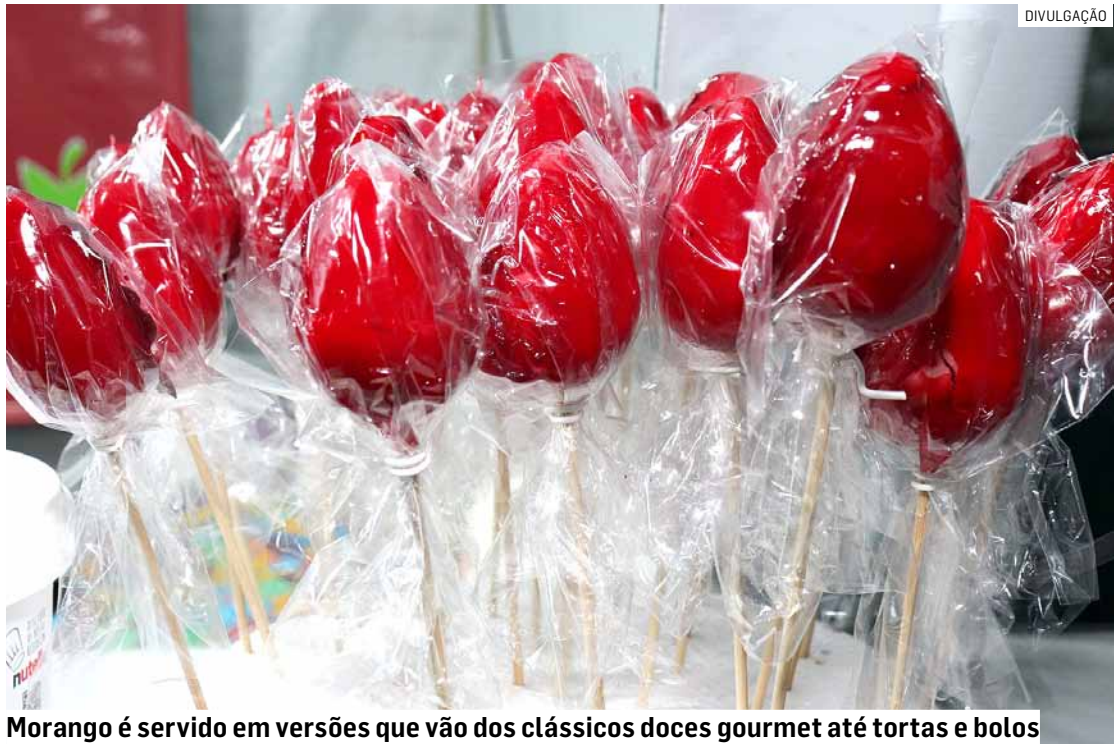
Morango é servido em versões que vão dos clássicos doces gourmet até tortas e bolos

Após o sucesso da primeira semana, o Festival do Morango, Burguer e Chopp continua em Hortolândia e promete transformar novamente o estacionamento do Shopping Hortolândia no ponto de encontro mais saboroso da região. O evento retorna de 16 a 19 de outubro (entre esta quinta-feira e domingo), com entrada gratuita, e traz uma novidade especial: a oportunidade de contribuir com doações de alimentos não perecíveis, que serão destinados ao Fundo Social de Solidariedade de Hortolândia, ajudando famílias em situação de vulnerabilidade no município. Na quinta e sexta, o evento começará às 17h e vai até 22h.