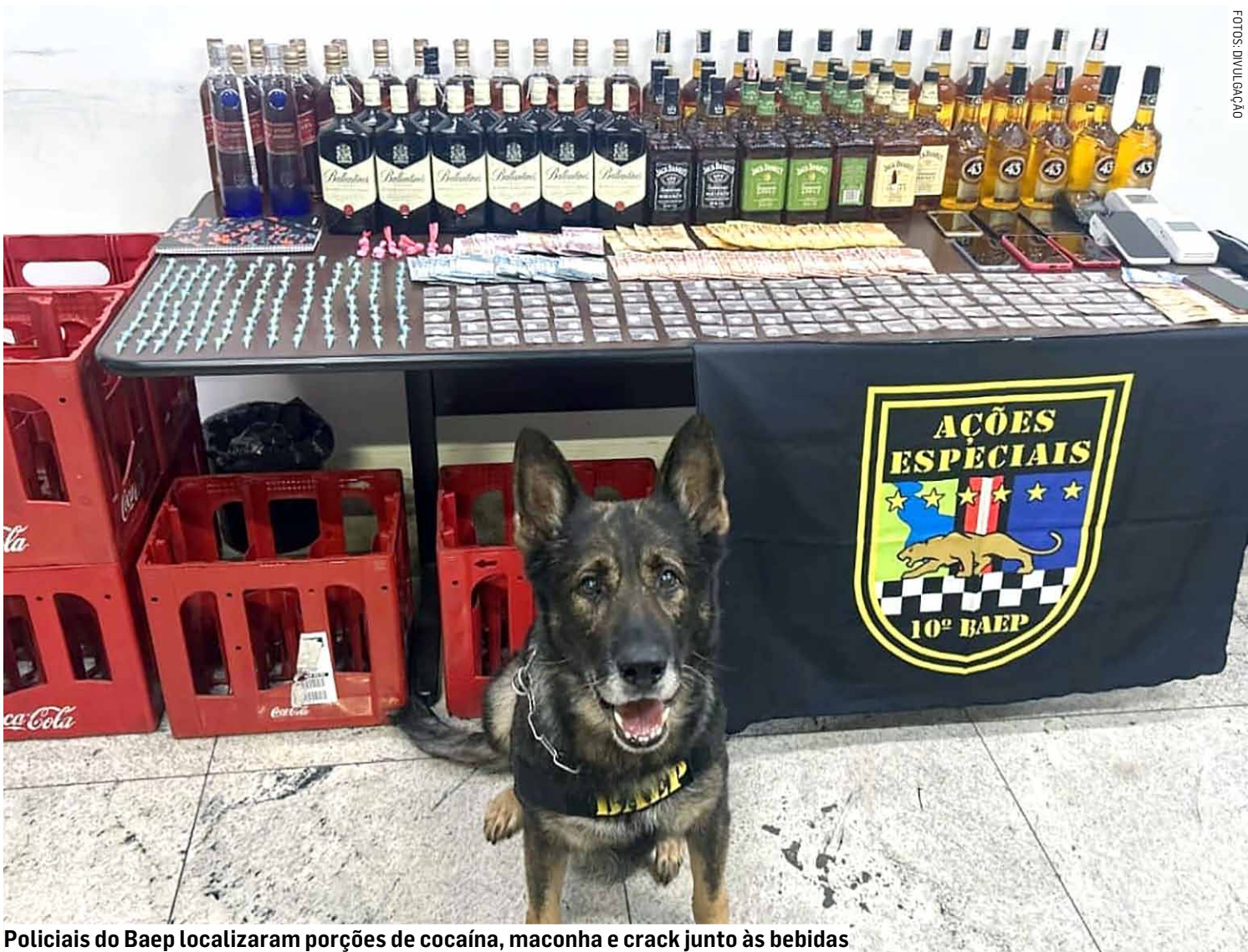
Policiais do Baep localizaram porções de cocaína, maconha e crack junto às bebidas

Policiais militares encontraram entorpecentes e bebidas irregulares no Parque São Jerônimo e três homens foram detidos após tentativa de fuga e de descarte de drogas; garrafas apresentavam lacres rompidos e líquido com cor alterada