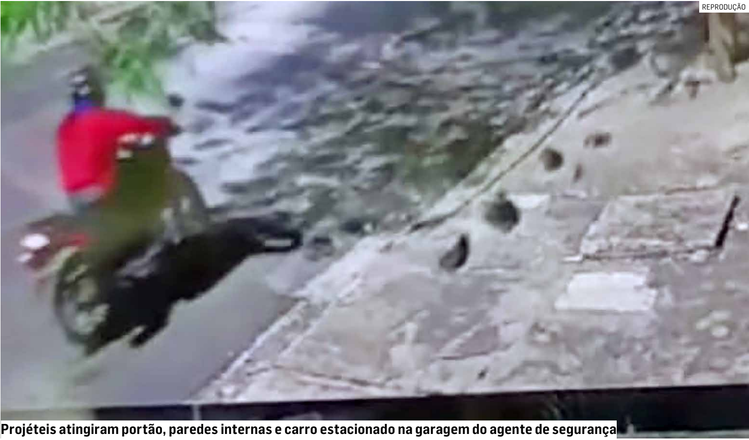
Projéteis atingiram portão, paredes internas e carro estacionado na garagem do agente de segurança

Polícia Civil apura possível retaliação do crime organizado contra apreensão de drogas na cidade; câmeras de segurança flagraram exato momento em que um motociclista parou em frente ao imóvel e efetuou vários disparos antes de fugir