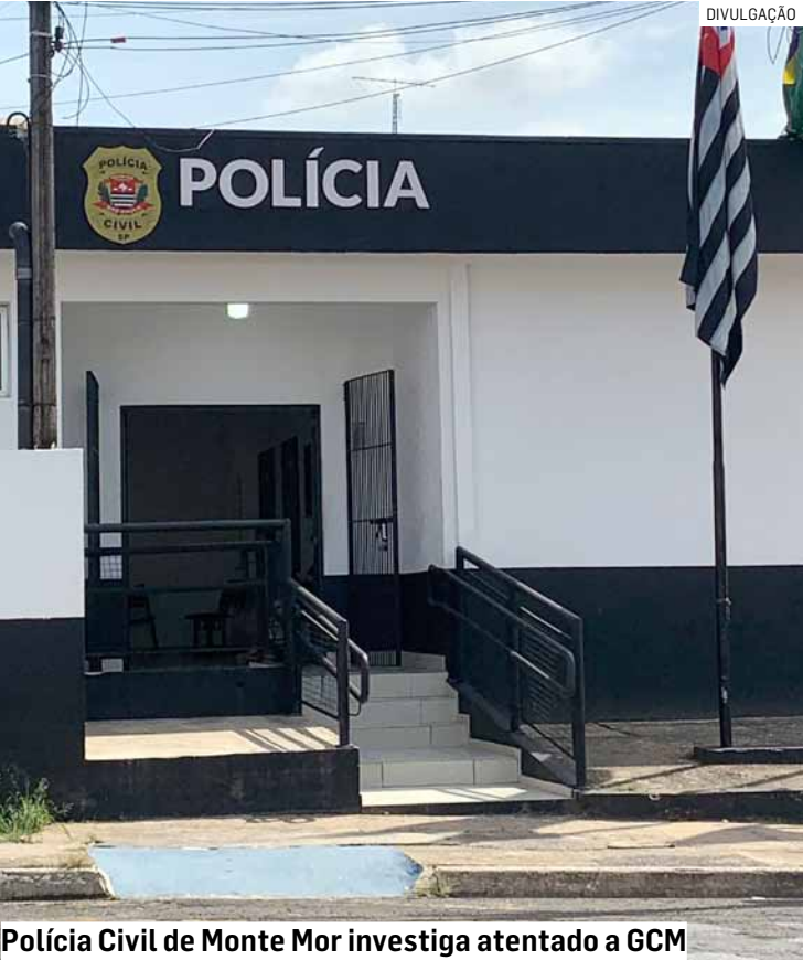
Polícia Civil de Monte Mor investiga atentado a GCM

do vários disparos contra o imóvel antes de fugir. Os projéteis atingiram o portão e as paredes da residência, além de danificar um veículo. A Polícia Civil investiga o caso como possível retaliação do crime organizado a recentes apreensões de drogas no município. PÁGINA 07