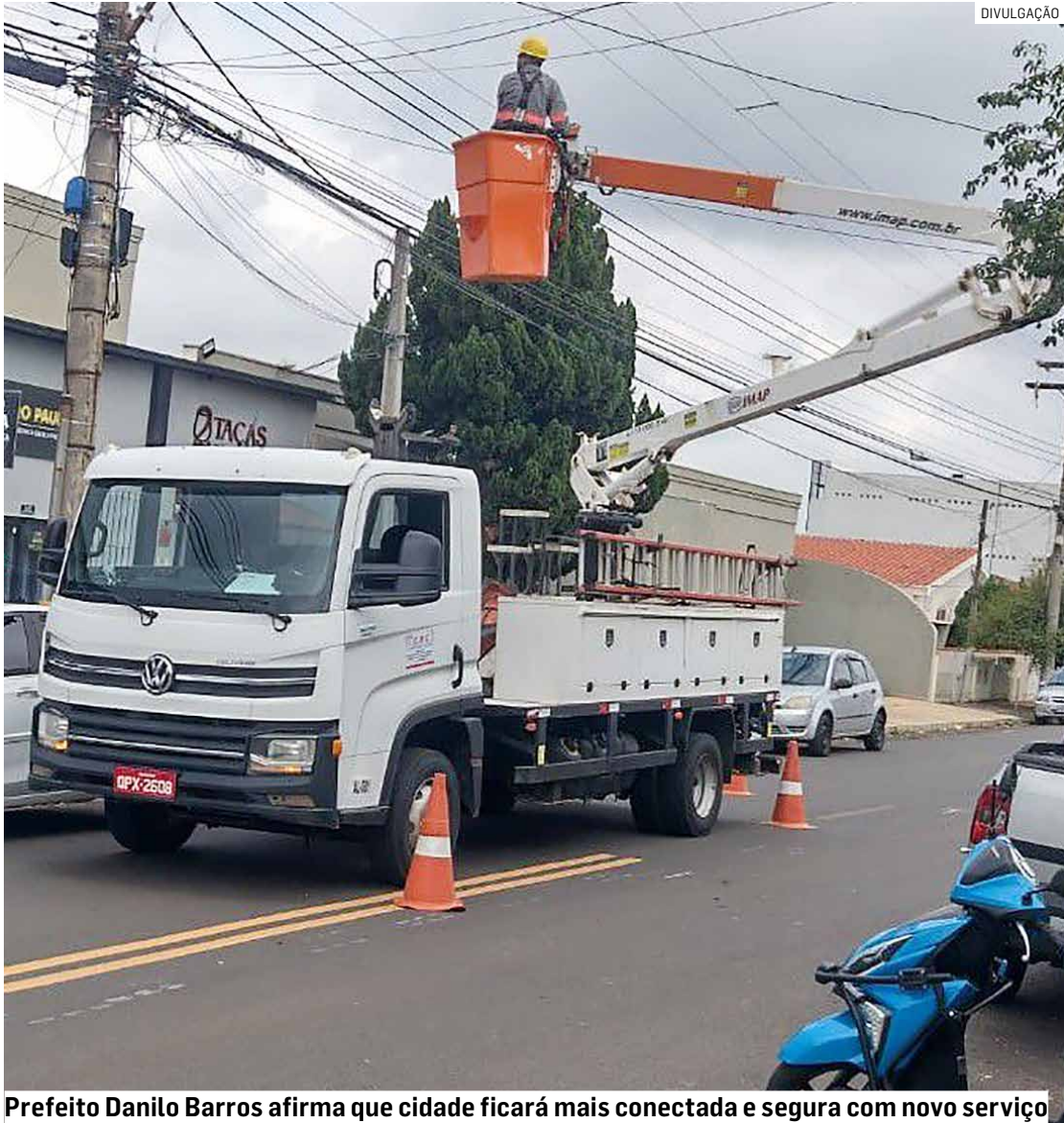
Prefeito Danilo Barros afirma que cidade ficará mais conectada e segura com novo serviço

Município disponibiliza ao cidadão número para solicitações de manutenção de lâmpadas em ruas e avenidas da cidade; pelo número 0800 276 5020, moradores podem informar problemas; medida vai gerar economia aos cofres públicos