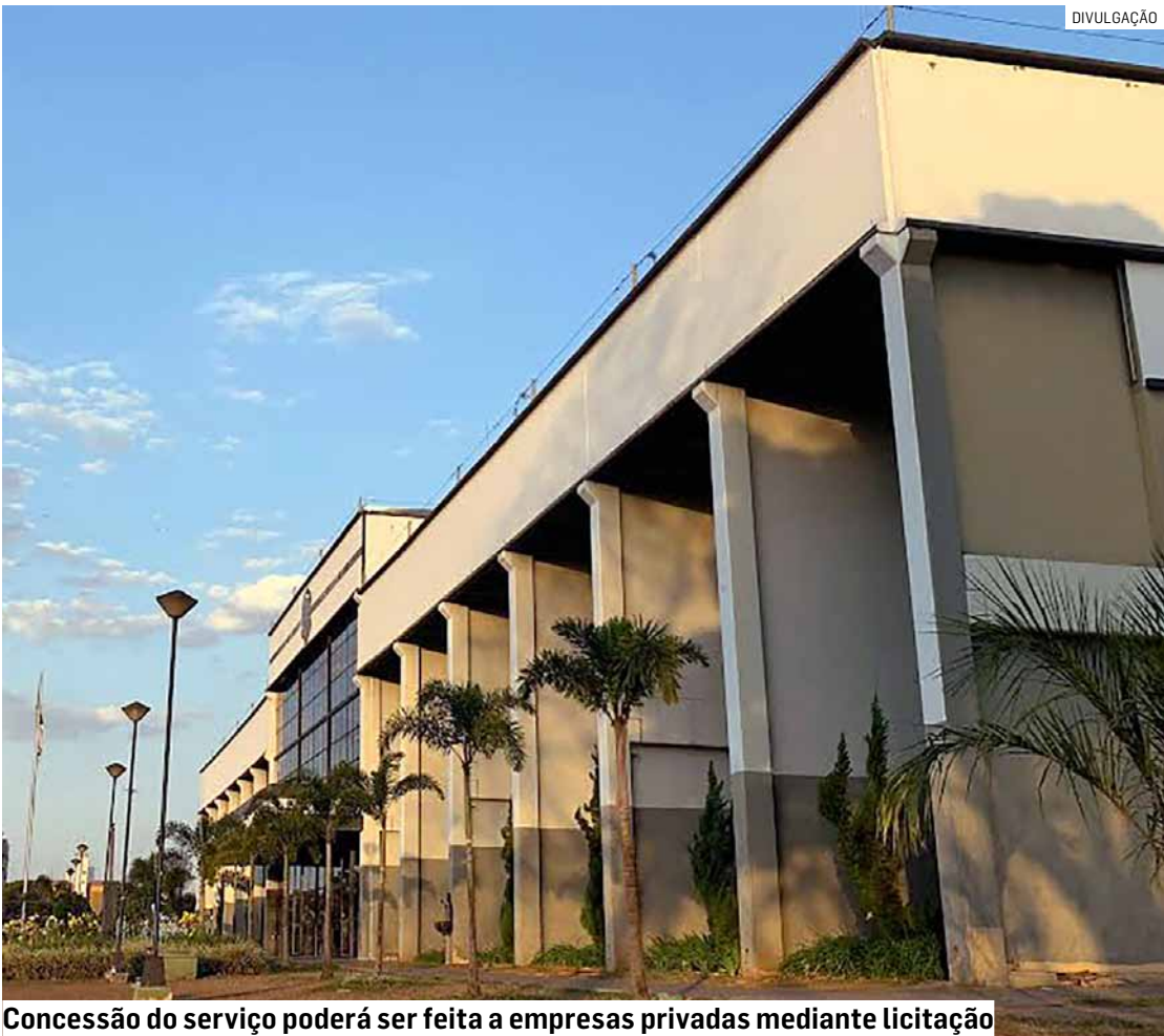
Concessão do serviço poderá ser feita a empresas privadas mediante licitação

estados e municípios exercerem essa competência de forma concorrente. O projeto prevê que a receita líquida da Loteria Municipal será destinada principalmente às áreas de saúde, educação, segurança pública, assistência social, cultura e esportes, garantindo retorno direto à população. A proposta também inclui mecanismos de controle e transparência, com fiscalização da Secre-