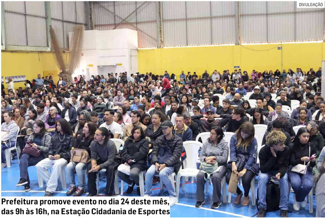
Prefeitura promove evento no dia 24 deste mês, das 9h às 16h, na Estação Cidadania de Esportes

O 2º Feirão de Empregos, promovido pela Prefeitura de Hortolândia, terá a participação de 70 empresas, que juntas irão disponibilizar 3.000 vagas de trabalho. O feirão será no dia 24 deste mês, das 9h às 16h, na Estação Cidadania de Esportes Deputado Luiz Lauro Filho, localizada na Rua João Guimarães Rosa, 242, no Jardim Amanda. Para quem quiser participar, a Secretaria de Desenvolvimento Econômico, Trabalho, Turismo e Inovação recomenda fazer a inscrição antecipada no portal da prefeitura. A inscrição é para agilizar a procura das vagas de emprego desejadas durante o evento. Quem não conseguir se inscrever, também poderá participar do feirão. A secretaria também orienta o público a trazer o currículo em formato digital no celular. Para quem trouxer o currículo em papel, uma equipe da secretaria fará a digitalização do currículo na hora.