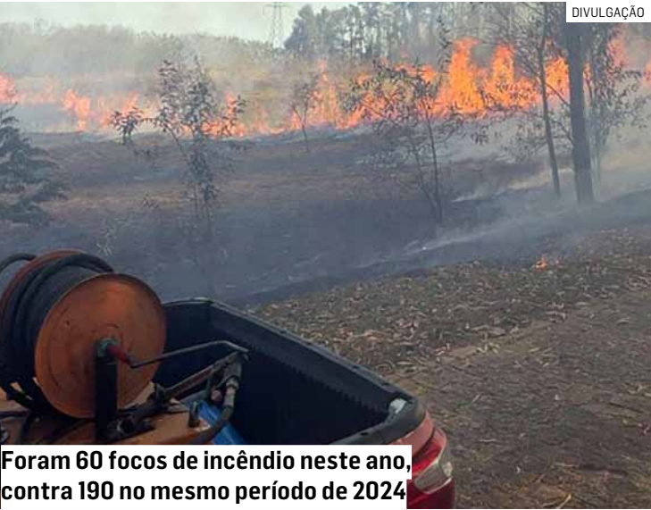
Foram 60 focos de incêndio neste ano, contra 190 no mesmo período de 2024

protocolos de resposta rápida e integração entre os órgãos públicos. Além disso, o número de campanhas educativas saltou de 16 em 2024 para 40 neste ano, ampliando o alcance das ações junto à população. O trabalho conjunto entre a Defesa Civil, a prefeitura e instituições parceiras reforçou a importância da participação comunitária na preservação ambiental, segundo avaliação do município.