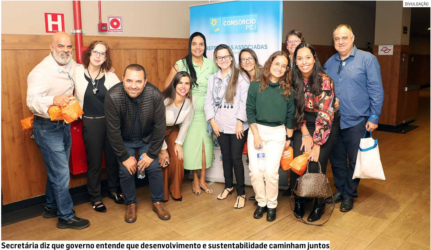
Secretária diz que governo entende que desenvolvimento e sustentabilidade caminham juntos

Hortolândia inscreveu seis projetos de grande impacto socioambiental: “Conhecendo Nossas Nascentes”, “Construção Sustentável e Boas Práticas de Uso Público” (Paço Municipal), “Controle das Leucenas”, “Microflorestas Urbanas”, “PEVs – Pontos de Entrega Voluntária de Materiais Recicláveis” e “Contribuição para Revitalização do Ribeirão Quilombo”. Embora não tenham avançado para a final, os trabalhos foram reconhecidos pela comissão julgadora pela qualidade técnica e pela contribuição efetiva à sustentabilidade e à gestão hídrica da região e integrará o caderno de resumos dos projetos da nova edição do Prêmio e será lançado durante a Cerimônia de Premiação dos ven-