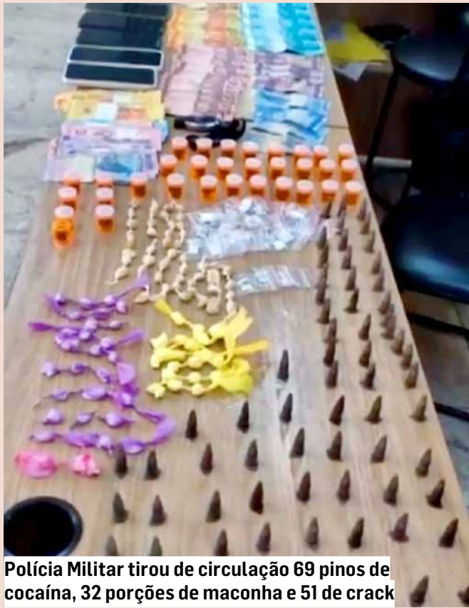
Polícia Militar tirou de circulação 69 pinos de cocaína, 32 porções de maconha e 51 de crack