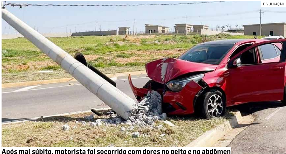
Após mal súbito, motorista foi socorrido com dores no peito e no abdômen

O motorista foi socorrido com dores no peito e no abdômen, provocadas pelo acionamento do cinto de segurança e do airbag. Ele foi encaminhado a uma