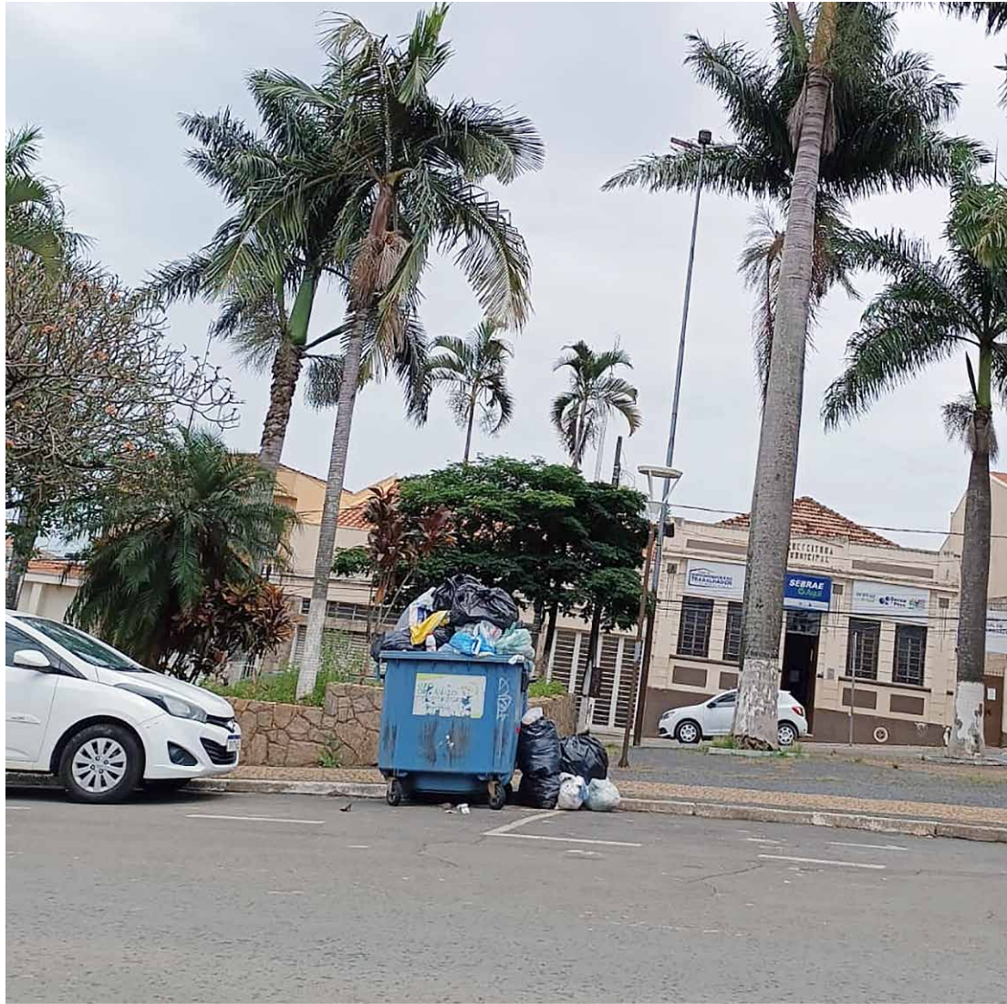
Container na região central acumula grande quantidade de lixo e causa revolta de moradores

Nas redes sociais, outro morador registrou imagens de urubus revirando sacos de lixo. As postagens atraíram uma série de críticas à administração municipal, com internautas