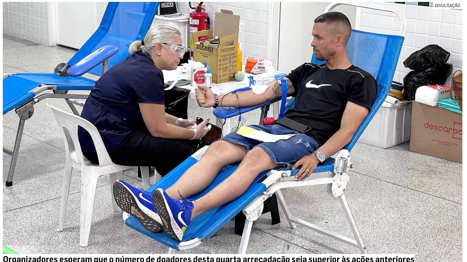
Organizadores esperam que o número de doadores desta quarta arrecadação seja superior às ações anteriores

Para ser um doador de sangue, é necessário ter entre 18 e 69 anos, mas são aceitos candidatos a partir dos 16 anos, com o consentimento formal e presencial do responsável legal. O doador deve pesar mais de 50 quilos, não ter ingerido bebida alcoólica nas 24 horas que antecedem a doação, ter dormido pelo menos seis horas. Não é necessário estar em jejum.