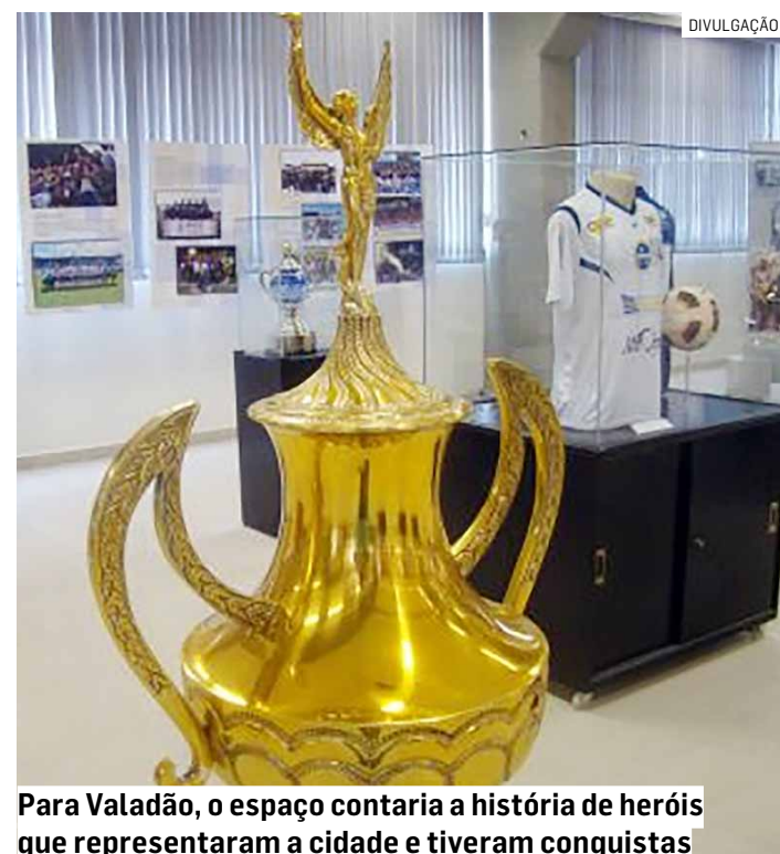
Para Valadão, o espaço contaria a história de heróis que representaram a cidade e tiveram conquistas

O vereador pede ainda bebedouros na praça Hélio Fernandes de Carvalho; linha de ônibus na avenida Dr. Roberto Moreira; iluminação nos campos de futebol no Jardim Itapoan e abertura do Jardim Botânico aos finais de semana.