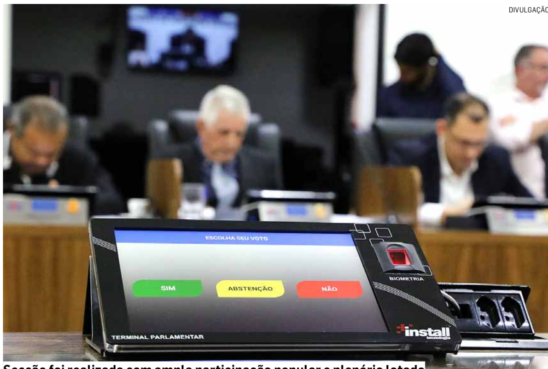
Sessão foi realizada com ampla participação popular e plenário lotado

Os três projetos de lei que já constavam da pauta de votação são o projeto apresentado pelos vereadores