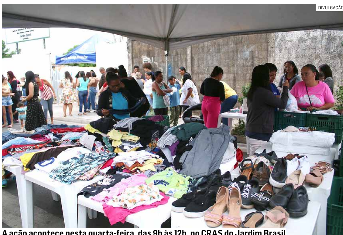
A ação acontece nesta quarta-feira, das 9h às 12h, no CRAS do Jardim Brasil

Da Redação • HORTOLÂNDIA tribunaliberal@tribunaliberal.com.br