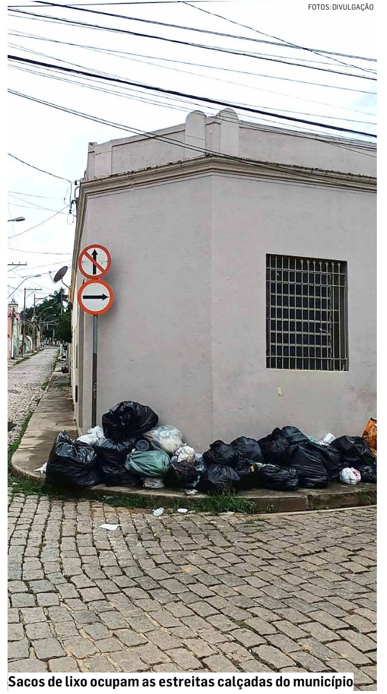
Sacos de lixo ocupam as estreitas calçadas do município

da no sábado (7). A administração municipal informou que o serviço segue em execução e deve ser totalmente normalizado até esta quarta-feira (11).