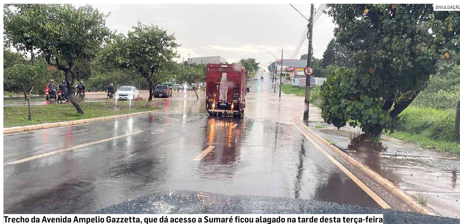
Trecho da Avenida Ampelio Gazzetta, que dá acesso a Sumaré ficou alagado na tarde desta terça-feira

Da Redação • NOVA ODESSA tribunaliberal@tribunaliberal.com.br