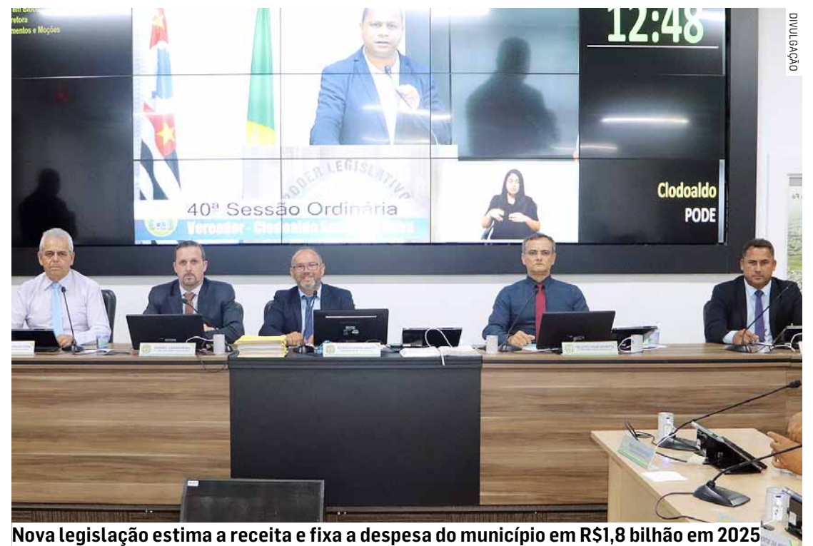
Nova legislação estima a receita e fixa a despesa do município em R$1,8 bilhão em 2025

Hortolândia reafirma, com a aprovação da LOA, o compromisso com o planejamento financeiro e a implementação de ações que beneficiem todos os seus cidadãos.