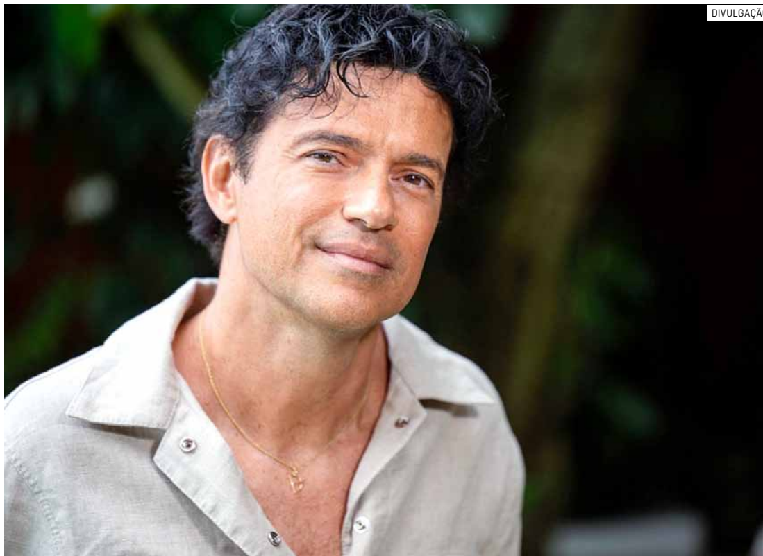
Show do cantor Jorge Vercillo está previsto para as 21h na Praça 'A Poderosa'

Reconhecido nacionalmente por composições e canções do gênero MPB (Música Popular Brasileira), Jorge Vercillo promete