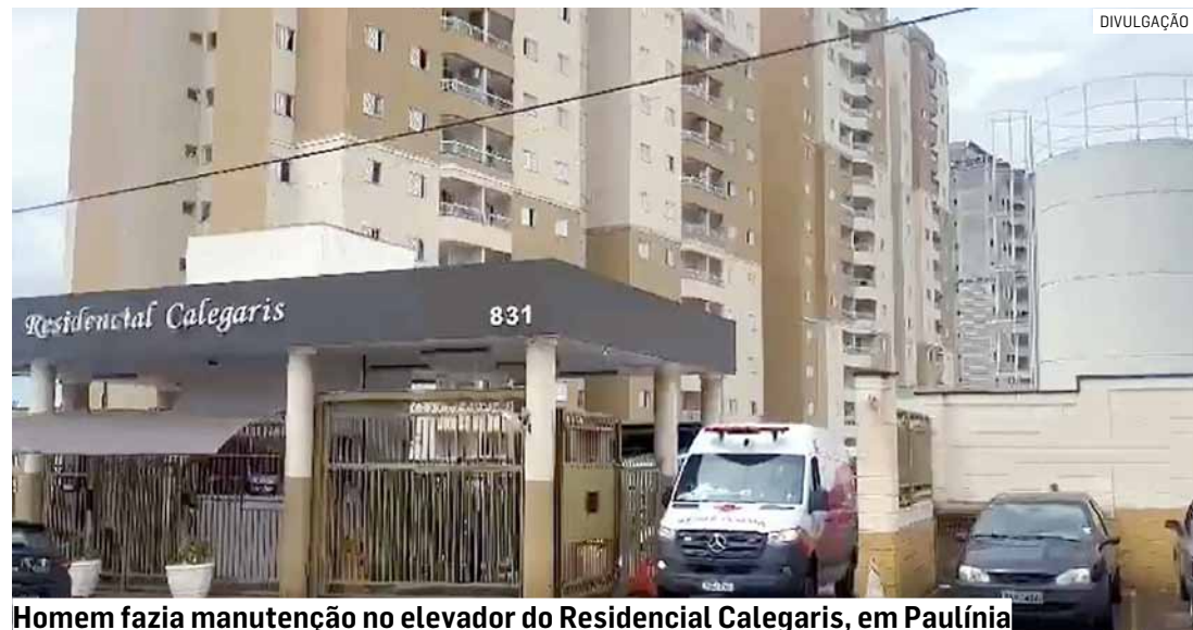
Homem fazia manutenção no elevador do Residencial Calegaris, em Paulínia

Cézar Oliveira • PAULÍNIA tribunaliberal@tribunaliberal.com.br