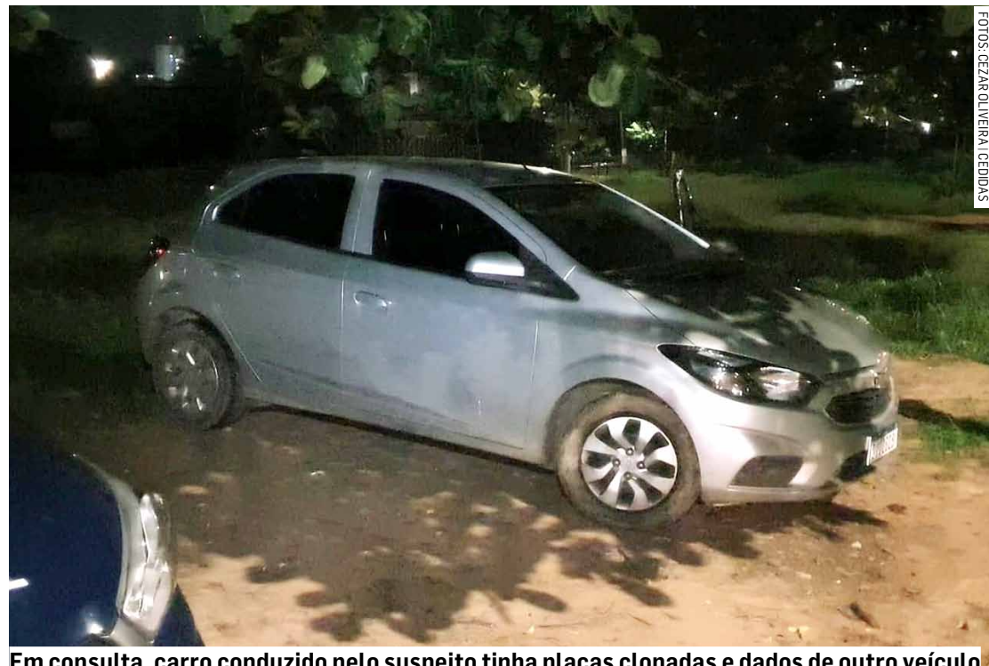
Em consulta, carro conduzido pelo suspeito tinha placas clonadas e dados de outro veículo

sentido Centro da cidade. A equipe da Guarda Municipal, com apoio da Romu (Rondas Ostensivas Municipais), realizou o cerco e abordou o veículo na rua Líbero Bada-