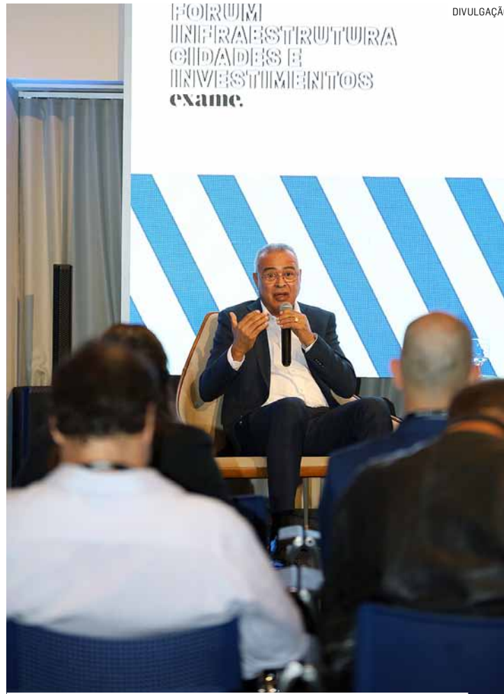
Prefeito Zezé Gomes participou do evento e destacou o papel estratégico que Hortolândia desempenha no setor

De acordo com Zezé Gomes, o setor de saúde representa 8% do PIB municipal, estimado pela Secretaria Municipal de Desenvolvimento Econômico em R$23 bilhões. “Além da infraestrutura, fatores como a localização estratégica, cortada pelas rodovias Ban-