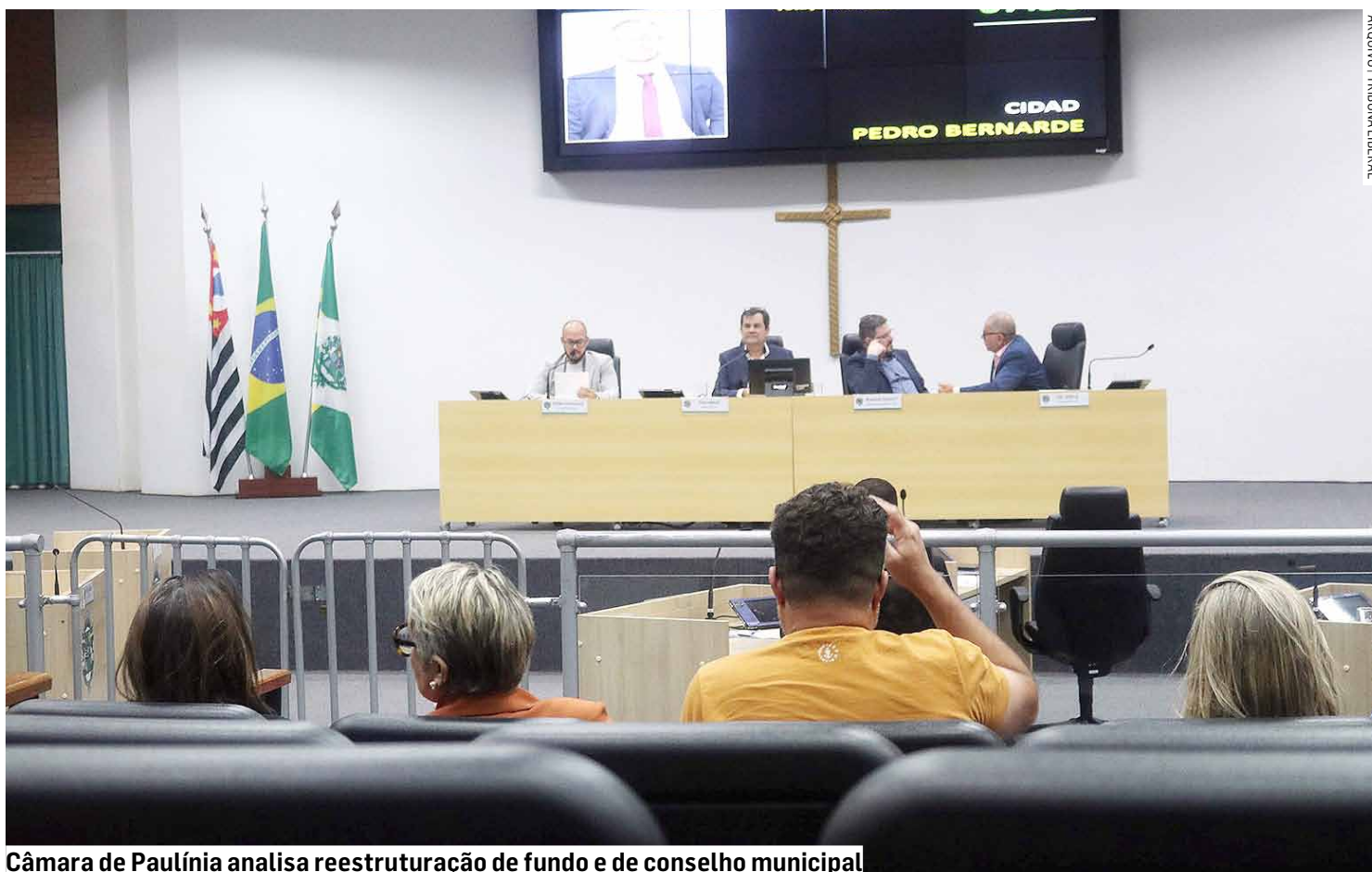
Câmara de Paulínia analisa reestruturação de fundo e de conselho municipal

O fundo terá como finalidade o financiamento de