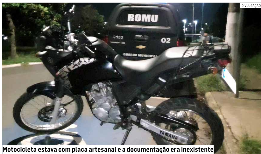
Motocicleta estava com placa artesanal e a documentação era inexistente

De acordo com os patrulheiros, o homem já tinha sido detido com uma moto roubada há aproximadamente quatro meses. Diante dos fatos, ele foi conduzido até o Plantão Policial de Hortolândia, onde a ocorrência foi registrada e, desta vez, o acusado ficou preso por adulteração de sinal identificador veicular.