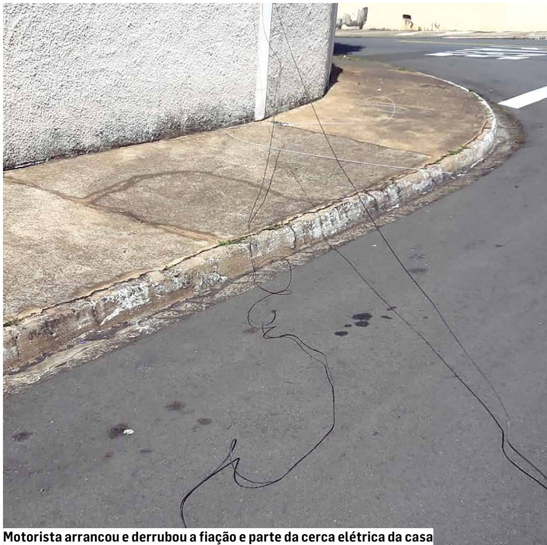
Motorista arrancou e derrubou a fiação e parte da cerca elétrica da casa

“Pelo portão, gritei para o ônibus parar. Ele não parou. Logo atrás, vinha uma van da mesma empresa e um dos funcionários ainda disse: ‘Não fui eu’. E eu respondi: não foi você, mas, foi a sua empre-