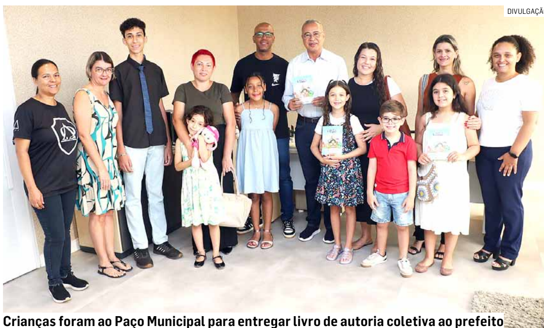
Crianças foram ao Paço Municipal para entregar livro de autoria coletiva ao prefeito

No curso, oito alunos da Emef (Escola Municipal de Ensino Fundamental) Samuel da Silva Mendonça criaram textos e desenhos. Cada criança falou sobre temas variados, aspectos de suas vidas, coisas que gostam de fazer e sobre a cidade. Todo esse material foi reunido numa obra intitulada 'O Livro'. A publicação foi lançada pelo projeto Escritores de Hortolândia, neste mês. A realização do curso é uma parce-