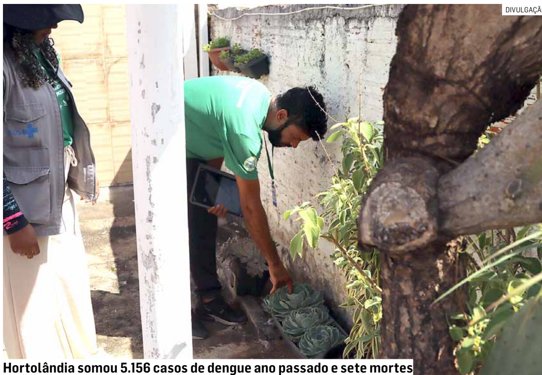
Hortolândia somou 5.156 casos de dengue ano passado e sete mortes

O veterinário reforça a importância da população manter os cuidados para evitar a proliferação do