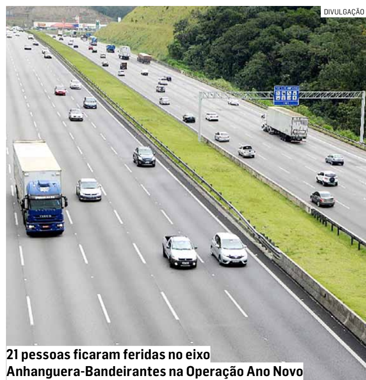
21 pessoas ficaram feridas no eixo Anhanguera-Bandeirantes na Operação Ano Novo

A CCR AutoBAN faz parte do Grupo CCR desde 1998 e é responsável pela administração e manutenção de importantes rodovias no estado de São Paulo, conectando a capital ao interior. A empresa também gerencia a SP-300 (Rodovia Dom Gabriel Paulino Bueno Couto) e a SPI-102/330 (Rodovia Adalberto Panzan), totalizando quase 317 quilômetros de malha rodoviária.