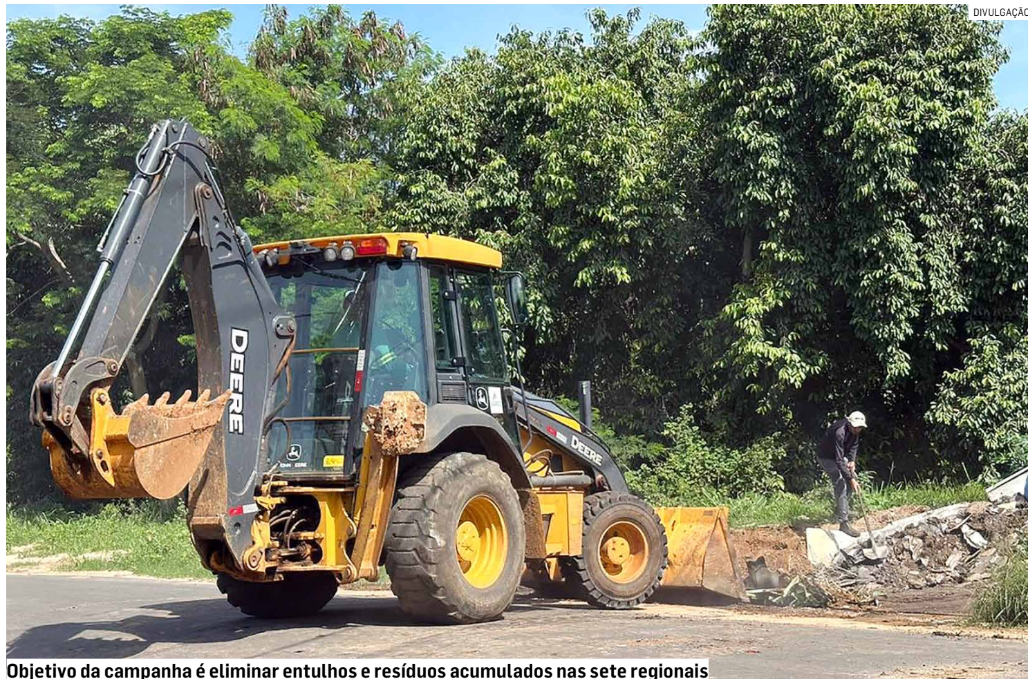
Objetivo da campanha é eliminar entulhos e resíduos acumulados nas sete regionais

Novo governo diz que 'herdou cidade suja' e programou ação que faz parte das medidas do Plano de Contingenciamento anunciado pelo Executivo; mutirões farão serviços de poda, roçagem, remoção de entulhos e desobstrução de vias