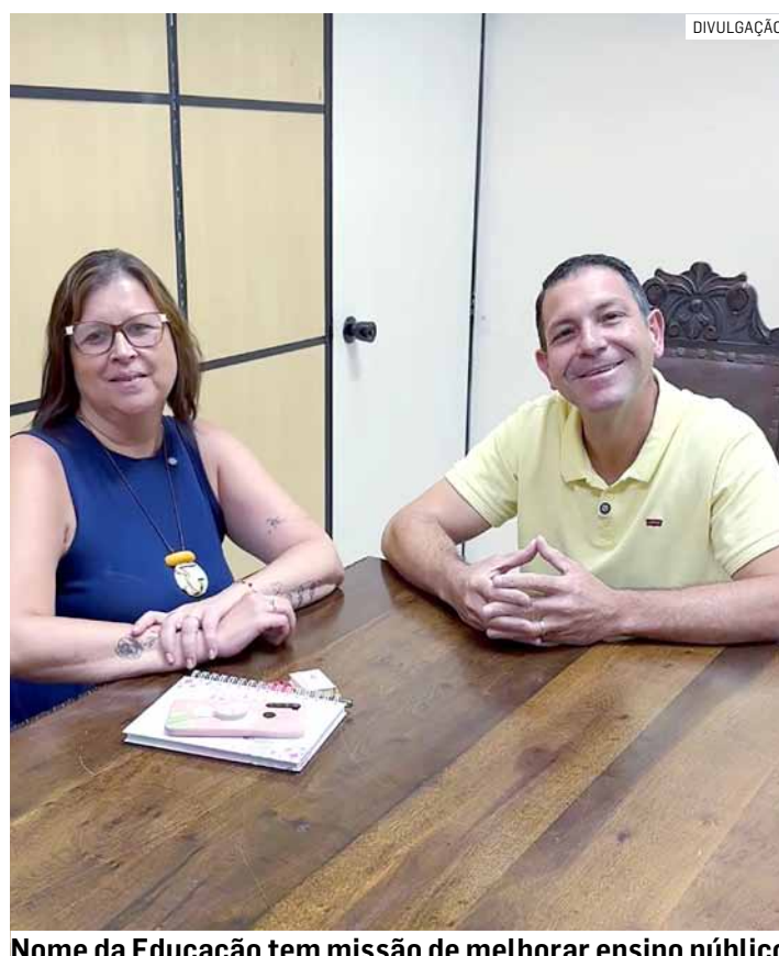
Nome da Educação tem missão de melhorar ensino público