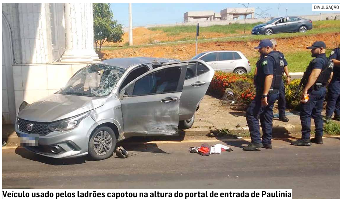
Veículo usado pelos ladrões capotou na altura do portal de entrada de Paulínia

Ainda segundo a Guarda Municipal, outro veículo, que não estava envolvido na ocorrência, foi atingido durante a perseguição. O motorista sofreu ferimentos em uma das mãos. A dupla foi socorrida após o acidente, recebeu atendimento médico e, em seguida, eles foram presos por roubo ao serem apresentados na Delegacia de Polícia de Paulínia.