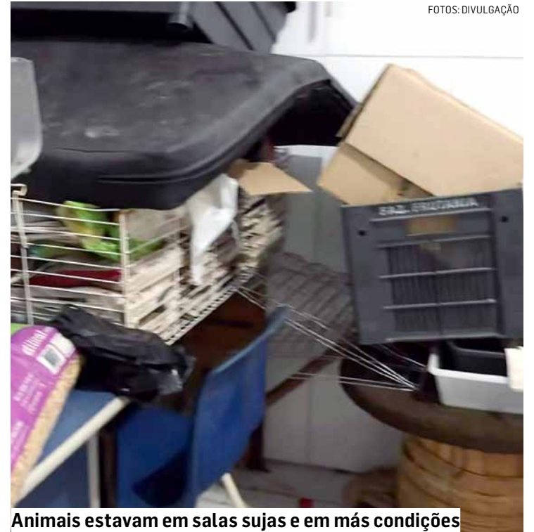
Animais estavam em salas sujas e em más condições

“Levei o cachorrinho da minha mãe, aí em julho de