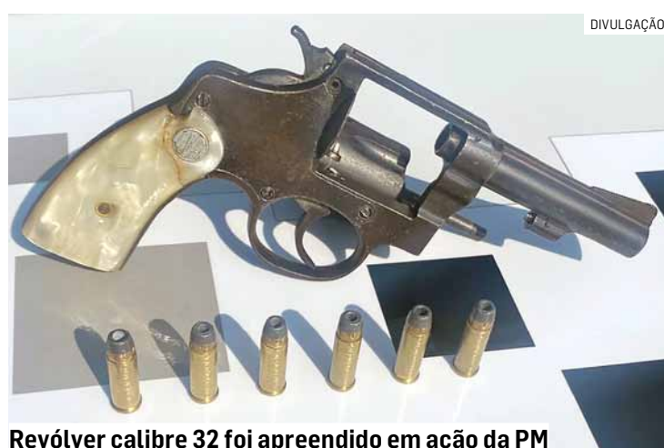
Revólver calibre 32 foi apreendido em ação da PM

Na tentativa de fuga, o segundo suspeito largou a motocicleta em direção à viatura e a moto atingiu a mão do policial, causando ferimento. Questionado, o suspeito entregou o paradeiro do indivíduo que havia fugido, e com o apoio de mais viaturas, as equipes se deslocaram até a rua Marcília Leite Alves, no Jardim Fantinatti, onde locali-