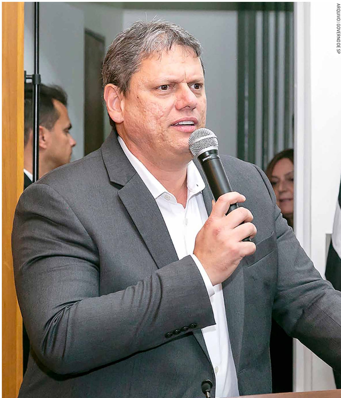
Conversas iniciais do governador sobre VLT foram adiantadas pelo Tribuna Liberal

Com recursos estimados em R$ 4,5 bilhões, governo quer para o ano que vem análise de viabilidade de Veículo Leve Sobre Trilhos que percorrerá os três mais populosos municípios da região metropolitana; empresa deve ser contratada