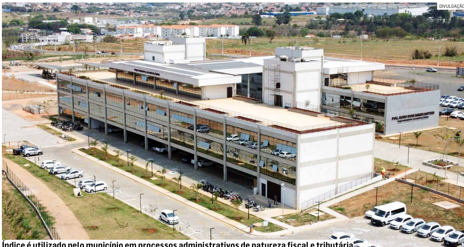
Índice é utilizado pelo município em processos administrativos de natureza fiscal e tributária

Da Redação • HORTOLÂNDIA tribunaliberal@tribunaliberal.com.br