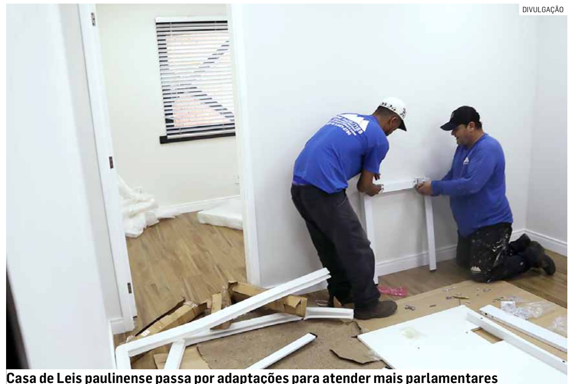
Casa de Leis paulinense passa por adaptações para atender mais parlamentares

Se não houver nenhuma nova sessão extraordinária, os vereadores voltam a se reunir em sessão ordinária no dia 28 de janeiro, às 17h30.