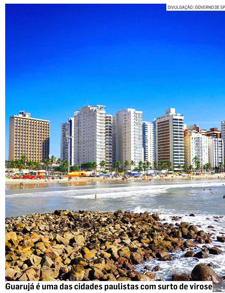
Guarujá é uma das cidades paulistas com surto de virose

O Boletim de Balneabilidade divulgado nesta quinta-feira (02) indica que, das 175 praias monitoradas no litoral, 38 apresentam condição imprópria para banho.