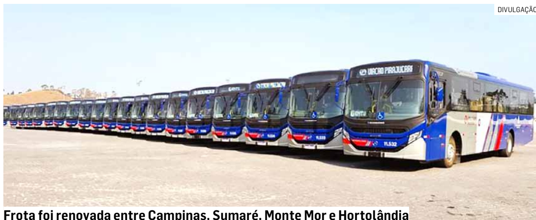
Frota foi renovada entre Campinas, Sumaré, Monte Mor e Hortolândia

Os ônibus entregues são modernos e oferecem às viagens dos usuários mais