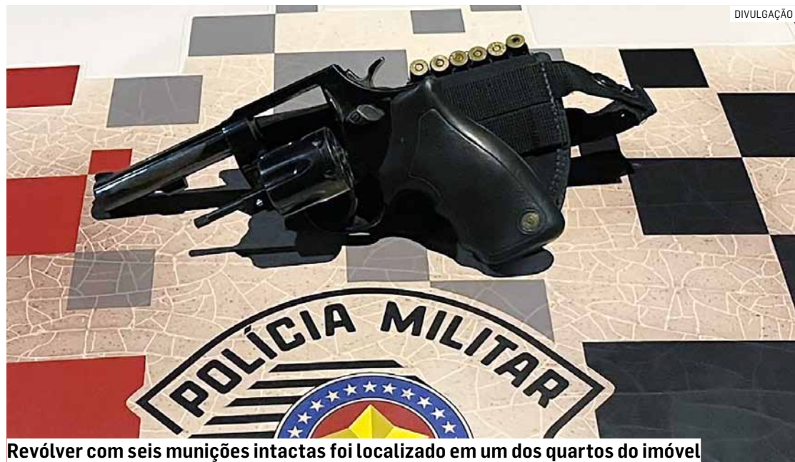
Revólver com seis munições intactas foi localizado em um dos quartos do imóvel

Cézar Oliveira • HORTOLÂNDIA tribunaliberal@tribunaliberal.com.br