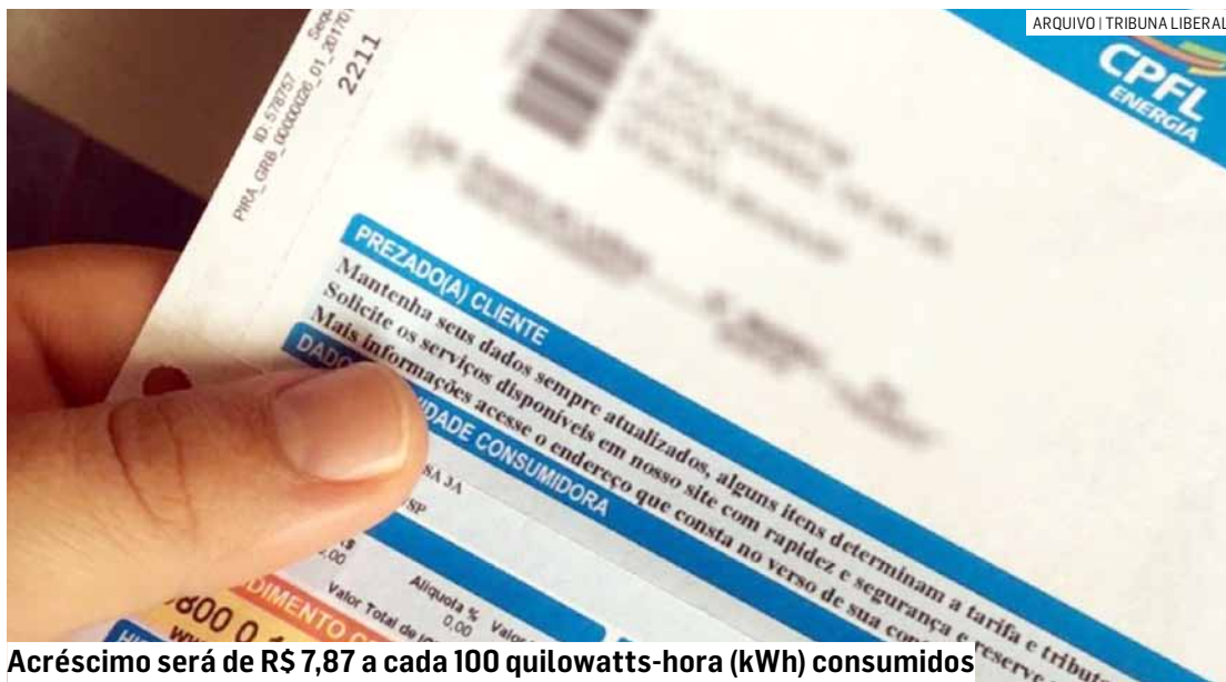
Acréscimo será de R$ 7,87 a cada 100 quilowatts-hora (kWh) consumidos

O acionamento da bandeira vermelha patamar 2 ocorre devido à previsão