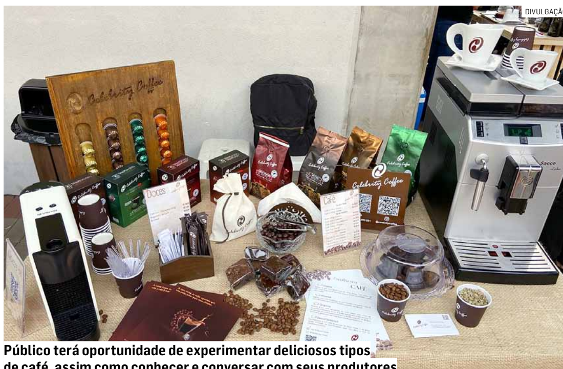
Público terá oportunidade de experimentar deliciosos tipos de café, assim como conhecer e conversar com seus produtores

Com características genuínas, o café do Circuito das Águas Paulista vem se destacando entre os cafés especiais do Brasil, principalmente por sua doçura extra, o que gera a brincadeira que já foi adotado no pé, e tem conquistado prêmios nos principais concursos do país. Muitos dos cafés que estarão no evento são premiados e reconhecidos