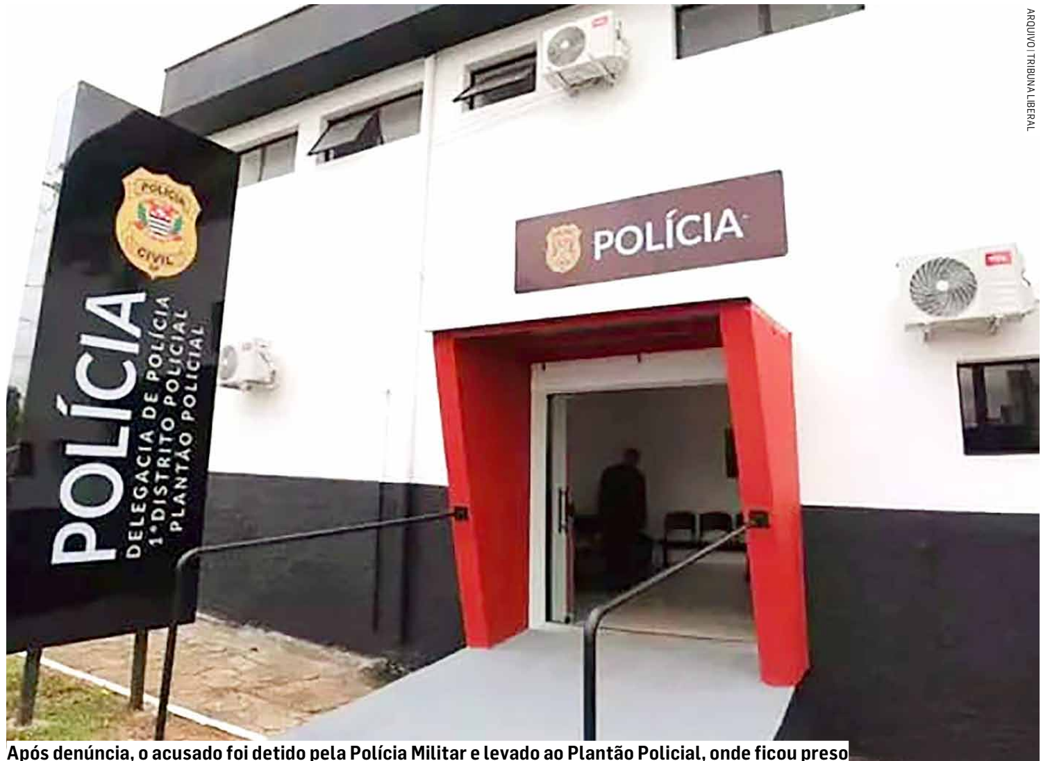
Após denúncia, o acusado foi detido pela Polícia Militar e levado ao Plantão Policial, onde ficou preso

A Polícia Militar foi acionada e, através de uma denúncia anônima, conseguiu localizar o suspeito no bairro Santa Clara. O auxiliar administrativo foi levado ao Plantão Policial de Sumaré, onde foi registrado o boletim de ocorrência de homicídio. O acusado foi encaminhado