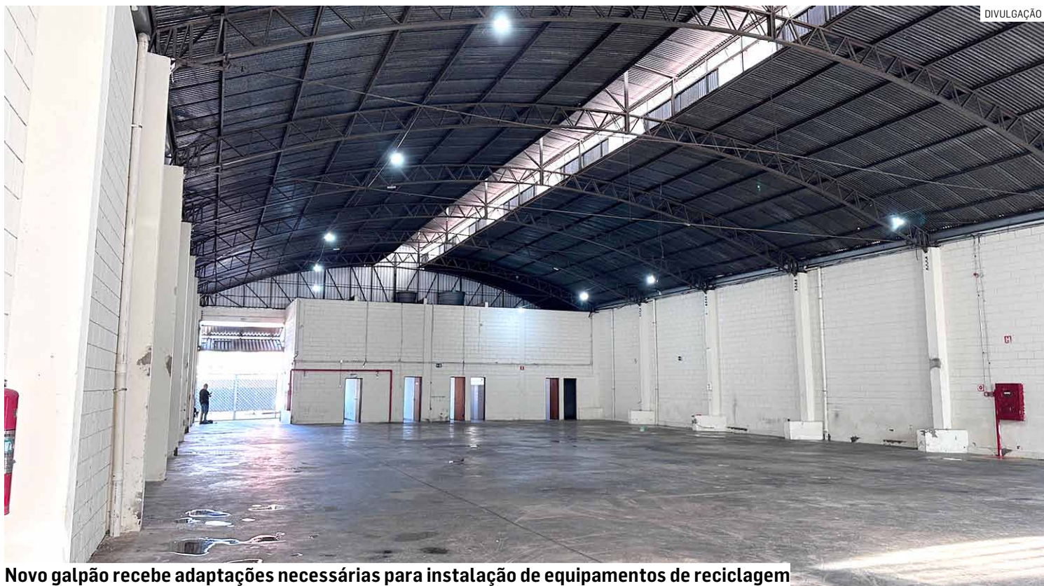
Novo galpão recebe adaptações necessárias para instalação de equipamentos de reciclagem

Misturado ao lixo orgânico, são encontradas muitas garrafas PET e sacolinhas de supermercado, por exemplo - resíduos que levam mais de 400 anos para se decompor. Quando não