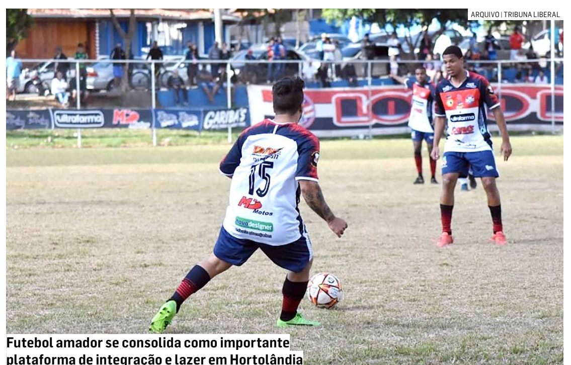
Futebol amador se consolida como importante plataforma de integração e lazer em Hortolândia

Com uma agenda intensa de jogos e grande participação das equipes, o futebol amador se consolida como uma importante plataforma de integração e lazer em Hortolândia, proporcionando momentos de competitividade e engajamento entre os moradores. A expectativa é de que as próximas rodadas do torneio Master continuem a atrair torcedores e familiares, reforçando o papel do esporte na comunidade local.