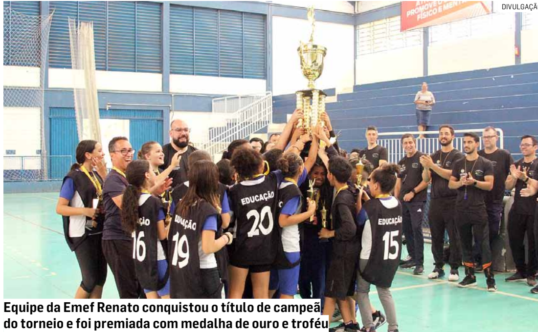
Equipe da Emef Renato conquistou o título de campeã do torneio e foi premiada com medalha de ouro e troféu

O time vencedor foi premiado com medalha de ouro e troféu, enquanto o da