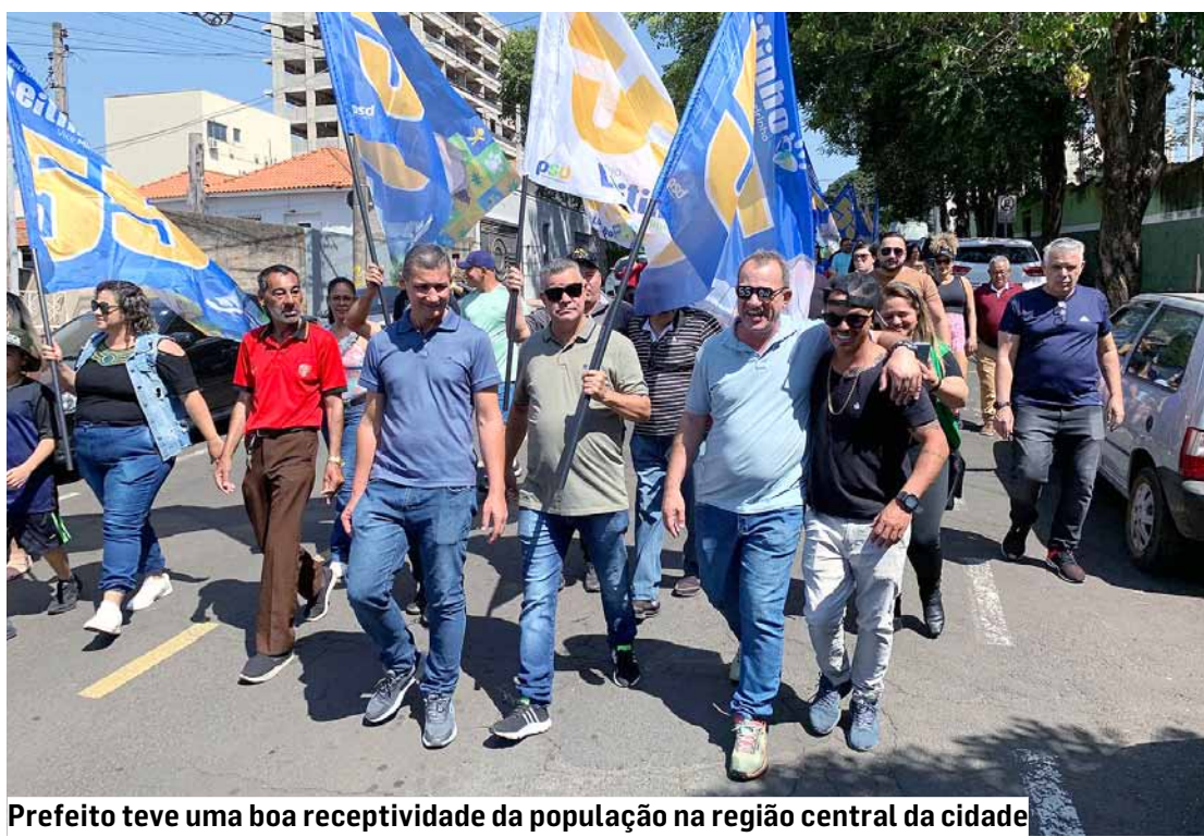
Prefeito teve uma boa receptividade da população na região central da cidade