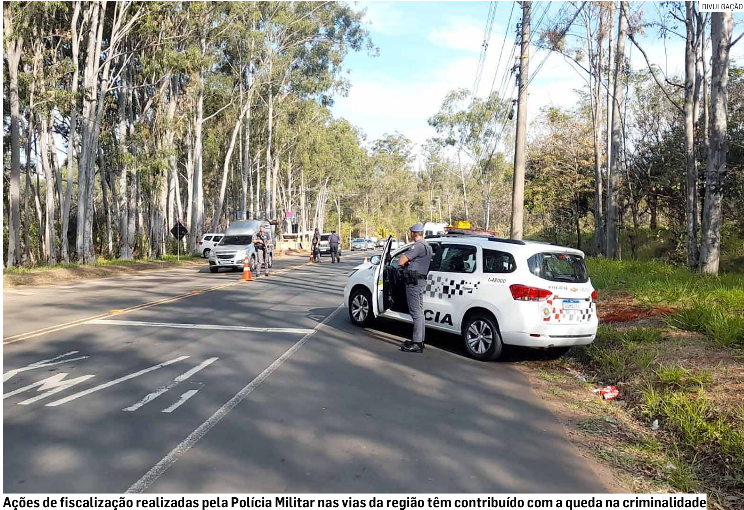
Ações de fiscalização realizadas pela Polícia Militar nas vias da região têm contribuído com a queda na criminalidade

De acordo com os dados, o número de homicídios caiu pela metade, passando de quatro para dois casos, uma redução de 50%. No mês passado, foram registrados dois homicídios, um na cidade de Nova Odessa e outro em Sumaré, enquanto no mesmo mês do ano passado foram contabilizados