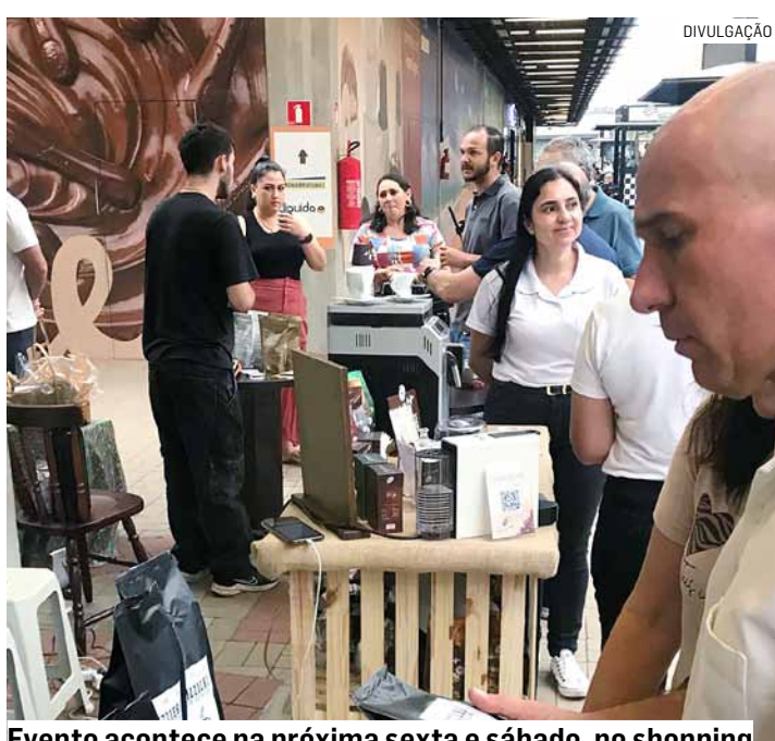
Evento acontece na próxima sexta e sábado, no shopping

No próximo fim de semana, dias 7 e 8 de setembro, o Shopping ParkCity Sumaré realiza evento especial e gratuito para os amantes da bebida mais queridinha do Brasil: o Festival do Café. Em parceria com a Acecap (Associação dos Produtores de Cafés Especiais do Circuito das Águas Paulista), o Festival do Café apresenta os cafés especiais produzidos na região do Circuito das Águas Paulista; produção vem se destacando entre os cafés especiais do Brasil. PÁGINA 03