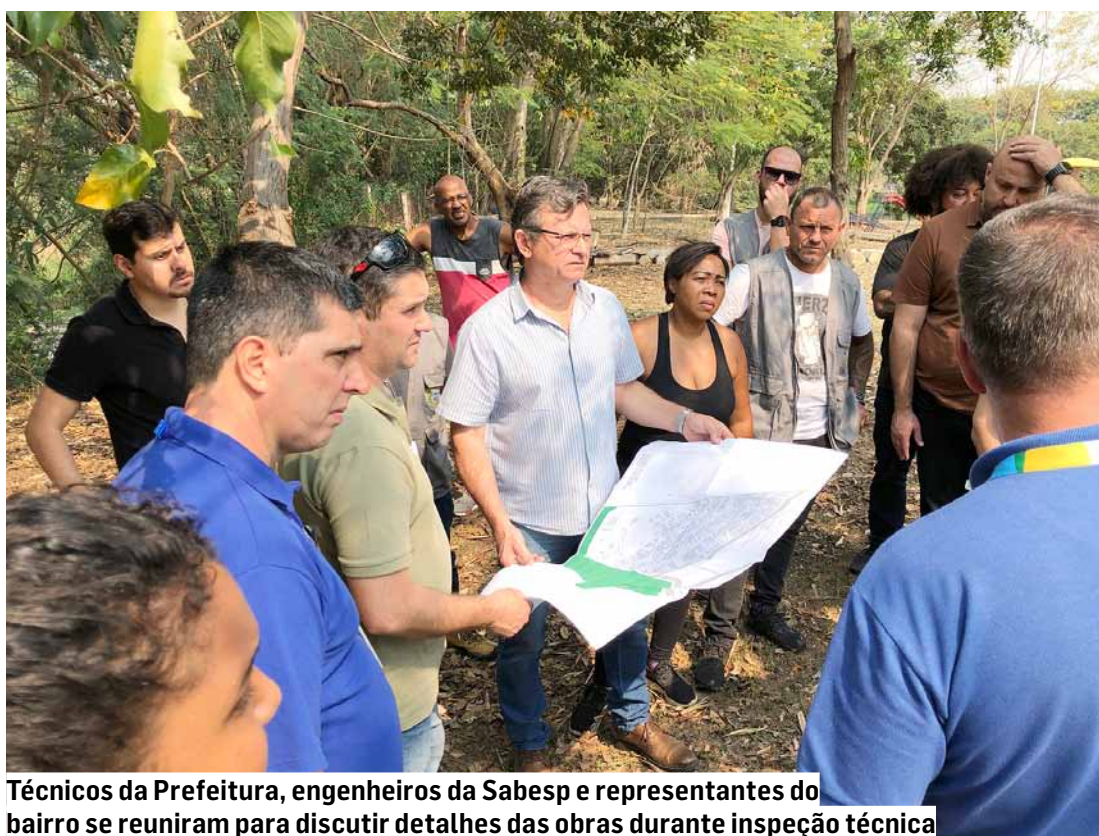
Técnicos da Prefeitura, engenheiros da Sabesp e representantes do bairro se reuniram para discutir detalhes das obras durante inspeção técnica

No âmbito habitacional, um convênio firmado, em junho de 2022, entre a Prefeitura de Hortolândia e a CDHU (Companhia de Desenvolvimento Habitacional e Urbano) do Estado de São Paulo viabilizou a construção de 152 unidades habitacionais no Jd. Monte Sinai. O empreendimento tem por objetivo promover a recuperação ambiental no local e realocar famílias que vivem em APP (Área de Preservação Permanente) para as novas moradias. | Da Redação