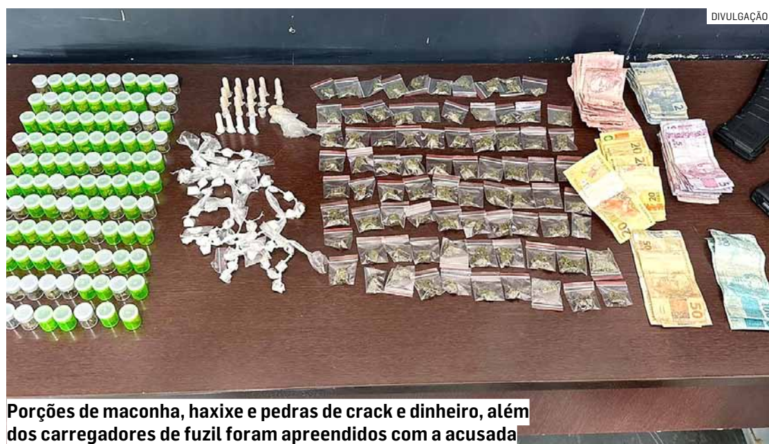
Porções de maconha, haxixe e pedras de crack e dinheiro, além dos carregadores de fuzil foram apreendidos com a acusada

lo, em Hortolândia. A ocorrência foi registrada após uma operação da Polícia Militar que, com base em informações de que um casal estaria em posse de drogas e armas no Condomínio Portugal, localizado na