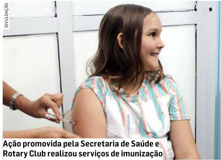
Ação promovida pela Secretaria de Saúde e Rotary Club realizou serviços de imunização

Da Redação • SUMARÉ tribunaliberal@tribunaliberal.com.br