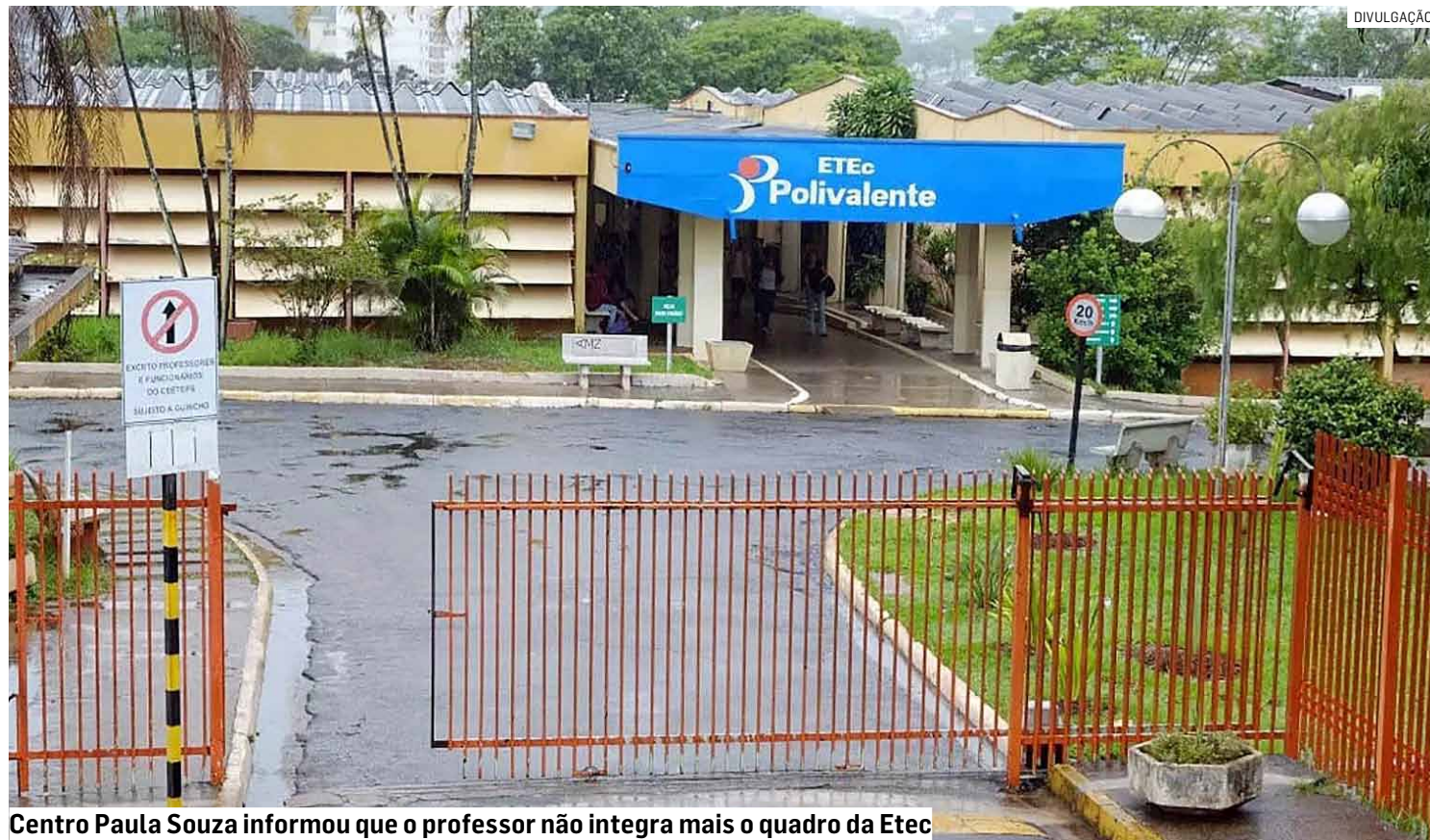
Centro Paula Souza informou que o professor não integra mais o quadro da Etec

Caso envolve três estudantes menores de idade da unidade estadual de ensino; principal suspeito é um professor de 62 anos, que deixou de integrar o quadro de docentes após situação vir à tona; crime foi registrado no 1º Distrito Policial