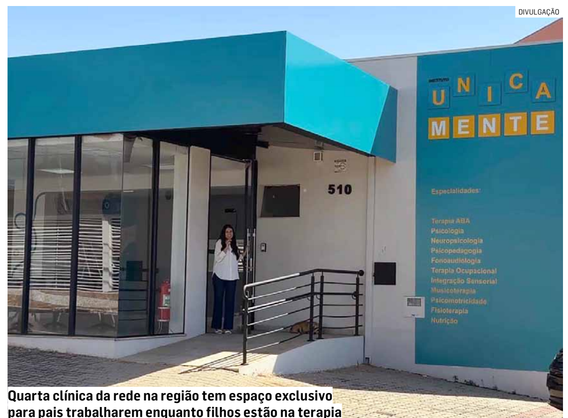
Quarta clínica da rede na região tem espaço exclusivo para pais trabalharem enquanto filhos estão na terapia

A recepção foi planejada para ser ampla e funcional. Como os pais costumam permanecer na unidade