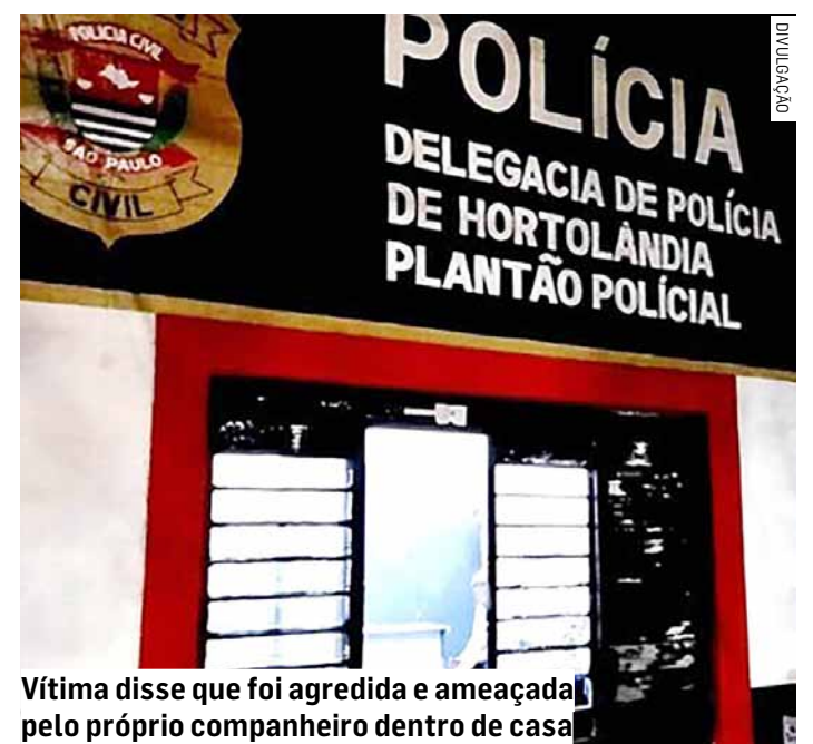
Vítima disse que foi agredida e ameaçada pelo próprio companheiro dentro de casa

O homem foi localizado em frente ao imóvel e admitiu ter agredido a companheira durante uma discussão. A prisão foi confirmada no Plantão Policial, e o suspeito permaneceu à disposição da Justiça.