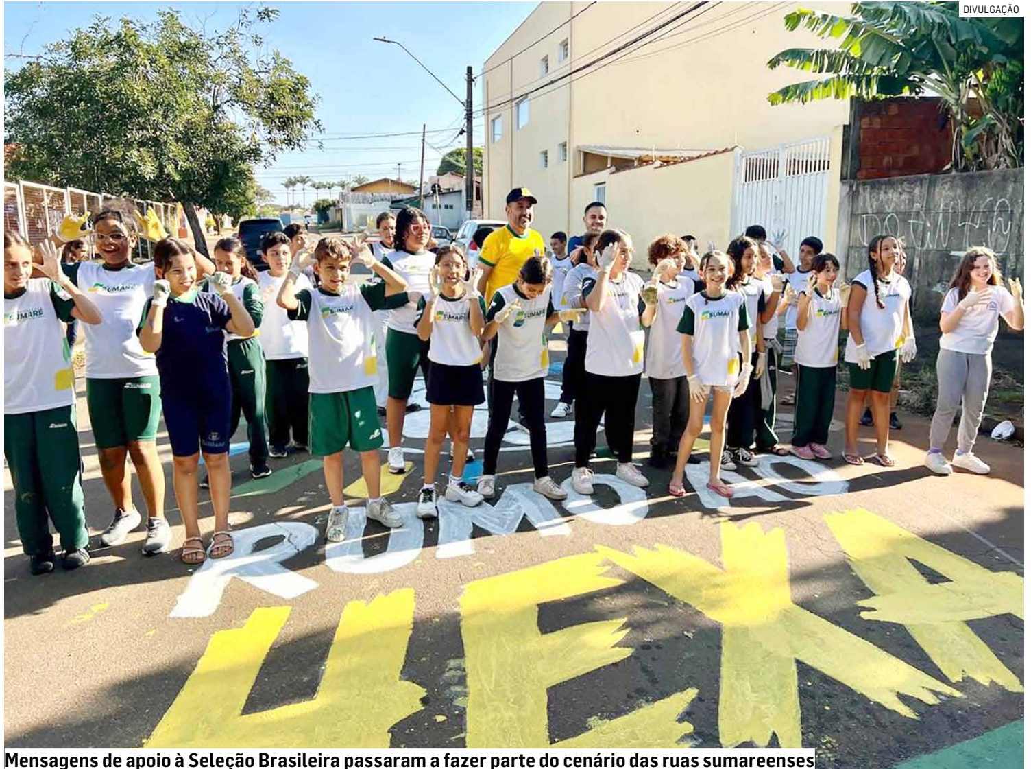
Mensagens de apoio à Seleção Brasileira passaram a fazer parte do cenário das ruas sumareenses