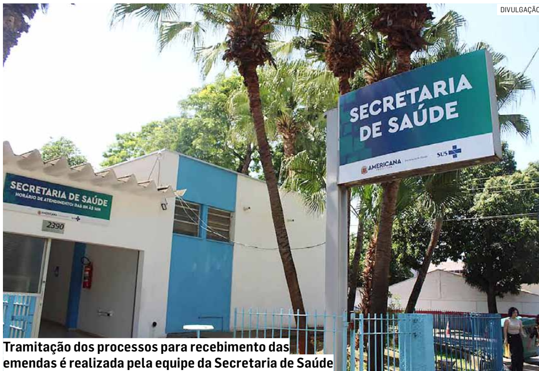
Tramitação dos processos para recebimento das emendas é realizada pela equipe da Secretaria de Saúde