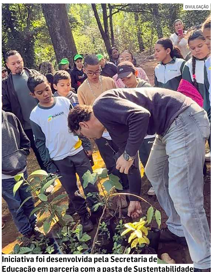
Iniciativa foi desenvolvida pela Secretaria de Educação em parceria com a pasta de Sustentabilidade