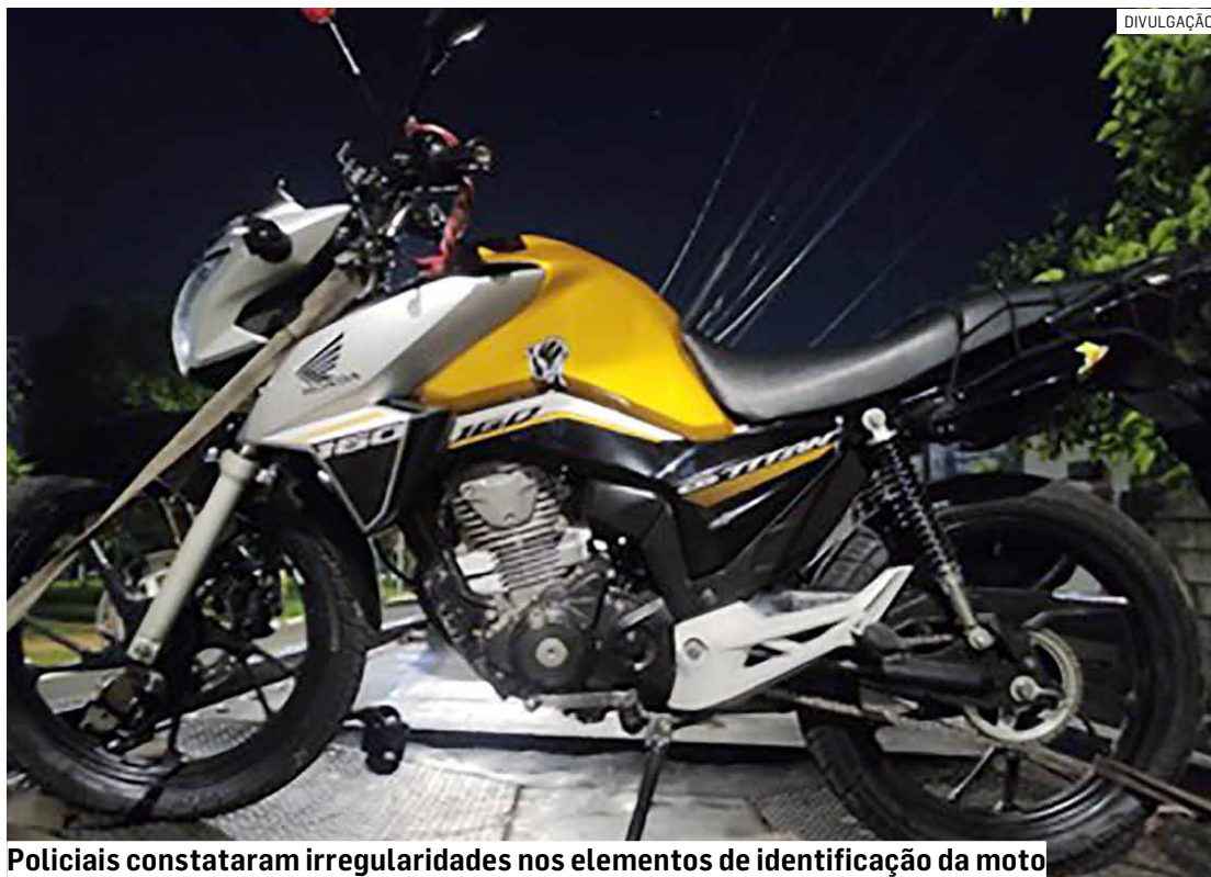
Policiais constataram irregularidades nos elementos de identificação da moto

Números do motor e do chassi apresentavam sinais de supressão