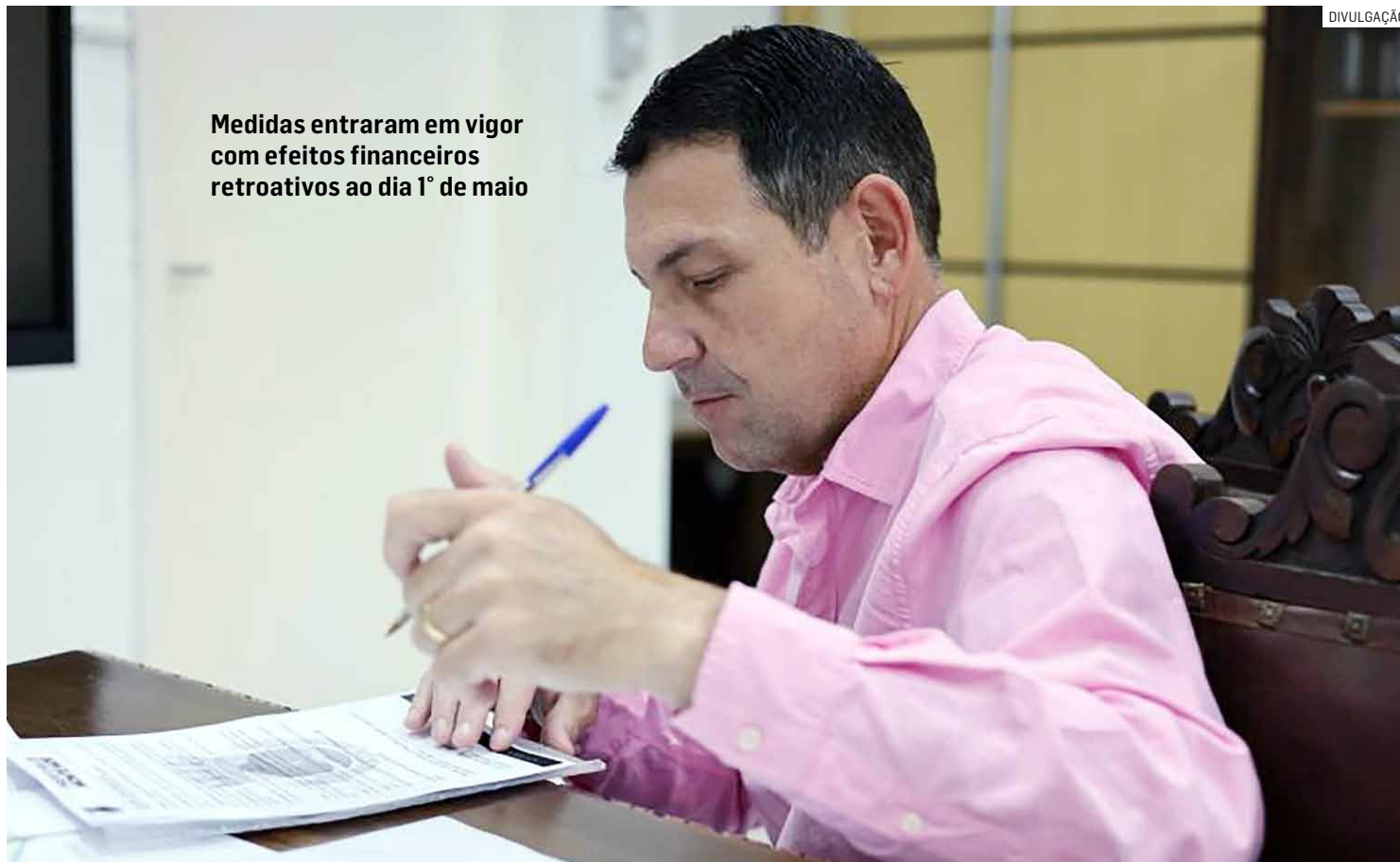
Medidas entraram em vigor com efeitos financeiros retroativos ao dia 1º de maio

A revisão será aplicada de forma linear sobre os vencimentos dos servidores estatutários, salários dos empregados públicos, proventos de aposentado-