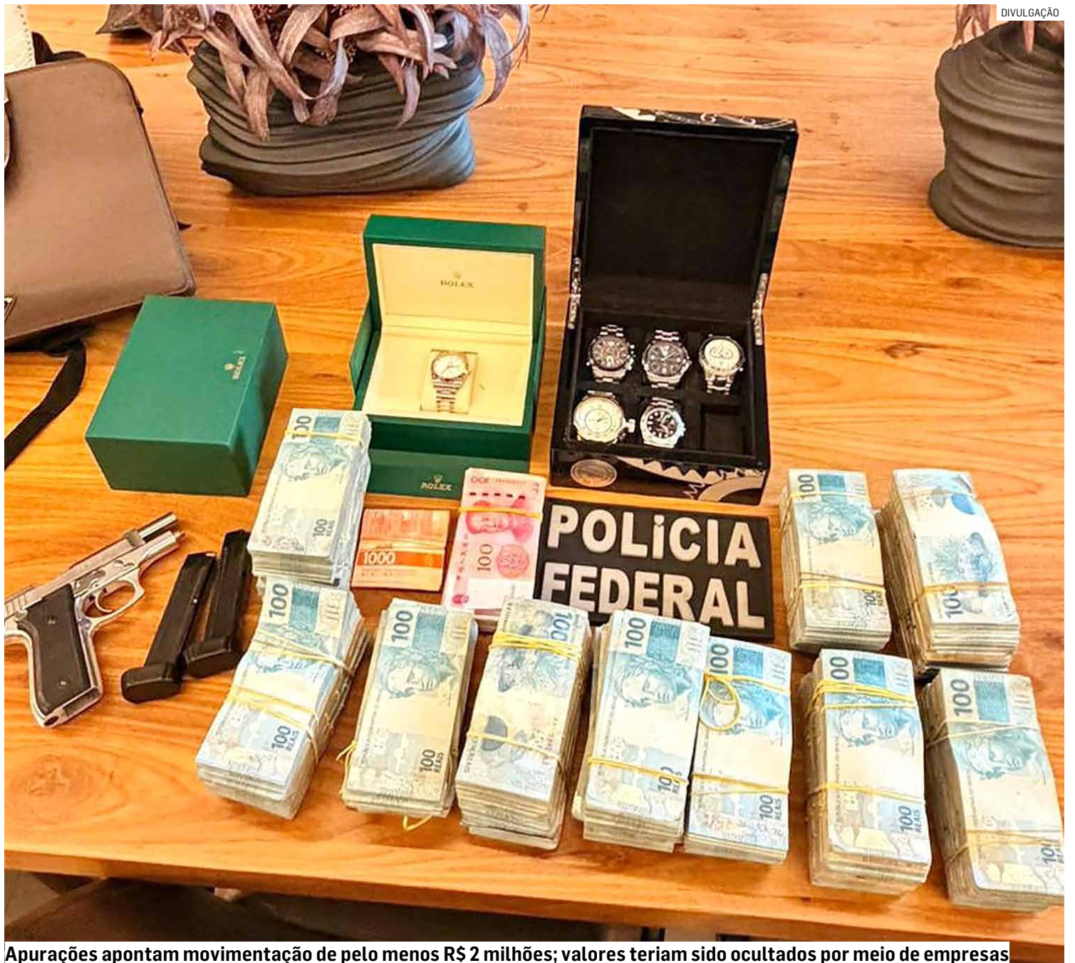
Apurações apontam movimentação de pelo menos R$ 2 milhões; valores teriam sido ocultados por meio de empresas

Durante a ação, agentes federais recolheram documentos, equipamentos eletrônicos e outros materiais que serão submetidos à análise pericial. O objetivo é reunir novas provas, identificar possíveis beneficiários do esquema e ve-