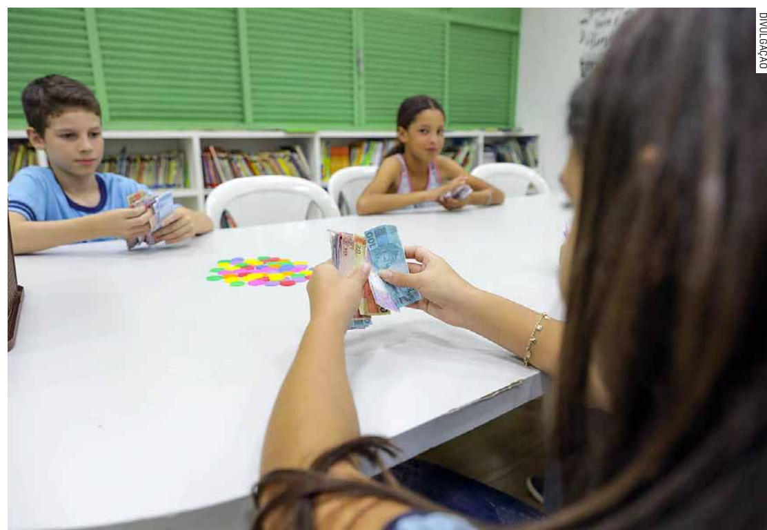
Parlamentar quer saber informações sobre disciplina de educação financeira nas escolas