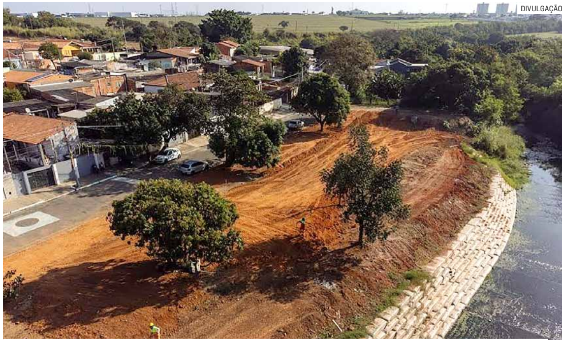
Prefeitura prepara o local para receber academia ao ar livre e parquinho para as crianças

O novo parque está em implantação na área às margens do Córrego Jacuba, que corta o bairro. De acordo com a Secretária de Obras, o trecho em urbanização compreende entre as ruas Luísa Febrônio Marini, Flaviano Lopes Serra e Geralda Maria de Jesus, com arborização e paisagismo para recuperação do verde. A previsão é que a obra seja concluída no próximo semestre. Quando ficar pronto, o Parque So-