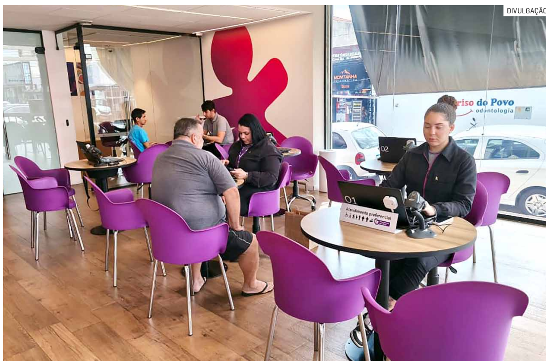
Das 2.973 vagas geradas, 2.393 tiveram origem no setor de serviços, 80,49% do total

Município contabiliza quase três mil empregos formais nos quatro primeiros meses deste ano e é a 12ª maior força empregadora entre as 645 cidades do Estado; setor de serviços faz maior parte das contratações de mão de obra