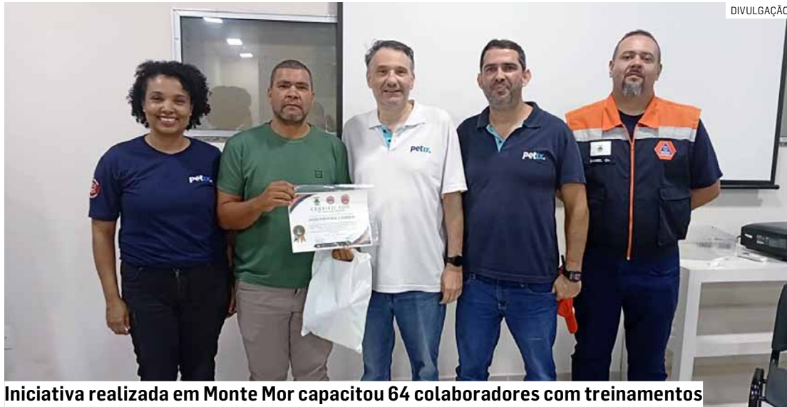
Iniciativa realizada em Monte Mor capacitou 64 colaboradores com treinamentos

A Secretaria de Defesa Civil de Monte Mor encerrou o projeto “Empresa Resiliente”. A ação foi desenvolvida em parceria com a empresa PETIX Indústria e Comércio e reforçou a integração entre o poder público e a iniciativa privada na promoção da prevenção, da segurança e da conscientização no ambiente de trabalho.