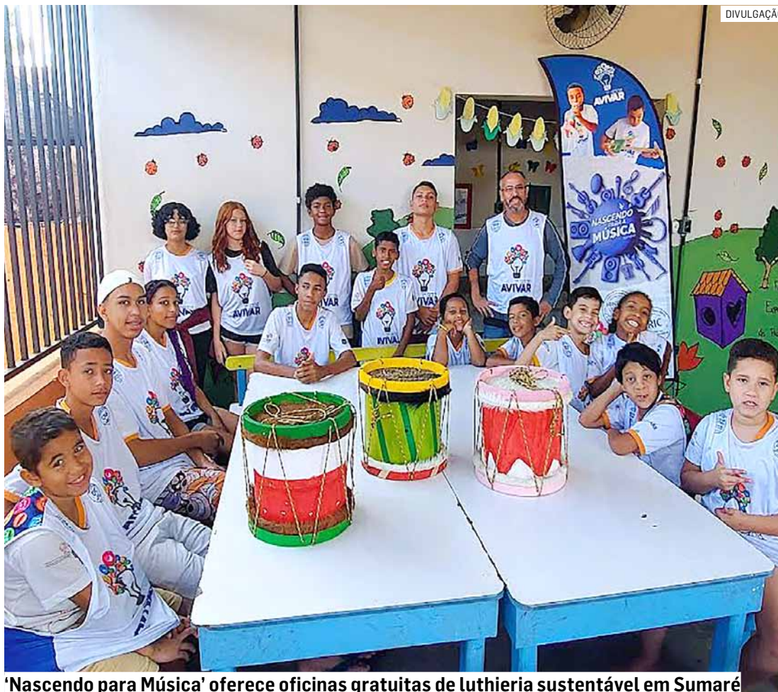
'Nascendo para Música' oferece oficinas gratuitas de lutheria sustentável em Sumaré

O curso de lutheria é dividido em três módulos. Um dos mais elogiados pelos participantes é o de Percussão e Vibração, no qual as crianças e adolescentes aprendem técnicas de construção, montagem e uso de instrumentos liga-