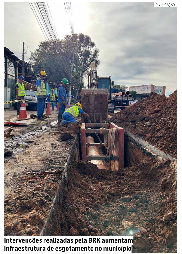
Intervenções realizadas pela BRK aumentam infraestrutura de esgotamento no município

Os avanços das obras podem ser acompanhados pelas redes sociais da BRK e pelo site Sumaré por um Novo Amanhã (www.sumareporumnovomanha.com.br). Em caso de dúvidas, os clientes podem entrar em contato com a concessionária pelo telefone 0800 771 0001, que funciona 24 horas por dia. Também é possível falar com a BRK pelo WhatsApp (11) 9 9988-0001, de segunda a sexta-feira, das 8h às 20h.