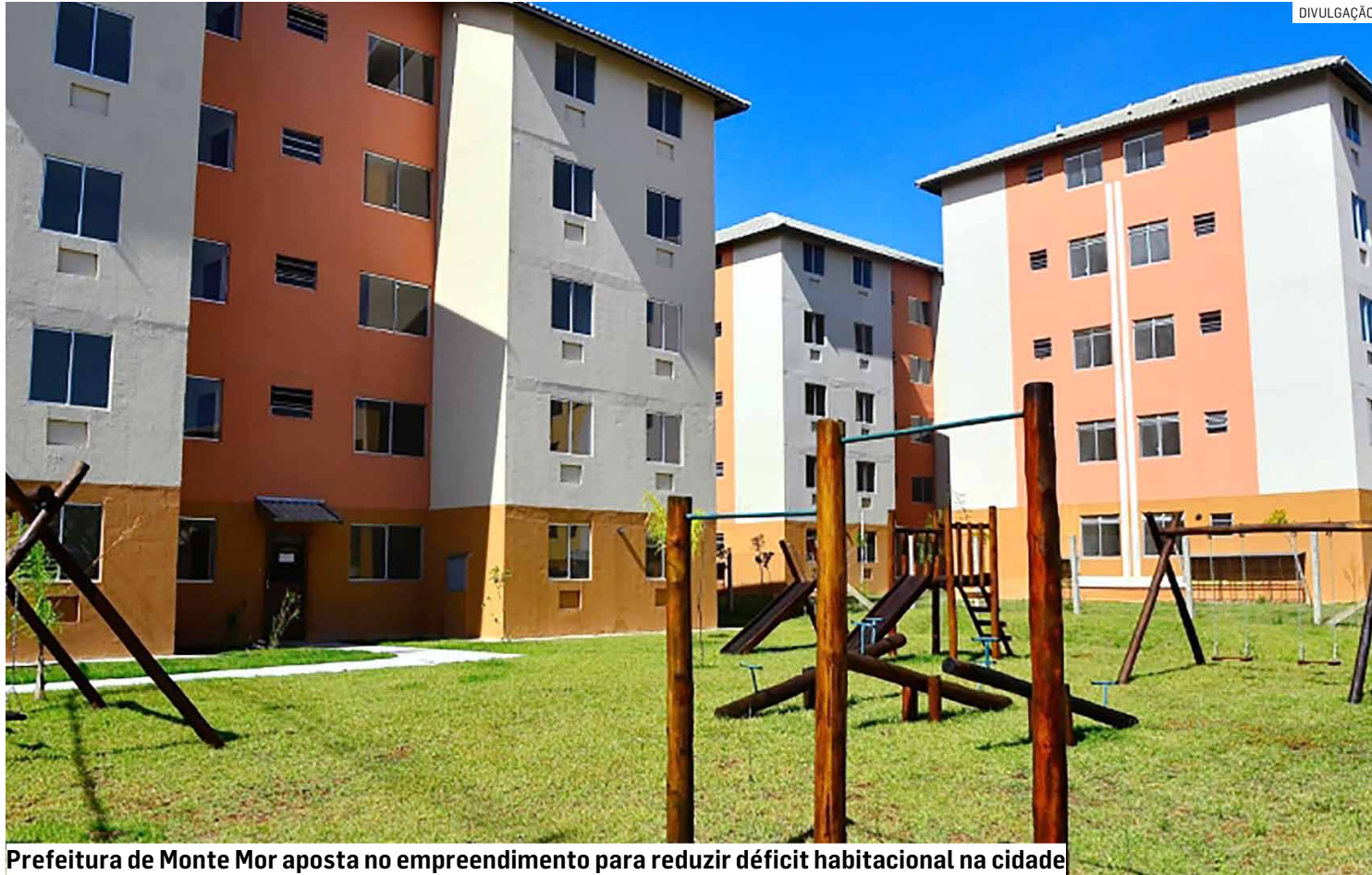
Prefeitura de Monte Mor aposta no empreendimento para reduzir déficit habitacional na cidade

Empreendimento habitacional será construído no Jardim Vitória e atenderá famílias em busca da casa própria; projeto faz parte do Minha Casa, Minha Vida e já está na fase de credenciamento de construtoras, afirma município