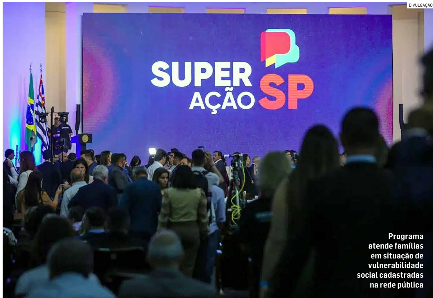
Programa atende famílias em situação de vulnerabilidade social cadastradas na rede pública

A proposta prevê o acompanhamento das famílias através de ações articuladas de assistência social, segurança alimentar, saúde, educação, habitação, qualificação profissional e geração de renda, aumentando as oportunidades de superação das condições de pobreza.