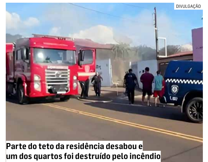
Parte do teto da residência desabou e um dos quartos foi destruído pelo incêndio

As causas da explosão deverão ser apuradas.