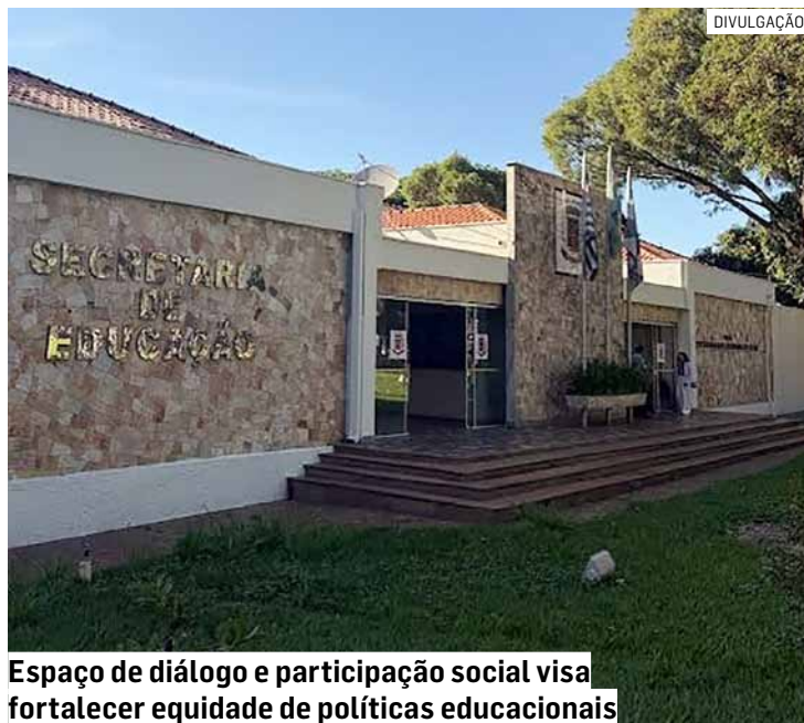
Espaço de diálogo e participação social visa fortalecer equidade de políticas educacionais

O Fórum Municipal de Educação será um espaço permanente de diálogo, participação social e construção coletiva das políticas públicas educacionais, com o objetivo de fortalecer a democracia, a qualidade e a equidade da educação em Nova Odessa.