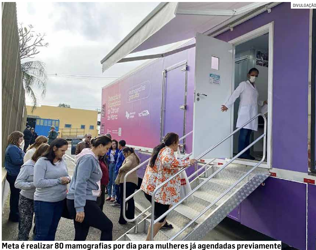
Meta é realizar 80 mamografias por dia para mulheres já agendadas previamente

À medida que chegavam, as pacientes eram encaminhadas para o atendimento em uma sala dentro da igreja, onde aguardavam serem chamadas. Para tor-