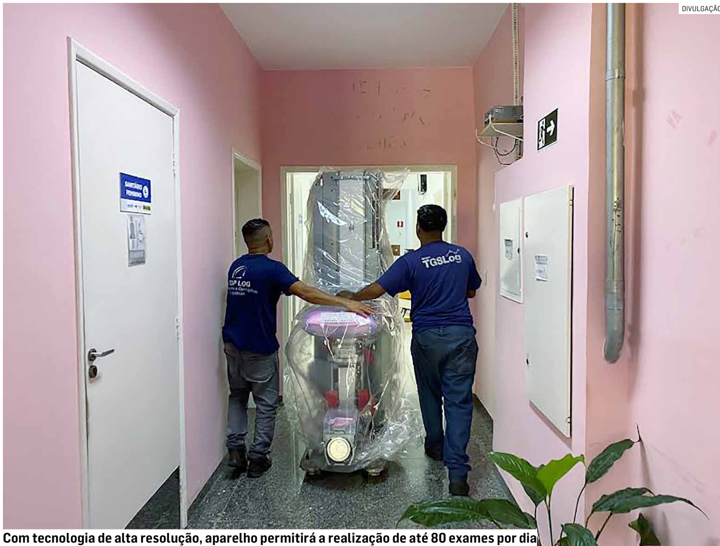
Com tecnologia de alta resolução, aparelho permitirá a realização de até 80 exames por dia

O mamógrafo ficará no CAISM. Ainda de acordo com a Secretária de Saúde, a empresa fabricante deu prazo de 15 dias para instalar o equipamento. Em seguida,