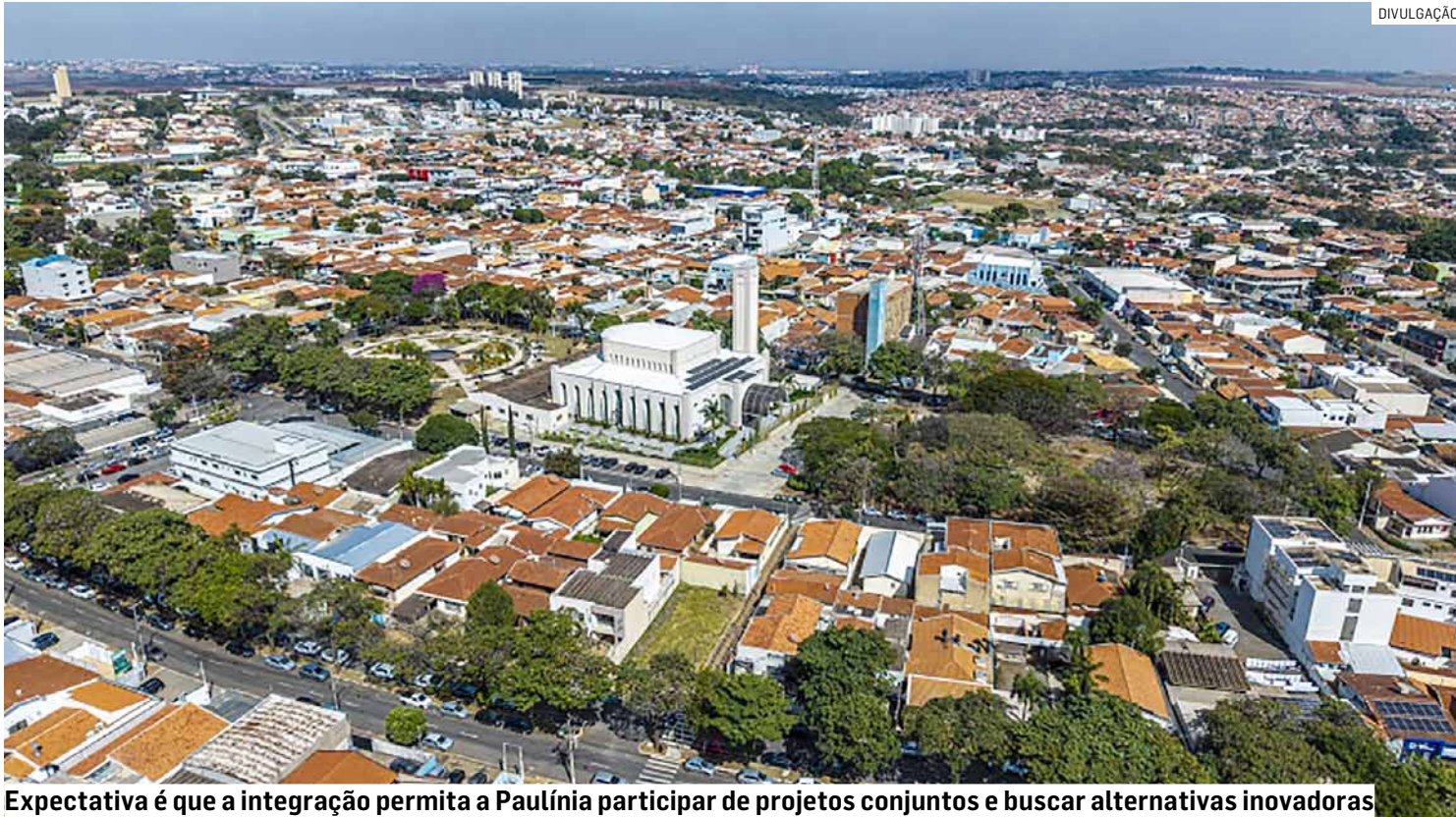
Expectativa é que a integração permita a Paulínia participar de projetos conjuntos e buscar alternativas inovadoras

Nova legislação autorizou município a integrar o Consórcio Intermunicipal para Desenvolvimento Sustentável, visando atuação conjunta com cidades próximas para planejamento, captação de recursos e execução de propostas