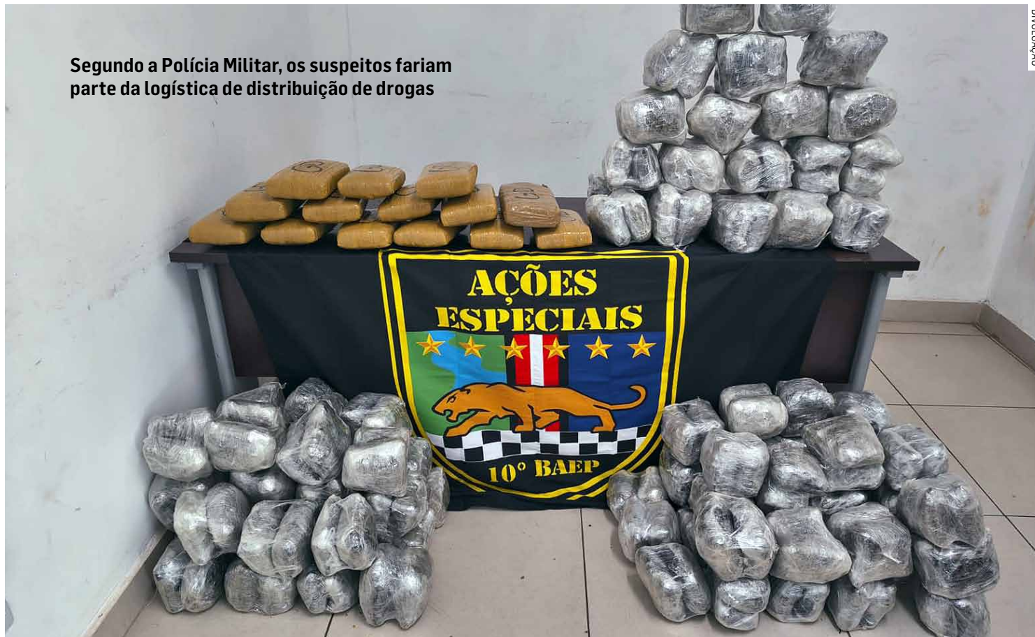
Segundo a Polícia Militar, os suspeitos fariam parte da logística de distribuição de drogas

A maior apreensão ocorreu em Sumaré, na Rodovia Anhanguera (SP-330), na altura do km 107. Após receber informações do se-