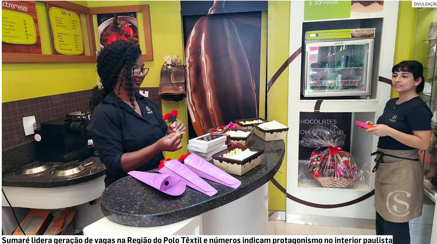
Sumaré lidera geração de vagas na Região do Polo Têxtil e números indicam protagonismo no interior paulista

A análise por atividade econômica mostra que o