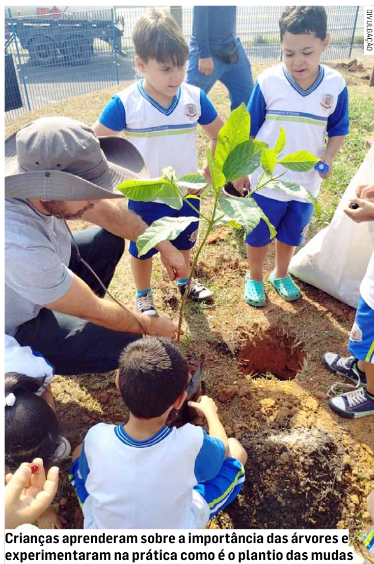
Crianças aprenderam sobre a importância das árvores e experimentaram na prática como é o plantio das mudas