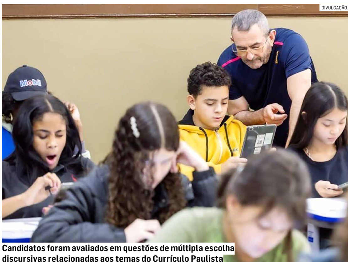
Candidatos foram avaliados em questões de múltipla escolha discursivas relacionadas aos temas do Currículo Paulista