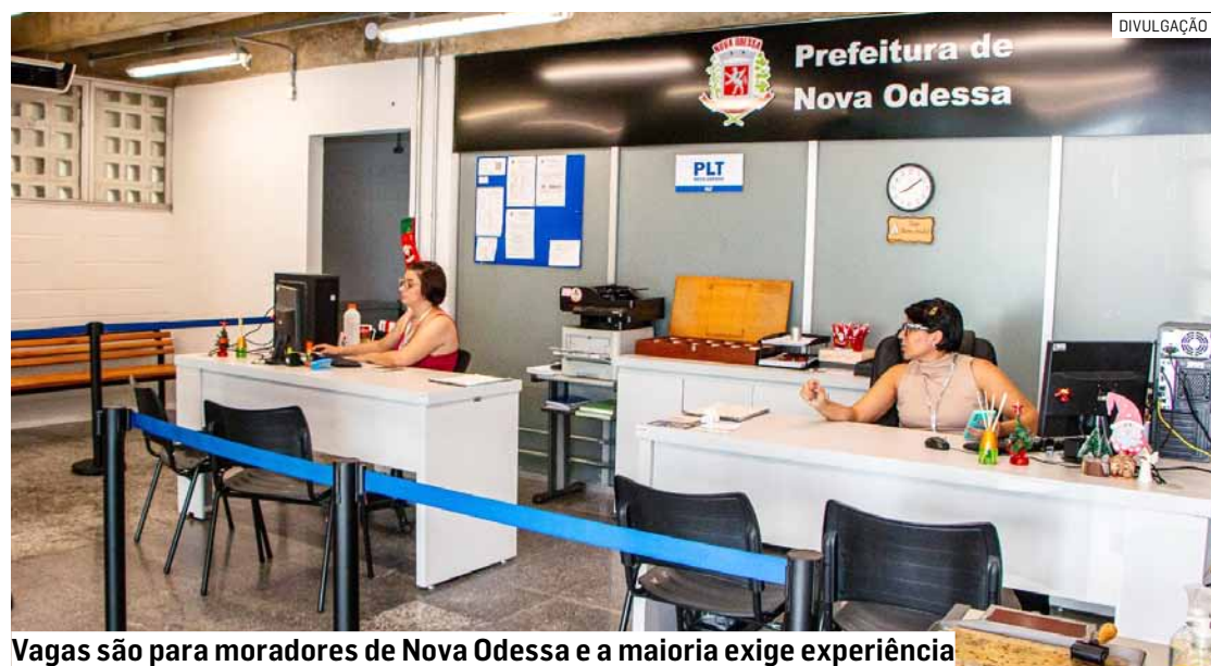
Vagas são para moradores de Nova Odessa e a maioria exige experiência

O PLT e os demais serviços municipais voltados ao mercado de trabalho atendem ao público no novo Poupatempo e CRET (Centro Municipal de Referência ao Empreendedor e Trabalhador), que fica na Rua Duque de Caixas, nº 600, no Centro - junto à recém-inaugurada unidade do Poupatempo Paulista na cidade.