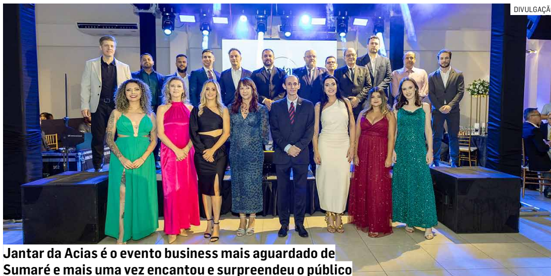
Jantar da Acias é o evento business mais aguardado de Sumaré e mais uma vez encantou e surpreendeu o público