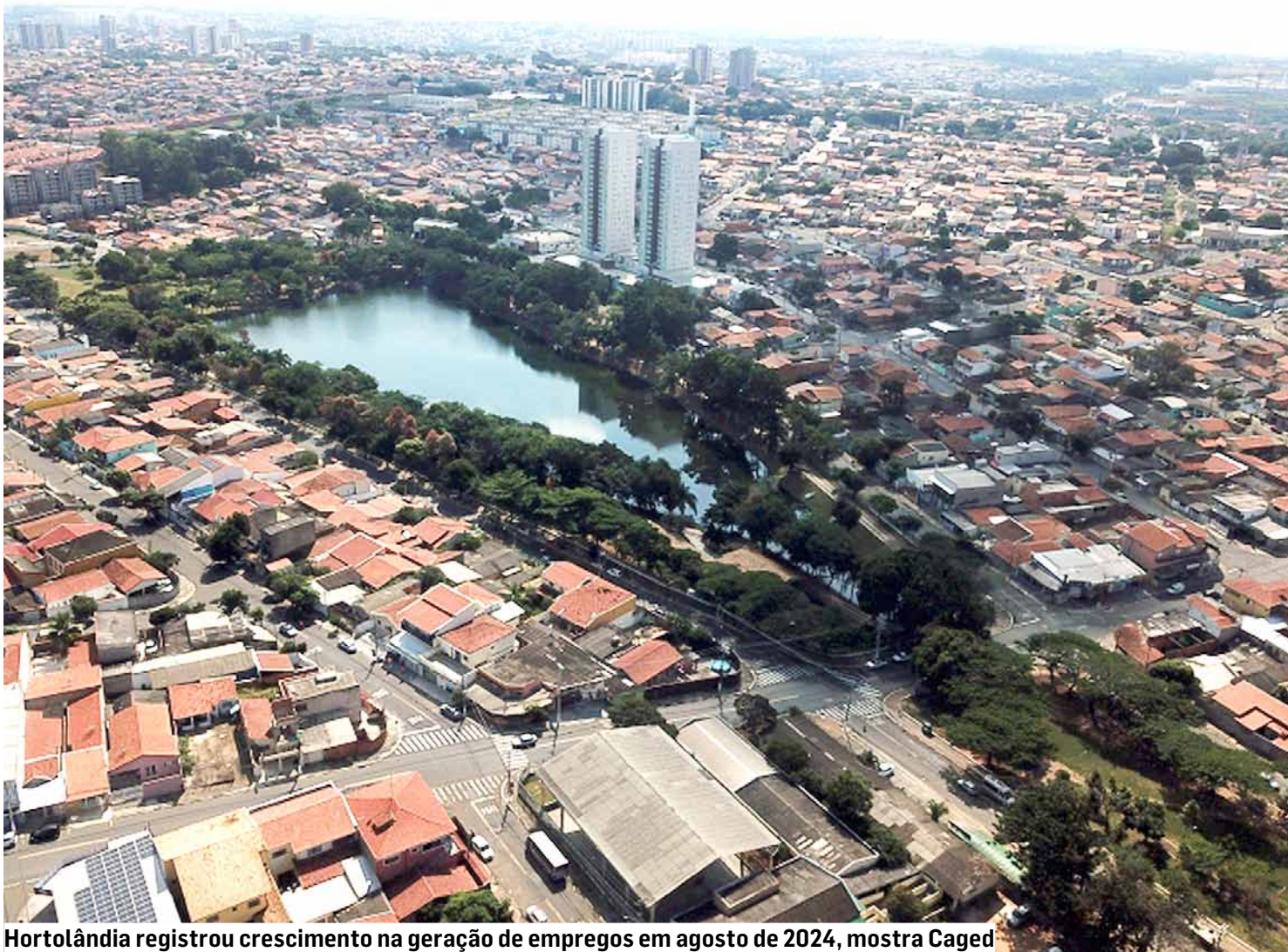
Hortolândia registrou crescimento na geração de empregos em agosto de 2024, mostra Caged

Sumaré, Hortolândia, Nova Odessa, Monte Mor e Paulínia fecharam o mês com saldo positivo de 758 empregos criados, aponta Caged (Cadastro Geral de Empregados e Desempregados)