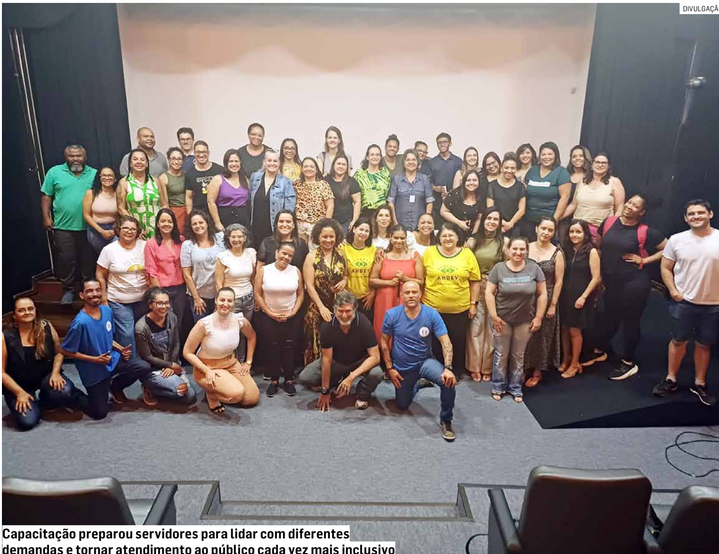
Capacitação preparou servidores para lidar com diferentes demandas e tornar atendimento ao público cada vez mais inclusivo

Evento aconteceu na Escola de Artes Augusto Boal, no Jardim Amanda e faz parte de uma série de ações promovidas pela administração municipal com o objetivo de melhorar a qualidade dos serviços oferecidos à população hortolandense