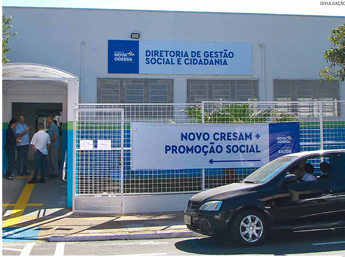
Retirada do cartão pode ser feita das 8h30 às 15h na Diretoria de Gestão Social e Cidadania

Atualmente, a cidade tem cerca de 1,9 mil famílias atendidas pelo Programa Bolsa Família têm, e todas devem retirar o cartão semestralmente. Cada cartão traz o nome e demais