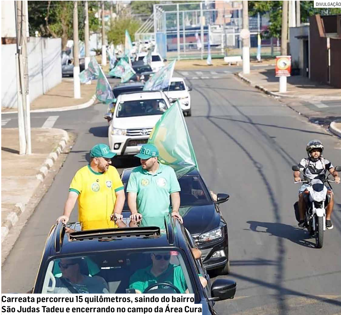
Carreata percorreu 15 quilômetros, saindo do bairro São Judas Tadeu e encerrando no campo da Área Cura

Para a organização, evento político realizado no último sábado, dia 28, reforçou a credibilidade das pesquisas eleitorais divulgadas e mostrou a força do time na cidade