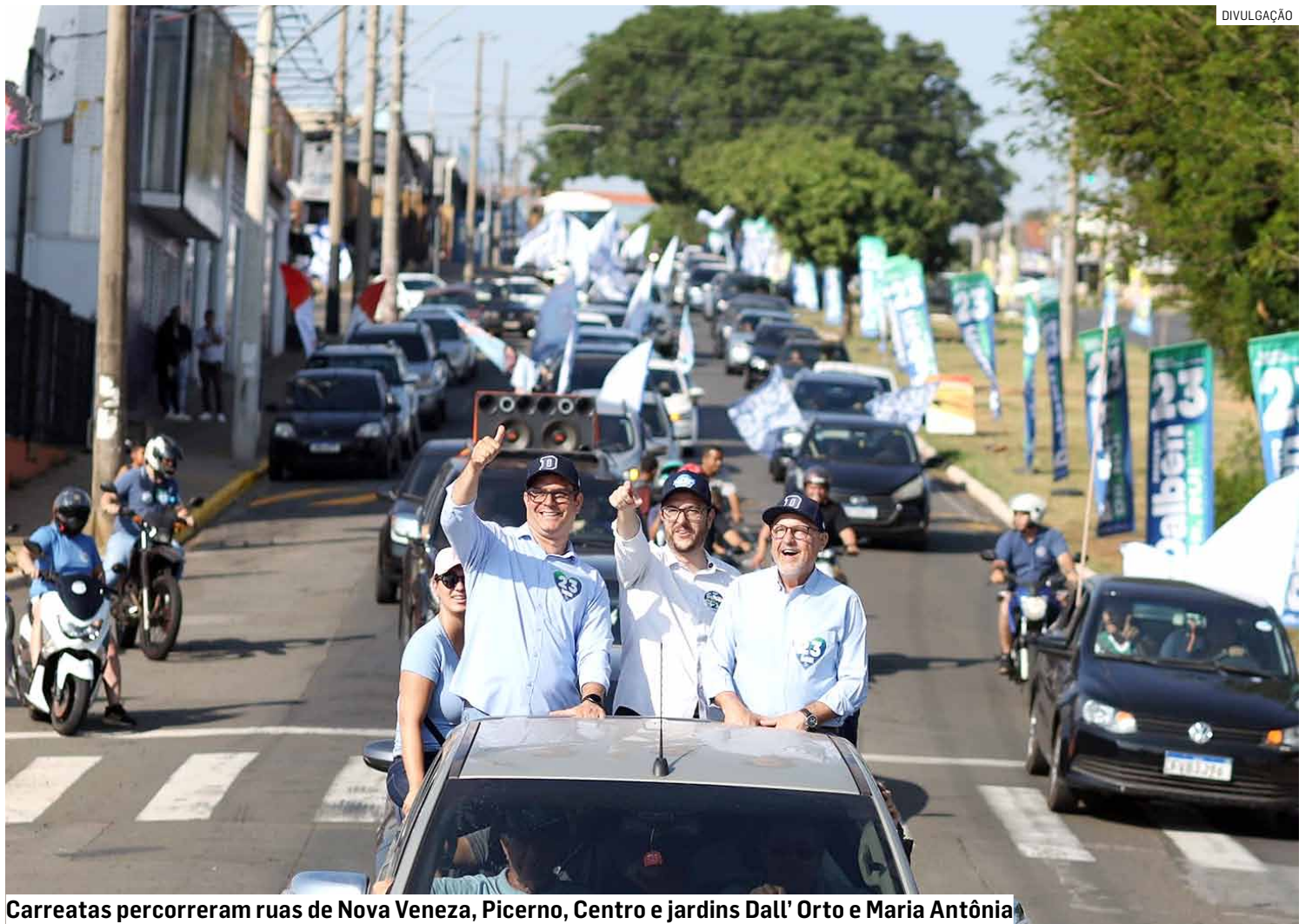
Carreatas percorreram ruas de Nova Veneza, Picerno, Centro e jardins Dall'Orto e Maria Antônia

A carreata de sábado passou pelo viaduto do Jardim Primavera, inaugurado nesta semana pela Prefeitura de Sumaré e pela Rumo, concessionária