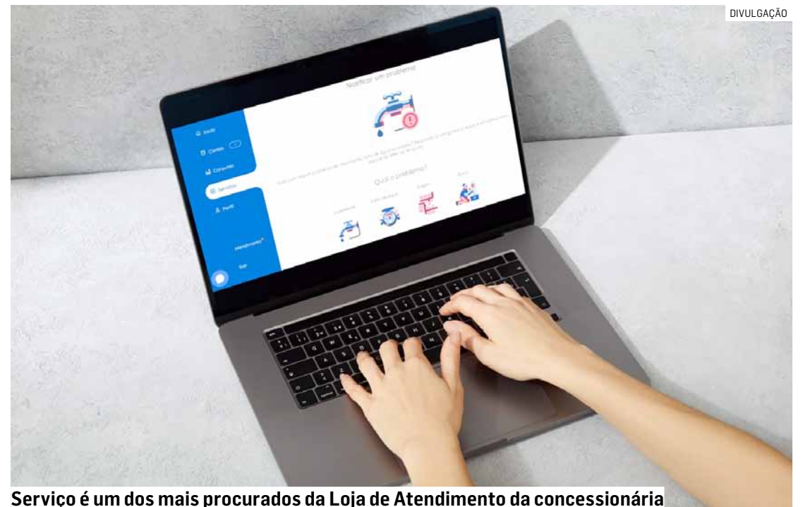
Serviço é um dos mais procurados da Loja de Atendimento da concessionária

Ao final, o cliente receberá um protocolo de atendimento e a área operacional da concessionária se-