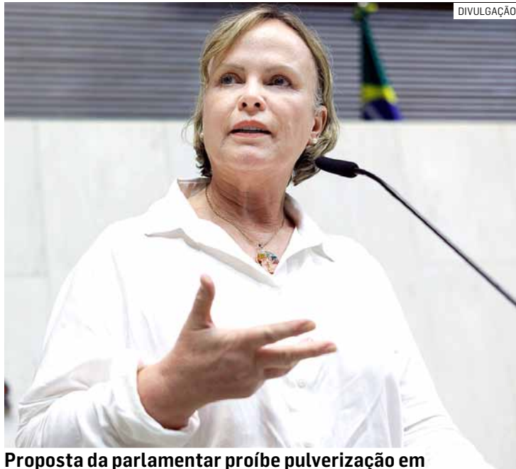
Proposta da parlamentar proíbe pulverização em áreas a menos de 300m de cidades, vilas e mananciais

O projeto mais recente, por sua vez, estabelece que o descumprimento da regra deve resultar em multa que varia de 500 a cinco mil Ufesp (unidades fiscais do Estado de São Paulo) - atualmente, entre R$ 17,7 mil e R$ 176,8 mil. Em caso de reincidência, de acordo com o texto, a multa deve ser dobrada.