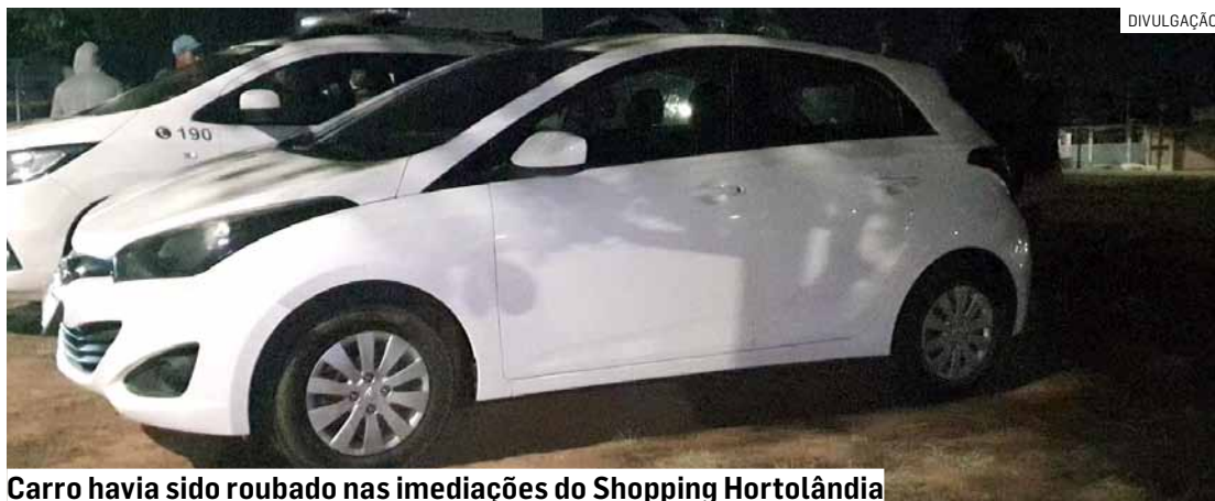
Carro havia sido roubado nas imediações do Shopping Hortolândia

A Polícia Militar deteve três adolescentes e um homem com um carro roubado na noite deste sábado (28), na rua Dez, no bairro Vila Real, em Hortolândia. O Copom (Centro de Operações da Polícia Militar) comunicou o roubo do veículo HB20 de cor branca, pelas imediações do Shopping Hortolândia, mais precisamente pela Rua Alberto Gomes. A equipe iniciou patrulhamento, quando avistou o veículo com quatro homens pela avenida Anhanguera. Houve um breve acompanhamento. A equipe ten-