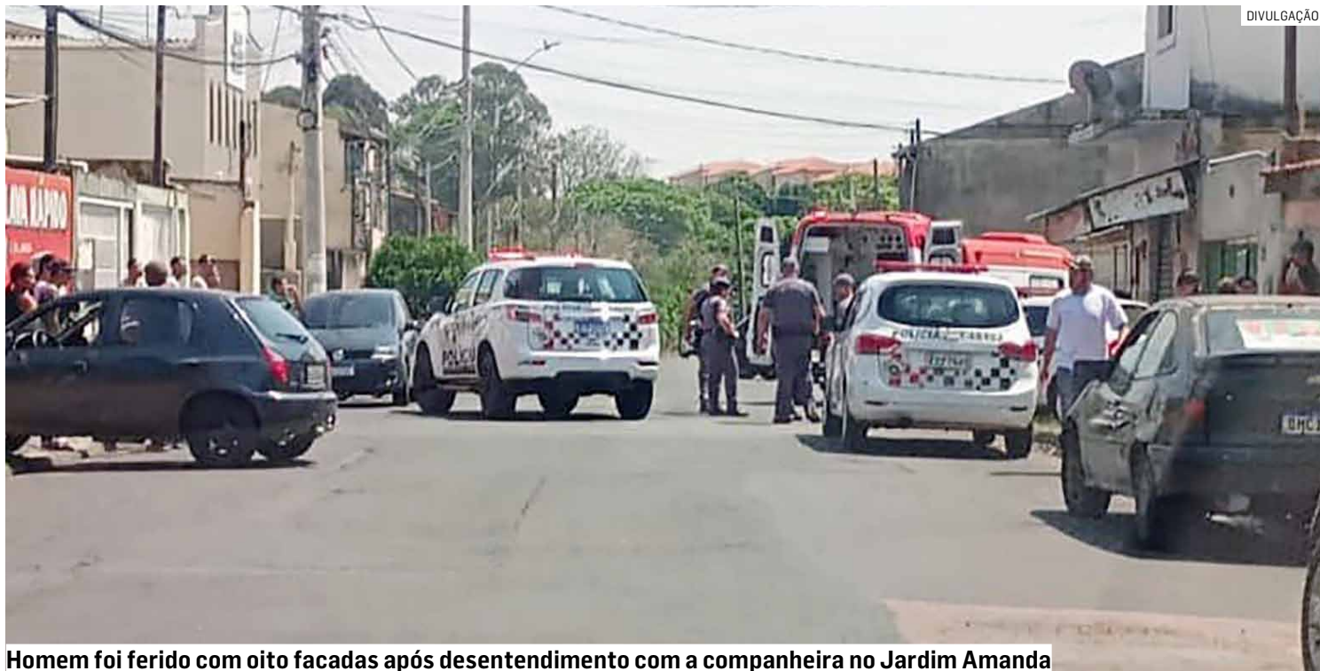
Homem foi ferido com oito facadas após desentendimento com a companheira no Jardim Amanda

Um homem de 45 anos foi preso em flagrante por violência doméstica, na noite deste domingo (29),