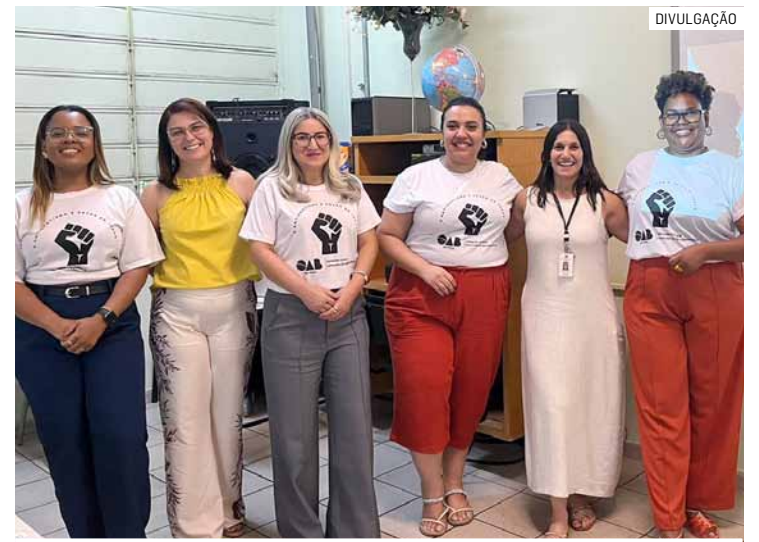
Comissão quer ampliar atividades para escolas particulares